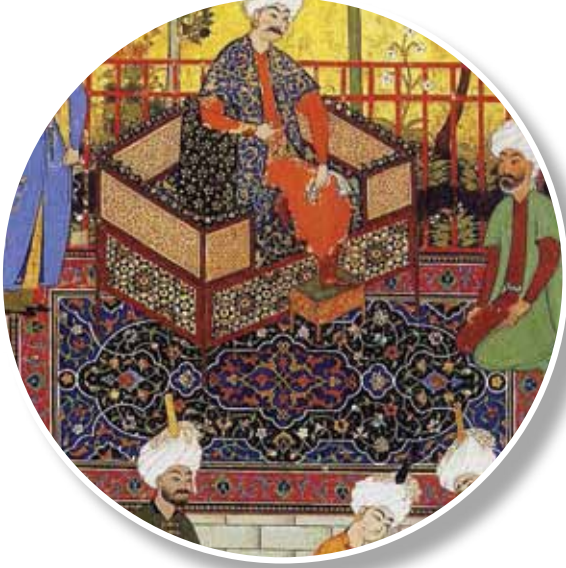
1524-1525, Nizami, Hamse, Tebriz Minyatür detay

1524-25, Nizami, Hamse, Tebriz 24 . “İskender Hakan’ın Kabulünde”.