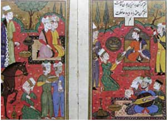
1460, Külliyyat-ı Kâtibî Minyatür

1460, Külliyyat-ı Kâtibî, Sultanın meclisi 10 . Sultan ve meclise iştirak edenler kahverengi zeminli bir halı üstünde tasvir edilmiştir.