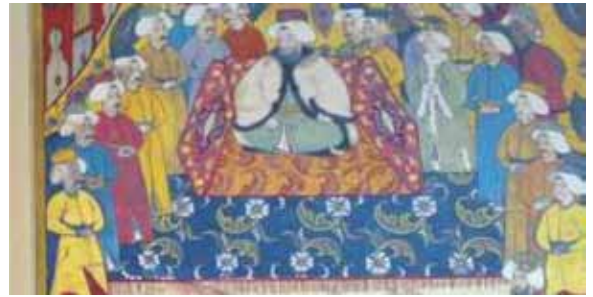
Levnî, Surname-i Vehbi Minyatürden detay

Padişah, koyu mavi zeminli kıvrık yaprak ve minelerle bezeli bir halı üstünde kurulu tahtta oturmaktadır.