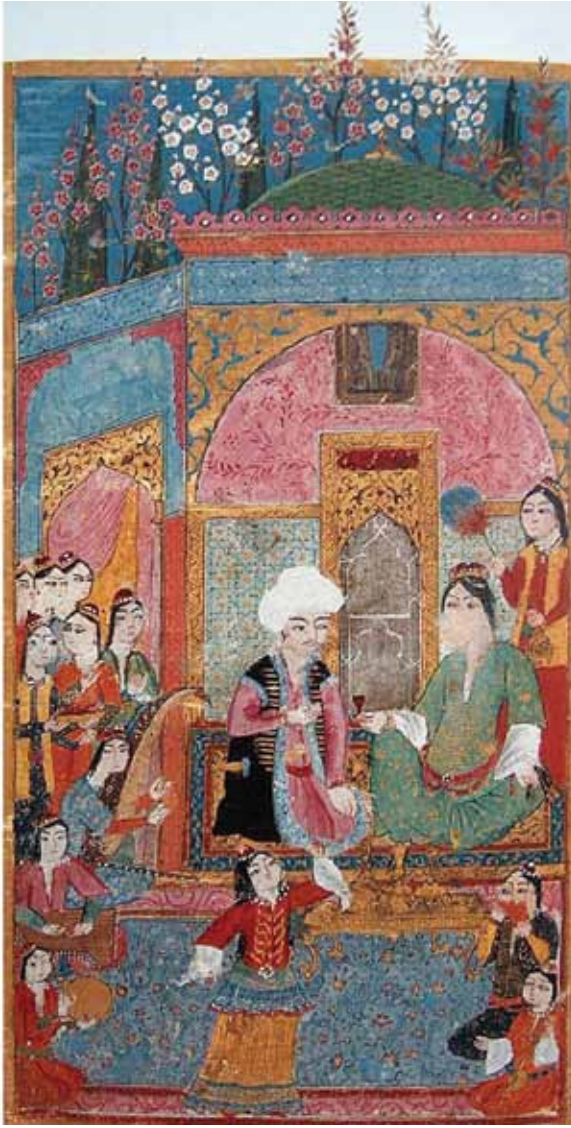
1595, Divan-ı Baki, LBL, Or. 7084, y. 10b Minyatür