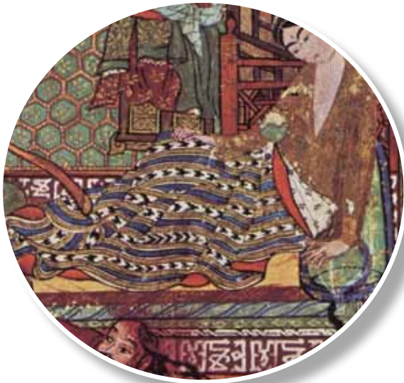
1360-1374, Kelile ve Dimne, Tebriz. Mihiyatürden detay