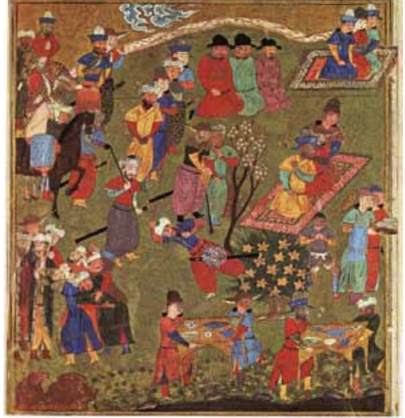
1444, Firdevsi, Şehname, Şiraz. Minyatür

Tabiat ortasına serilmiş iki ayrı halı üzerine oturmuş kişiler ile karşı karşıyayız. Üstteki parçada kırmızı zeminli, koyu renkli bordür içinde kûfi bezekli bir halı görülmektedir.