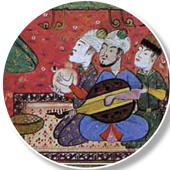
1460, Külliyyat-ı Kâtibî Minyatürden detay

1460, Külliyyat-ı Kâtibî, Sultanın meclisi 11 .