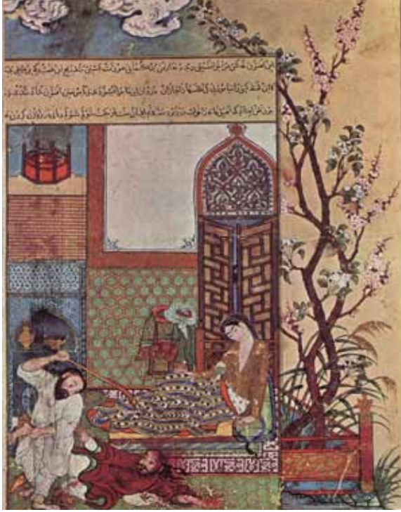
1360-1374, Kelile ve Dimne, Tebriz. Mihiyatür

Buradaki yatağın altında bir halı yer almaktadır: XIV. yüzyıl Tebriz ekolü eseri. Koyu kırmızı zeminli, kufi bezek bordürlü bir halı ile karşı karşıyayız.