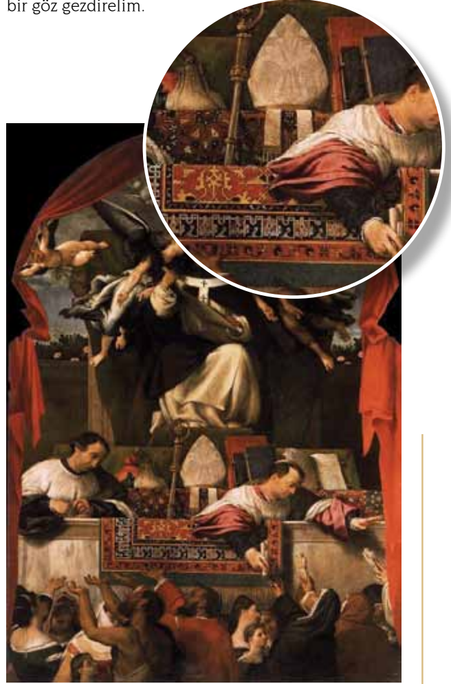
Lorenzo Lotto, (1480-1557)'in 1542 tarihli eseri

XV-XVI. yüzyıllardan itibaren batılı ressamın resimlerine girecek kadar Avrupa sosyal hayatında kullanılan halılar elbette orta şark minyatürlerinde de bulunmalıydı. Şimdi de minyatürlerdeki halılara bir göz gezdirelim.