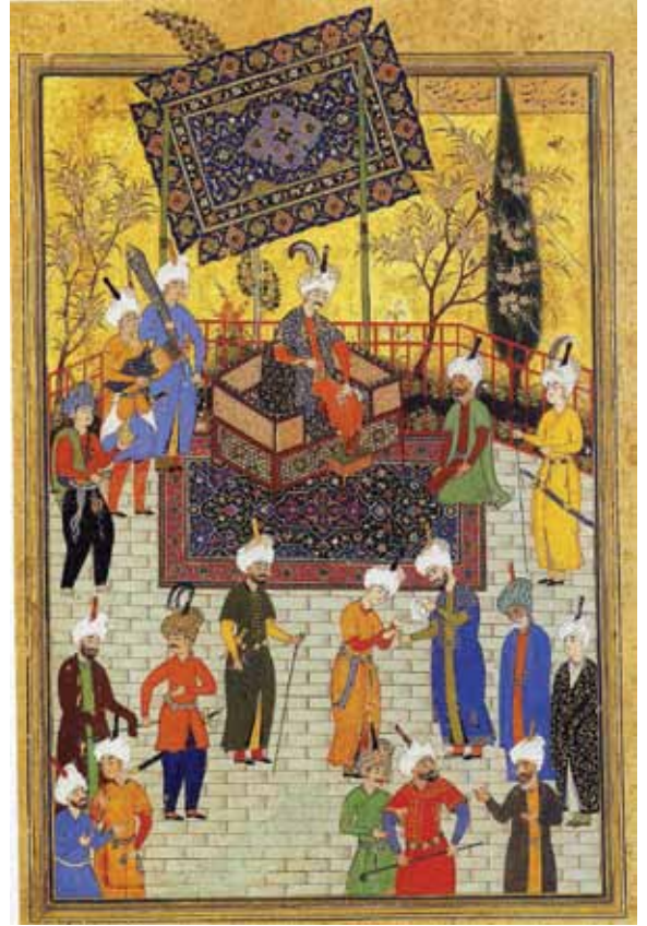
1524-1525, Nizami, Hamse, Tebriz Minyatür

1524-1525, Nizami, Hamse, Tebriz 23 . Şehzade Hüsrev’in tahta çıkması.