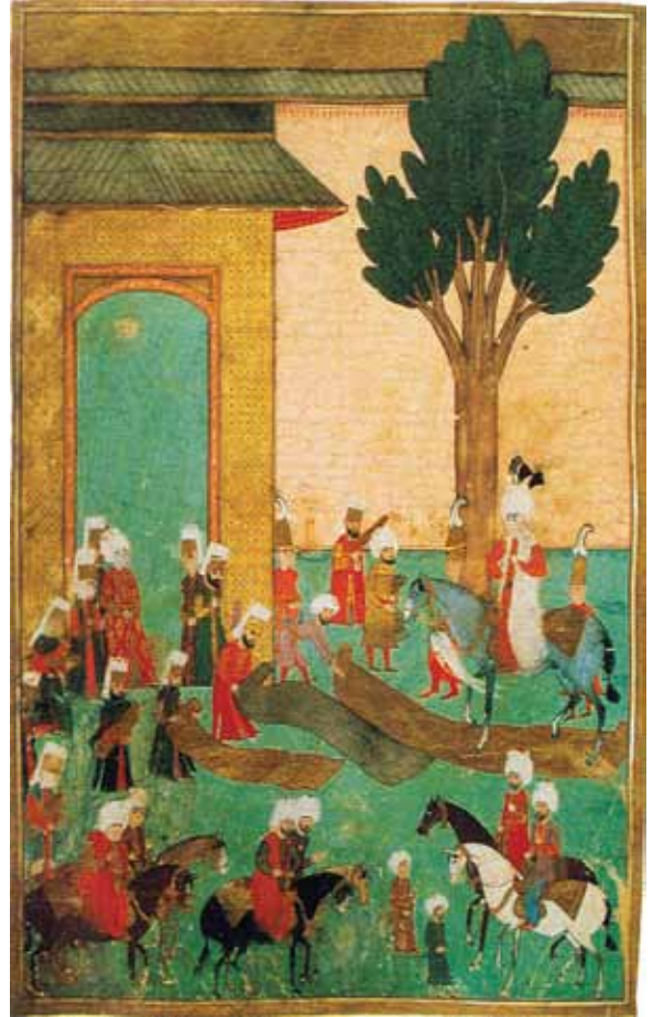
1587, Sûrnâme-i Hümâyûn, 1587 (TSM. H.1344), 12a Minyatür

Şehzade Mehmed, İbrahim Paşa sarayına atının ayağı altına yolluklar serilerek girmiştir.