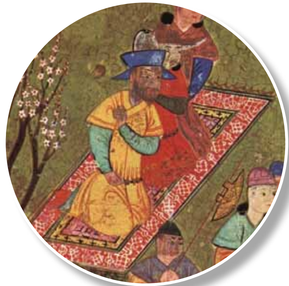
1444, Firdevsi, Şehname, Şiraz. Minyatürden detay