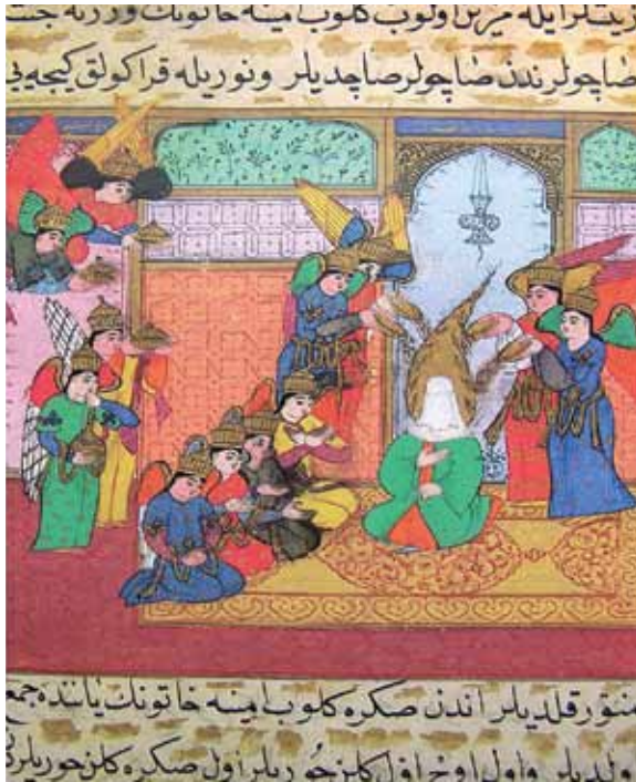
1595, Siyer-i Nebi I, TSMK H. 1221, 21b Minyatür