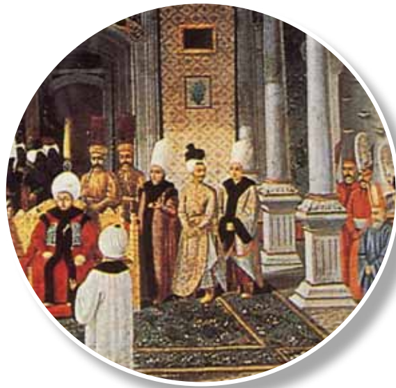
III. Selim detay