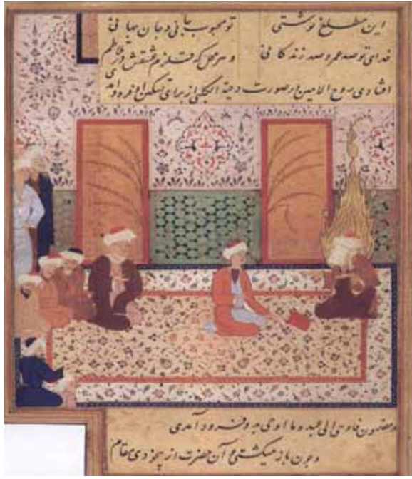
1469, Mansur, Herat Minyatür