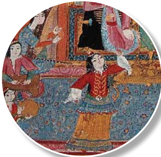
1595, Divan-ı Baki, LBL, Or. 7084, y. 10b Minyatürden detay

1595-1600, Humayunname, TSMK, 843, y. 163b 43 . Haremde hekim, halıların üstüne oturmuş hasta muayene ederken görülmektedir. Sürahi tutan kadın kenar bordürü açık mavi, koyu yeşil yaprak ve minelerle bezekli orta zemini deve tüyü renginde, kırmızı göbekli bir halı üstünde otururken tasvir edilmiştir.