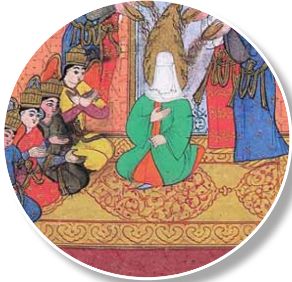
1595, Siyer-i Nebi I, TSMK H. 1221, 21b Minyatürden detay

Hazret-i Muhammed'in doğumu bir önceki minyatürden farklı olarak bir hasır üzerinde gerçekleşmiş olarak tasvir edilmiştir.