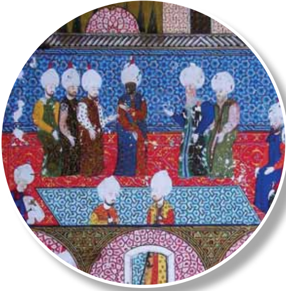
1558, Arifi, Süleymannâme Minyatürden detay

Kanunî Sultan Süleyman bir divan toplantısını büyük bir halı üstünde yapmaktadır. Kırmızı zeminli halının içi rumi kıvrımlarla bezenmiş göbekli bir halıdır.