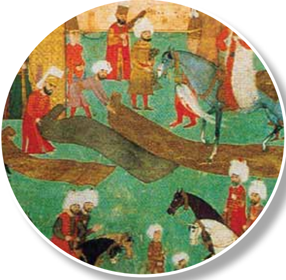
1587, Sûmâme-i Hümayûn, 1587 (TSM. H. 1344), 12a Minyatürden detay