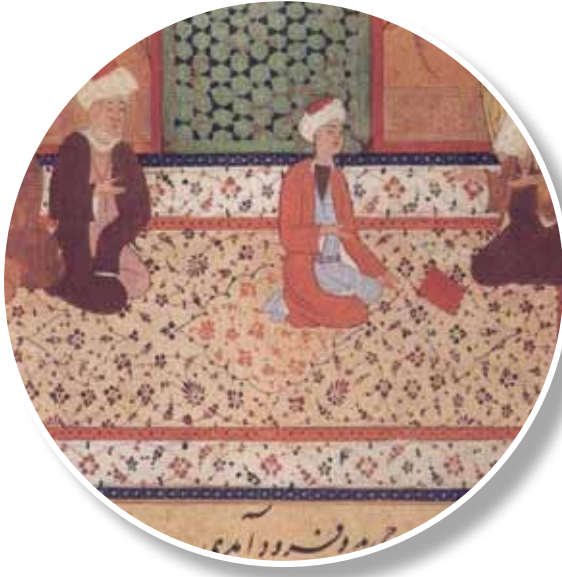
1469, Mansur, Herat Minyatürden detay

Kenar bordürü koyu ve içindeki desenli kısmı beyaz renkli, küçük yaprak ve çiçeklerle bezeli bir halı ile karşı karşıyayız. Ortada oturan şahsın altında yine aynı desenden bir de göbek bulunmaktadır.