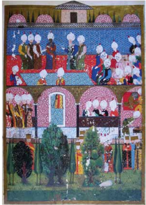
1558, Arifi, Süleymannâme Minyatür