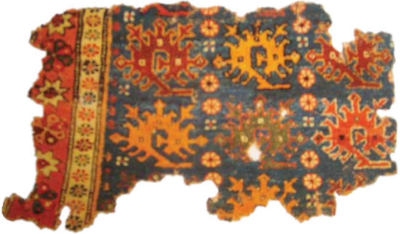
Foto 9. Ejder Motifli Halı Kültür Bakanlığı Katalog I, Model Kodu:009

Ejder: Efsanevi bir hayvan olan ejder yer ve gök ejderi olarak iki cinse ayrılıyordu. Tasavvurlara göre ilkbahar geldiğinde yer ejderi yerin altından yukarı doğru çıkarak “kök-luu” denilen gök ejderinin özelliklerine sahip olur. Kanatları, boynuzları pulları ile değişimi tamamladıktan sonra bulutların arasında uçmaya başlar. Yağmurun yağmasına o sebep olur. (Çoruhlu 1993:243)