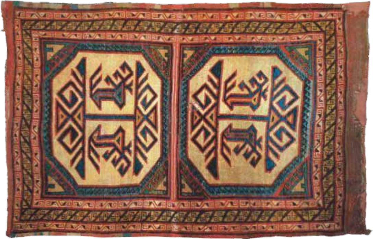
Foto 5. Hayat Ağaçlı Halı(Marby Halısı) Kültür Bakanlığı, Halı Katolog 4, Model Kodu:0435

davullarında bu ağacın kökleri dünyada değil daha çok göğün başladığı yerden itibaren gösteriliyordu. Altay yaratılış destanlarında anlatıldığı üzere bu ağacın dokuz dalı bulunuyor. Bu ağaca aynı zamanda "gök ağacı" da deniyordu. Bu ağaçlar genellikle gökteki bir dağ veya tepe üzerinde yer alıyor, bir yanında ay, diğer yanında güneş yer alıyordu (Gülensoy 1989:50).