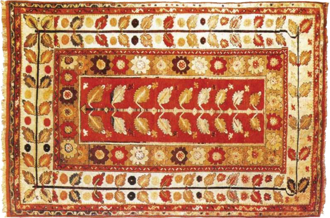
Foto 7. Tütünlü Milas Halısı, Hayat Ağacı Motifli, Model Kodu:0123