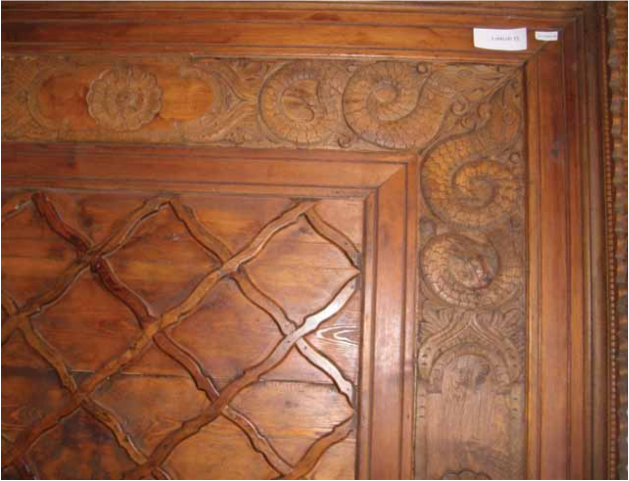
Foto 13. Milas Hacı Kadı Evi Tavan Göbeği Yılanlı Repredüksiyon Çalışması( Muğla Üniv. Milas Sitki Koçman M. Y.O. Restorasyon Programı)

de her köşede çift yılan motifi yer alır. Yöresinde “Yılanın başı küçükken ezilir” atasözü kötülüklerden kurtulmayla ilgilidir.