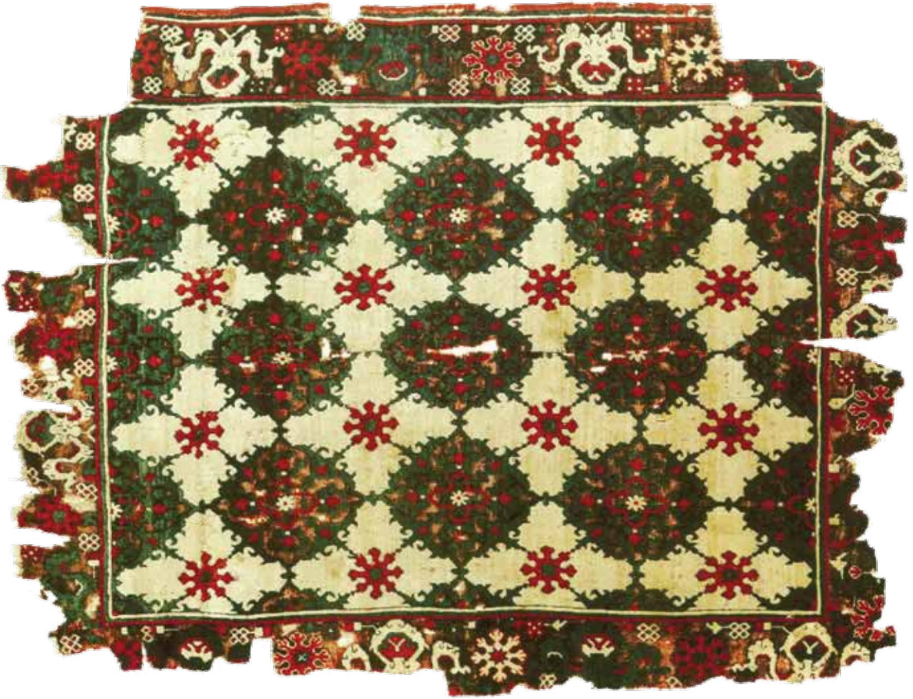
Foto 10. Beyaz zeminli Uşak Halısı (Ejder motifli), Model kodu: 188