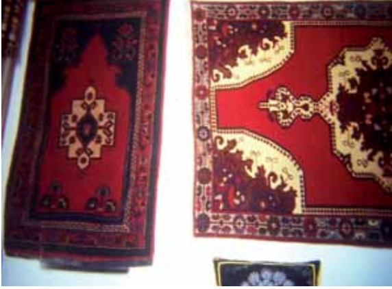
Foto 1. Duvara asılı halılar - Yenikent Kasabası / Aksaray