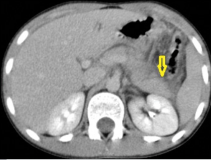
Resim 1. Pankreasta laserasyon