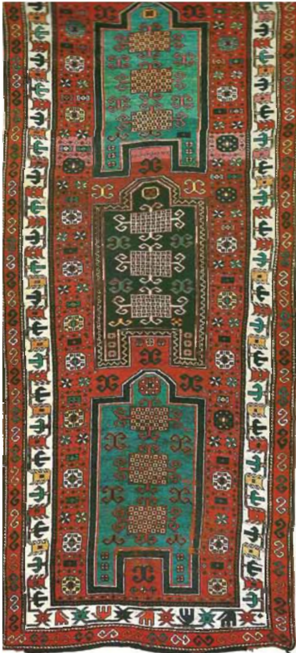
Foto 1. Kars Halısı. 19.yy.

baycan Devlet İncesenet Müzesinde korunan Demirciler isimli (Foto 2.) Gazah ekolüne ait halının (224 cm x 140 cm) bedii yapısıyla çok benzerdir. Bu dokumayı namazlık olarak nitelendirebiliriz. Dokumanın esas sahasının kenar kısımları kontürlerle dokunmuş başı mihrablı merkez göbek, mühür koymak için bölüm, alt kısımda ayakları koymak için iki çıkıntı, genel olarak göbeğin iç kısmını süsleyen kancalı geometrik desenler, stilize edilmiş bitkisel motifler, hatta bordürü süsleyen dal biçimli geometrik ve tekrar eden motifler Gazah'da dokunmuş orijinal dokumanın bir nevi kopyasıdır. Kars'ta dokunmuş örneğin bordüründe stilize edilmiş motiflerin bir detayını Azerbaycan halısındaki bordürle kıyaslayarak bu tarihi resmi örnek olarak sunmak istiyorum (Foto 3).