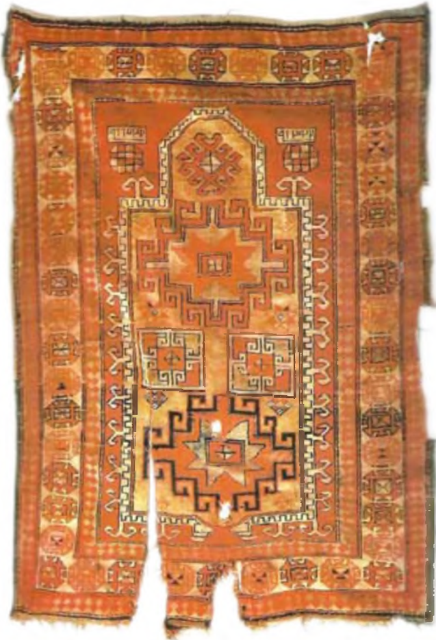
Foto 4. Kars Halısı.19.yy.