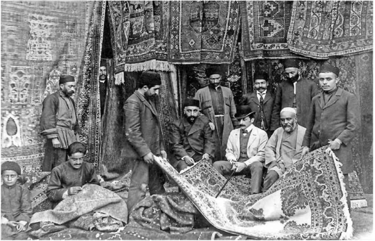
Foto 6. Halı Ticareti. 19. yy sonu

lup yakınlığı ile geleneği genetik yaşamasıyla alakalı olduğu düşüncesine katılmamıza hak veriyor.