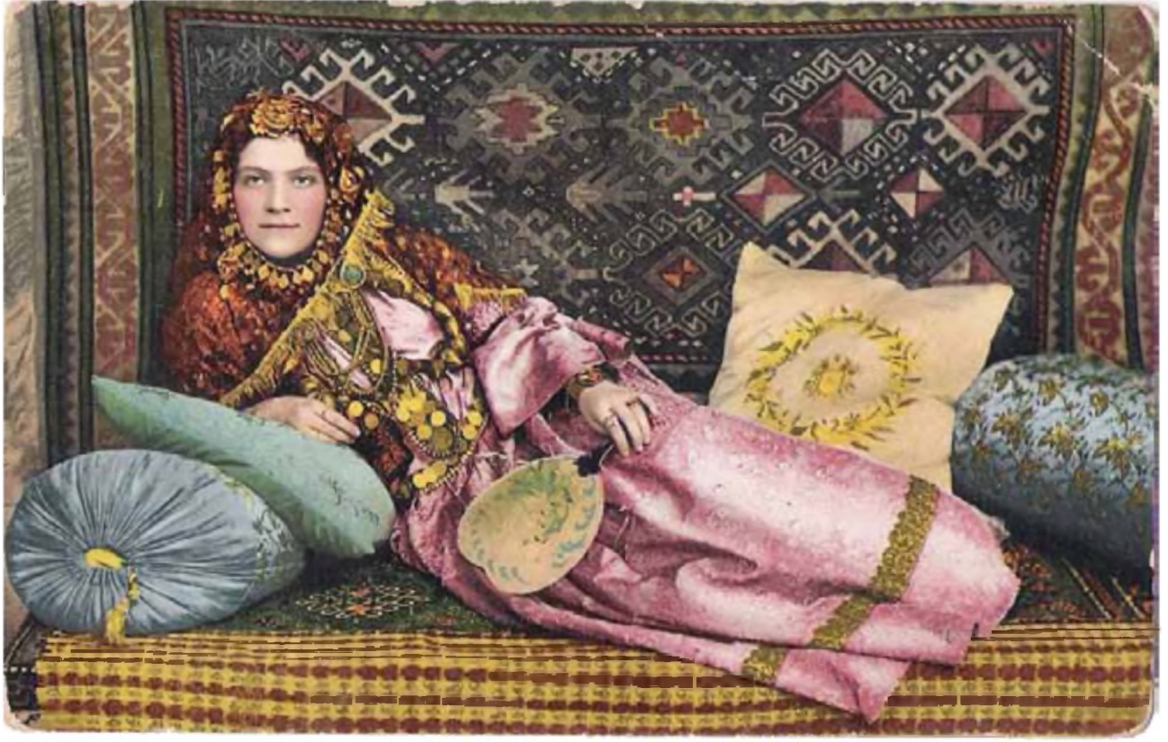
Foto 3 Arkada dokuma tarihi yazılı Gazah Halısı, Azerbaycan Milli Tarih Müzesi'nden.