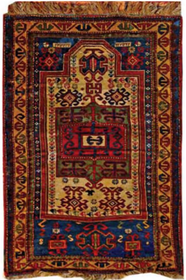
Foto 5. Gazah Halısı.19.yy.