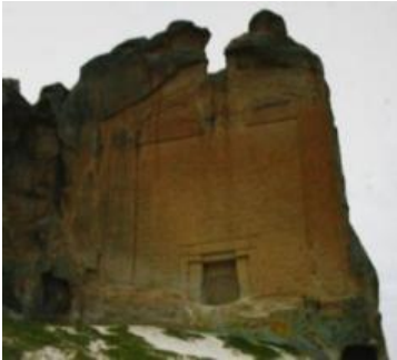
Resim 12. Midas Anıtı