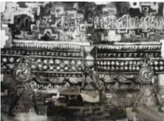
Resim 27, Aquatinta, “Frig Askerleri”, “Frigyadan”, Şaban UYSAL, 2016

Resim 25 ve Resim 26’da Frig kazılarında bulunan arkaik biçimli seramik kap ve seramik parçaları üzerine Friglere ait imgeler yorumlanmıştır. Aquatinta ve asite yedirme tekniklerinin uygulandığı Resim 25’te, arkaik seramik kap yüzeyinin sağ kenarında Ana Tanrıça ve kompozisyonun alt kısmında siyah leke etkisindeki geyik motifi kompozite yorumlanmıştır. Resim, siyah-beyaz-gri (akromatik) ton değerleri ile çalışılmıştır. Gri leke etkisinin hakim olduğu bu çalışma, az oranda kullanılan açık ve koyu lekelerle dengelenmiştir. Resim 26’da ise arkaik görünümlü seramik bir form üzerine yorumlanmış geyik motifi ve resmin üst kısmına yerleştirilmiş gri leke etkisindeki Frig Kaya anıtlarından bir görünüm dikkati çekmektedir. Linol Baskı tekniği ile yapılan bu çalışmada açık lekeler hakim olup, resmin belirli yerlerinde az oranda kullanılan koyu lekeler (siyah) ile resim dengelenmiştir.