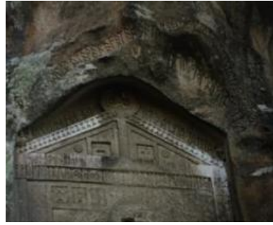
Resim 2. Areyastis Anıtı