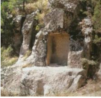
Resim 7.Sümbüllü Anıt