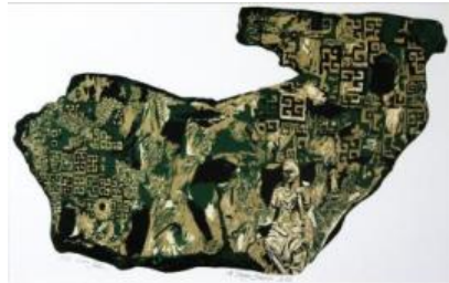
Resim 28, Linol Baskı, Mükerrem Derya BEREM, 2016