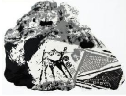
Resim 26, Linol Baskı, “Frig Özkan İMAL, 2016

Resim 25 ve Resim 26’da Frig kazılarında bulunan arkaik biçimli seramik kap ve seramik parçaları üzerine Friglere ait imgeler yorumlanmıştır. Aquatinta ve asite yedirme tekniklerinin uygulandığı Resim 25’te, arkaik seramik kap yüzeyinin sağ kenarında Ana Tanrıça ve kompozisyonun alt kısmında siyah leke etkisindeki geyik motifi kompozite yorumlanmıştır. Resim, siyah-beyaz-gri (akromatik) ton değerleri ile çalışılmıştır. Gri leke etkisinin hakim olduğu bu çalışma, az oranda kullanılan açık ve koyu lekelerle dengelenmiştir. Resim 26’da ise arkaik görünümlü seramik bir form üzerine yorumlanmış geyik motifi ve resmin üst kısmına yerleştirilmiş gri leke etkisindeki Frig Kaya anıtlarından bir görünüm dikkati çekmektedir. Linol Baskı tekniği ile yapılan bu çalışmada açık lekeler hakim olup, resmin belirli yerlerinde az oranda kullanılan koyu lekeler (siyah) ile resim dengelenmiştir.