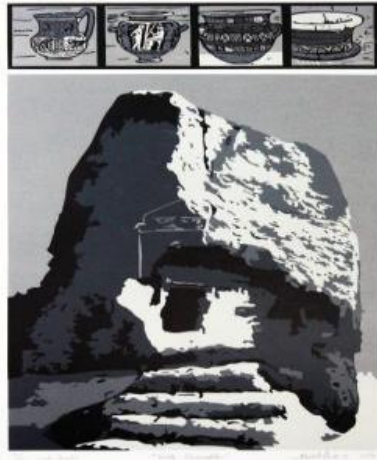
Resim 18, Linol Baskı, "Tarihin Basamakları", Ahmet POLAT, 2016