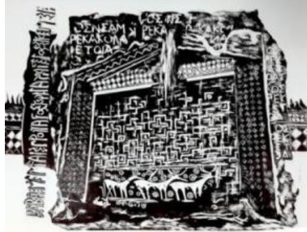
Resim 15, Aquatinta, “Yazılıkaya”, “Yazılıkaya-Midas Anıtı”, Şaban UYSAL, 2016