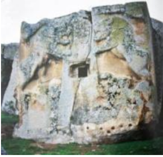
Resim 4. Aslantaş Anıtı/Mezarı