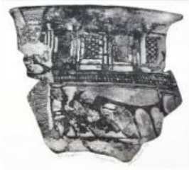
Resim 25, Aquatinta, “Frigya’dan”, Vadisi’nden”, Mükerrem Derya BEREM, 2016