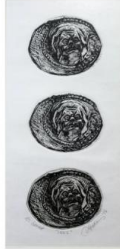
Resim 22, Aquatinta, Aysun ALIŞAN, 2016

Resim 21 ve Resim 22’de Frig Kralı Midas yorumlanmıştır. Eski Yunanca ve Latince kaynaklarda, Kral Midas “Dokunduğu Her şeyi Altına Çevirme Yeteneği” ve “Eşek Kulaklı Midas” efsaneleri ile bilinmektedir. Resim 21’de, Afyonkarahisar’ın İhsaniye İlçesi Döğer Kasabasında bulunan Aslankaya Anıt formu üzerine, Midas imgesi efsanede geçen” Eşek Kulakları” ile yorumlanmıştır. Eşek kulaklı Midas efsanesine göre;