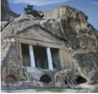
Resim10 Gerdek Kaya Anıtı