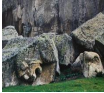
Resim 5. Yılantaş Anıtı/Mezarı