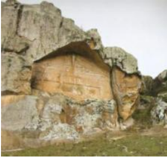
Resim 1. Bitmemiş Anıt