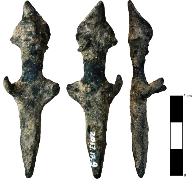
Resim 3. 2012.17.9 Envanter Numaralı Yapı-Adak Çivisi.