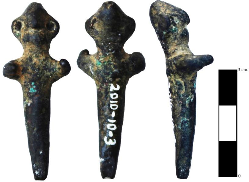
Resim 1. 2010.10.3 Envanter Numaralı Yapı-Adak Çivisi.