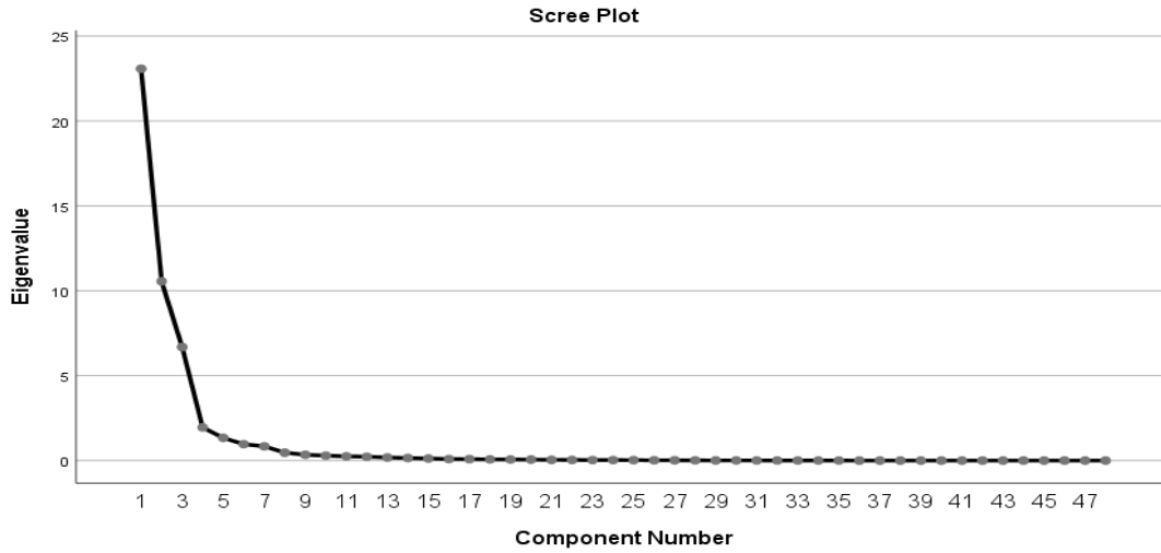
Şekil 1.Spor kulübüne güven ölçeğine ilişkin özdeğer çizgi grafiği

Ölçekteki faktörlerin isimlendirilmesi sürecinde aynı faktörlerdeki maddelerin içerikleri incelenmiş ve bu inceleme sonucunda birinci faktör antrenöre güven, ikinci faktör başkana güven ve üçüncü faktör sporcuya güven olarak adlandırılmıştır.