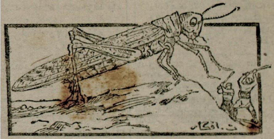
Çekirge mücadelesi ( Tasvir-i Efkar , sayı 1997, 30 Ocak 1917)

lanılmamıştır. Çekirgeye karşı mücadele vermek zorunda kalan halkın çalıştırılması için de asker sevk etmek gerekmiştir. 70 Mesela Aydın Vilayeti Ziraat Müdürü'nün 12 Temmuz 1914 tarihli raporuna göre, Aydın Vilayeti dâhilindeki mükellefleri sevk etmek için yeterli sayıda piyade ve süvari jandarması tayin edilmiştir. Vilayetin çekirgeli bölgeleri 158 parçaya ayrılmış, 538 piyade jandarması, 96 jandarma süvarisi ve 38 jandarma zâbiti ile 69 nizamiye zâbiti ilgili yerlerde görevlendirilmiştir. Sürfelerin bir an önce itlaf edilmesi gerektiğinden jandarma okulundan alınan 240 öğrenci bazı kazalara gönderilmiştir. 71 1918 senesinde ise Harbiye Nezareti'nden 1500 asker temin edilmiş ve bunlar Ankara ve Eskişehir civarına gönderilmiştir. Ticaret ve Ziraat Nazırı Mustafa Şeref Bey'in Meclis-i Mebusan'ın 18 Mart 1918 tarihli oturumundaki ifadesine göre, çekirge mücadelesi için Harbiye Nezareti'nden her yıl asker alınmıştır. Sürfelerin çıkacağı mahallere gönderilmeden önce, yapacakları iş doğrultusunda bunlara 15-20 gün eğitim verilmiştir. 72