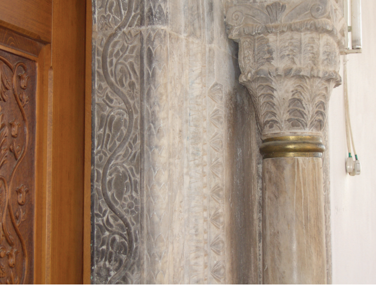
Fotoğraf 6. Hırka Köyü Camisi, eksenin doğusundaki taçkapı şeridi