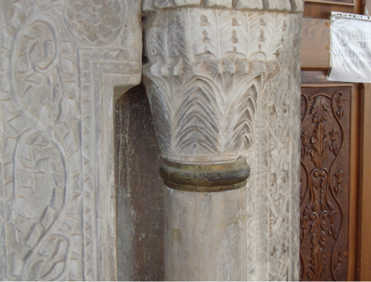
Fotoğraf 7. Hırka Köyü Camisi, eksenin batısındaki taçkapı şeridi