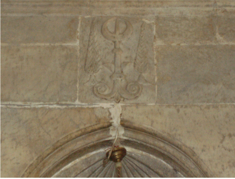
Fotoğraf 13. Hırka Köyü Camisi, mihrap kemerinin üzerindeki nesneli bezeme