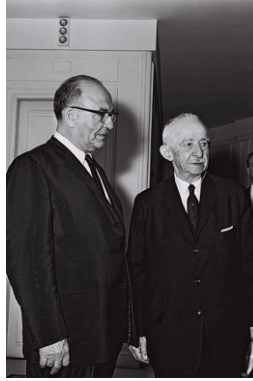
Resim: Levi Eřkol ve İsmet İnn

27 Mayıs ile beraber bittiđi iddialarının 115 aksine, yıllar sonra ortaya ıkan Eli Cohen’in operasyonlarına dair bilgiler ve 27 Mayıs sonrası devam eden MAH-Mossad iliřkisi ve irtibatı, iki Periferi doktrini bađlamında iki lke arasında kurulan istihbarat ve gvenlik iřbirliđinin hkmet bazında ilerlemediđinin en kıymetli gstergeleri olmuřtur. Ancak bu iliřkinin st siyasi desteđinin eksik kaldıđı bir gerektir. Bu durum, Trkiye’nin o dnemki i siyasi řartları, Kıbrıs meselesiyle meřguliyet, Johnson mektubu sonrası SSCB ile yakınlařma gibi rneklerle aıklanabilir