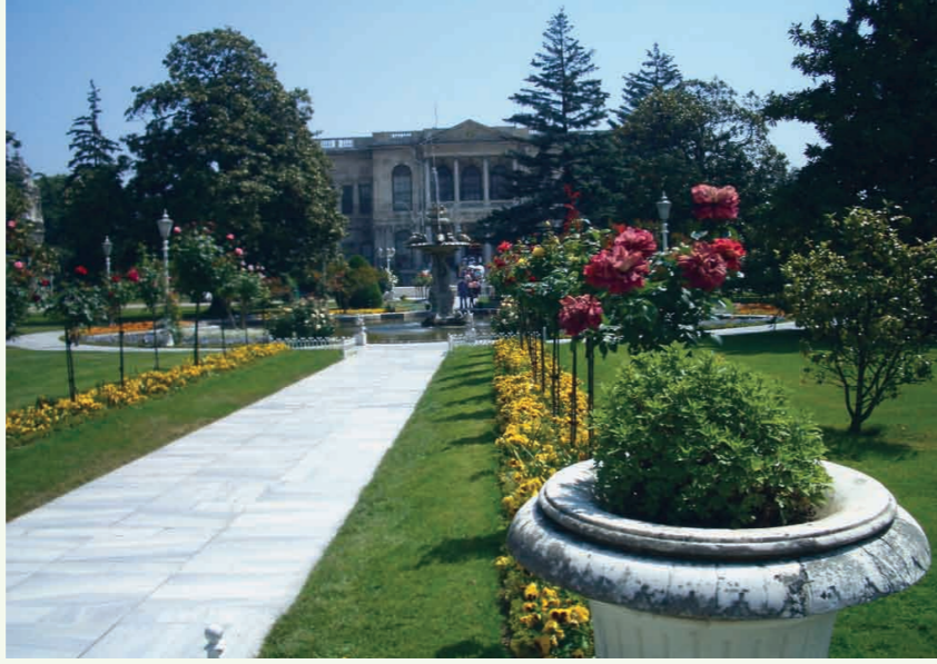
Resim 3. Dolmabahçe Sarayı Bahçesi.

Bugün Türkiye'de bu amaçla, bir yandan şimdiye kadar üniversitelerde yaptırılmış olan yüksek lisans ve doktora tezleri (Seçkin, 2000; Güloğlu, 2004) gibi mevcut akademik çalışmalara ilave olarak, özellikle bu konuda yeni akademik çalışmaların yapılması programlanmalı, teşvik edilmeli ve bu büyük potansiyelden olabildiğince yararlanılmalı, bir yandan da üniversite çevresinin yapıcı ve etkin yurt içi ve yurt dışı ilişkileri ve bu ilişkilerin projeye