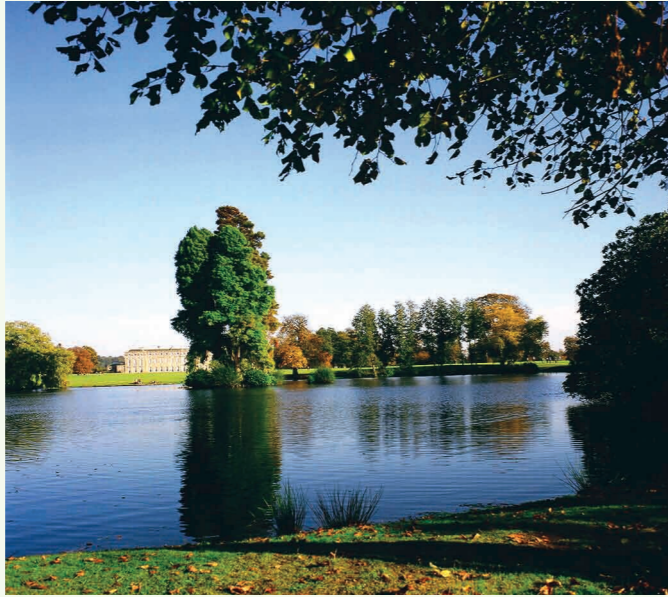
Resim 4. Petworth-House, West Sussex, İngiltere.

dönüştürülmesinin güçlü bir olasılık olmasının yanı sıra Avrupa Birliği destek fonu gibi olanaklardan yararlanılarak ulusal ve uluslararası ölçekte tarihî bahçe ve parkların envanteri yapılmalı ve veritabanları oluşturulmalıdır. Ulusal ve uluslararası ölçekte böyle bir çalışma için gerçekleştirilebilecek kapsamlı bir bilimsel tarama-araştırma programı, bir kurumun koordinatörlüğünde birçok kurumun katılımı ile yapılmalıdır. Bu çalışmaların amacı, mevcut tarihî bahçelerin koruma altına alınarak yaşatılması olmalıdır. Çünkü kültür ortamındaki etkileşimin bahçe sanatındaki tahribi çok fazla olmuştur. Bitkisel materyalin yapısal mimarî malzemenin daha