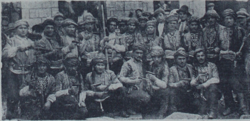
Maraşın kurtuluş bayramına iştirak eden maraşlı kahramanlar

Maraş, 12 (A.A.) — Maraş bugün kurtuluşunun 18 inci yıldönümünü büyük bir sevinç ve coşkunlukla kutladı. Cumhuriyet meydanını dolduran ve taşınan on binlerce halk büyük Önderin kurtarıcı bayrağı altında her zaman can vereceklerine bir daha and içtiler.