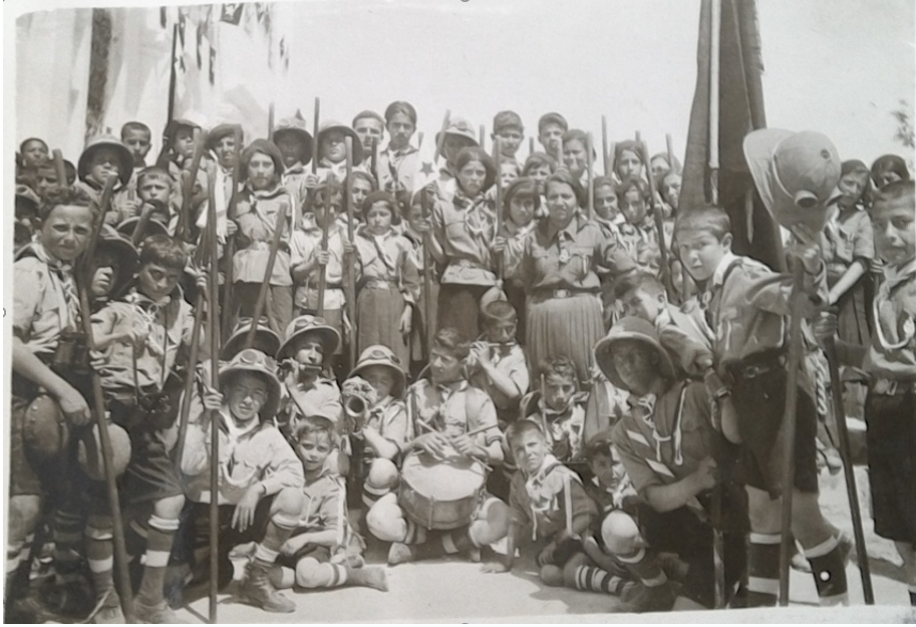
İzci takımı öğrencileri öğretmenleri ile birlikte.