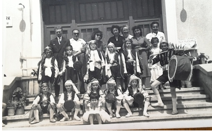
Zeybek oyunu oynayan öğrenciler, öğretmenleri ile birlikte.