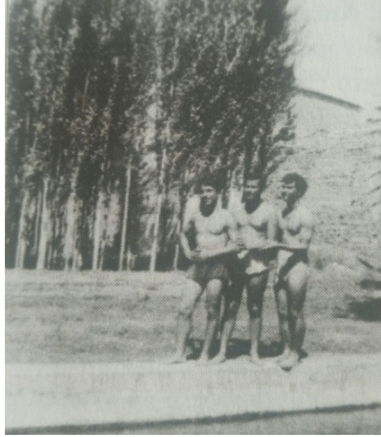
Akgün Gazetesi, 14 Ağustos 1939.