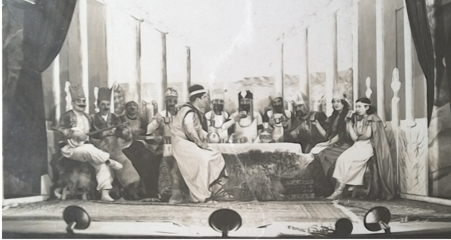
Sahnelenen tiyatro çalışmalarından bir görüntü.