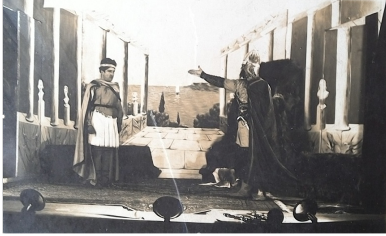
Sahnelenen tiyatro çalışmalarından bir görüntü.