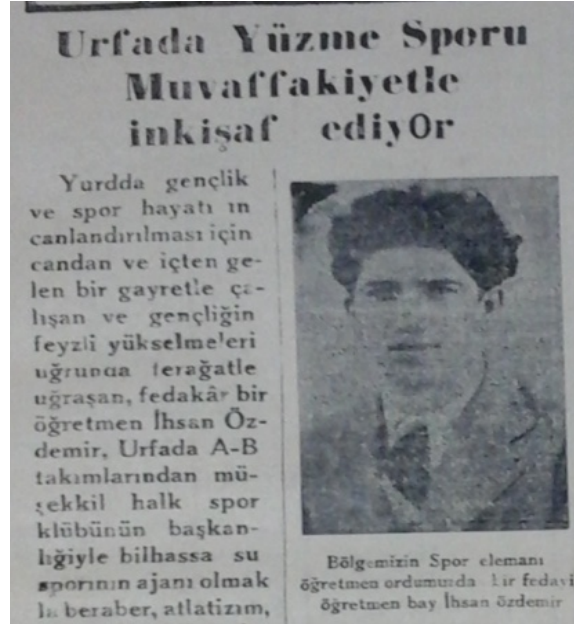
Yüzme takımı sporcuları.