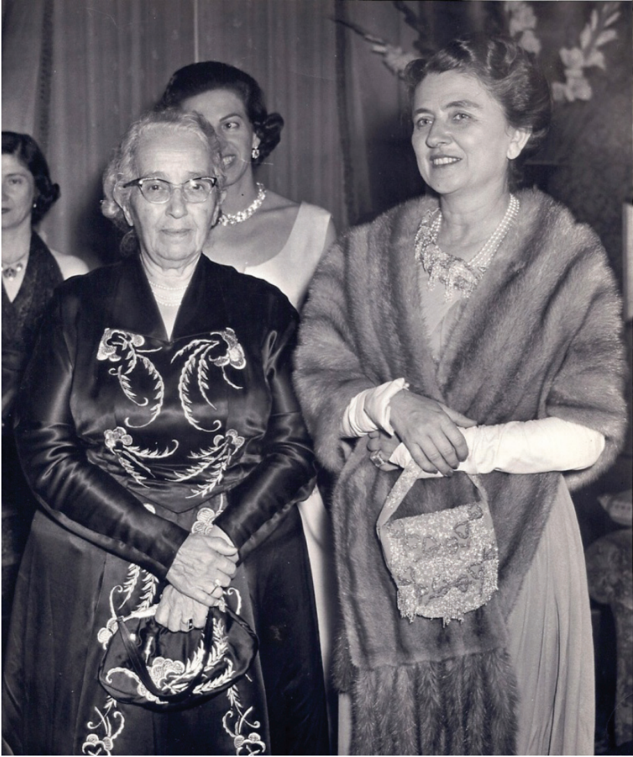
Reşide Bayar İtalya Cumhurbaşkanı eşi Carla Gronchi ile birlikte (1957)