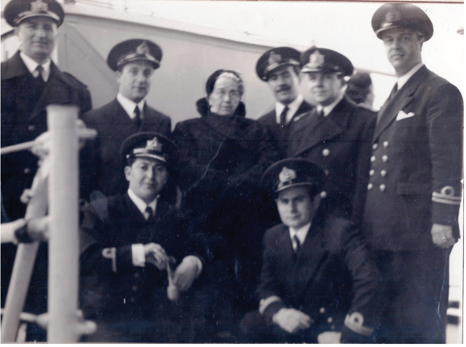
Reşide Bayar Savarona Yatı mürettebatı ile birlikte (1954)