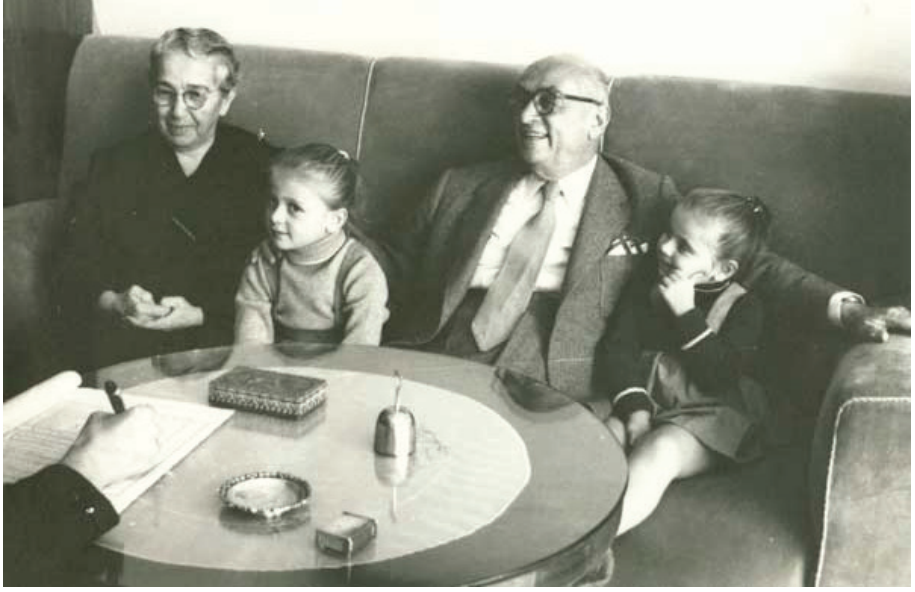
1955 Nüfus Sayımı Çankaya Köşkünde