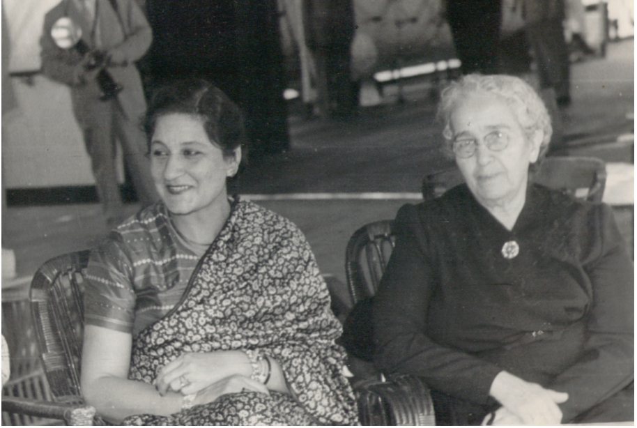
Reşide Bayar Hindistan Sefiresiyle