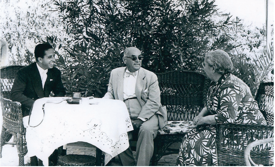
Reşide ve Celal Bayar Irak kralı Faysal ile Çeşme'de (1957)