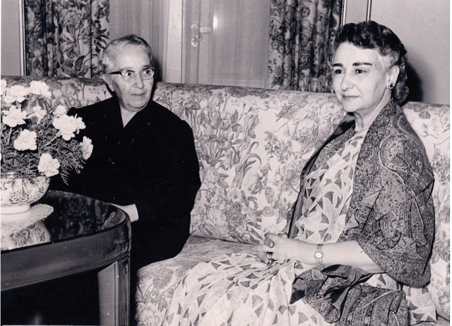
Reşide Bayar Çankaya Köşkü'nde Hindistan Sefiresi ile birlikte (1955)