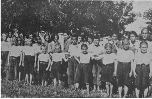
Karaağaç Azat Obası (Edirne)