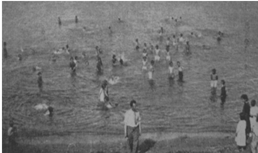
Maydos Azat Obası (Çanakkale)