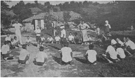
Velimeşe Azat Obası (Tekirdağ)