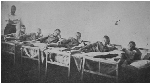
Çavuşköy Azat Obası (Çanakkale-Biga)

Kaynak: Trakya Umumi Müfettişliği Köy Bürosu, Trakya'da Azad Obaları, İstanbul: Ahmed İhsan Basimevi, 1939.