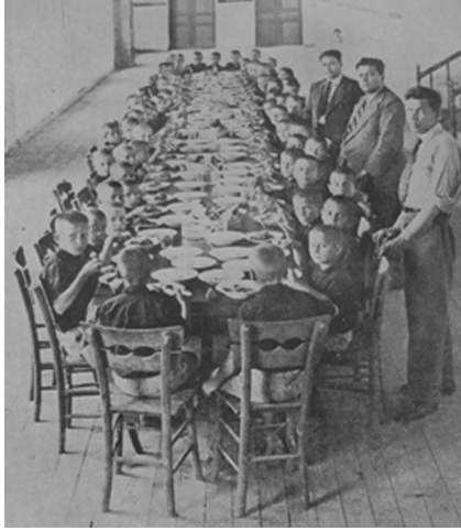
Saray Azat Obası (Tekirdağ)