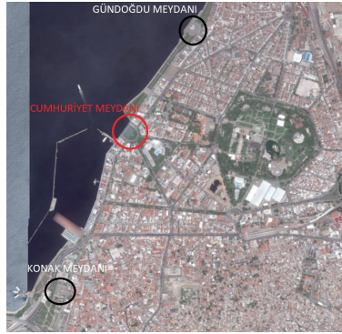
Resim 7: Kıyı şeridi boyunca meydanların yerleşimi