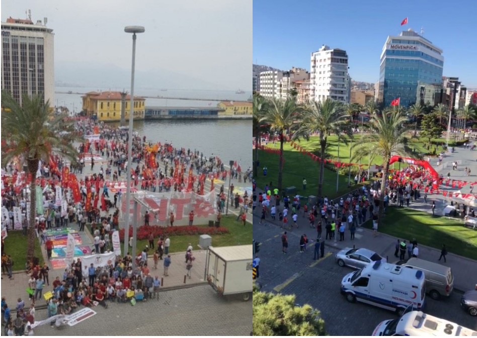
Resim 13: 1 Mayıs 2018 İş ve İşçi Bayramı gösterileri (Güngördü, 2018,3)