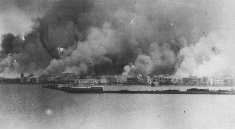
Resim 2: 1922 İzmir Yangını 1 (Serçe, Yılmaz, Yetkin, 2003, 22)

20. yüzyıl başlarında oldukça belirginleşen bu yapı, Resim 1’deki haritadan da görüleceği üzere, keskin ayrımlara sahne olmuştur. Ayrıca kentte yaşayanların sadece etnik kökenlerine göre değil, gelir düzeyine göre sosyal, kültürel ve mekânsal olarak ayrışmaları da bu dönem görülmüştür. Kentin kuzey bölgeleri (Frenk, Rum, Ermeni ve Musevi mahalleleri) diğer bölgelere göre daha refah ve daha bağımsız yaşam şekli sergilemiştir. Bu belirgin ayrım kent için büyük yıkımlara neden olan Kurtuluş Savaşı ve Büyük İzmir Yangını sonrasında ortadan kalkmıştır. Savaş sonrası yaşanan büyük yangın Ermeni Mahallesinin tamamı ile Frenk ve Rum Mahallelerinin önemli bir bölümünü oluşturan kuzey bölgesini yok etmiştir (Bilsel, 1999, 24-26). 1922 yılında meydana gelen yangın ile ilgili olarak dünya basınında birçok spekülasyon haber çıkmış, yangının başlama nedeni, başlatan kişiler uzunca süre tartışılmıştır. Sonuç olarak yangın sonrasında 19. yüzyılda önemli ticaret ve liman kenti olan İzmir, koca bir harabeye dönüşmüştür (Göktürk, 2012, 127-129 ve Kırışman, 2011, 82-86). Yaşanan tüm bu olumsuz olaylar İzmir’in kentsel oluşumu açısından yepyeni başlangıçlara neden olmuştur. Cumhuriyet dönemi İzmir kent planlamasının hayata geçirilmesi ile büyük ölçekli projeler geliştirilmiş ve bunun sonucu olarak da yeni bir süreç başlatmıştır (Bilsel, 2009, 12-17).