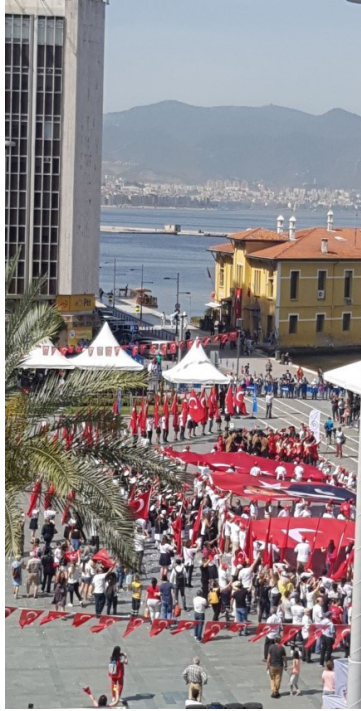
Resim 12: 19 Mayıs 2018 Atatürk'ü Anma Gençlik ve Spor Bayramı kutlamaları (Güngördü, 2018,2)

Meydan, kent belleğindeki konumunu koruyarak günümüz etkinliklerinde geçmişten gelen alışkanlık ile tören alanı olarak kullanılmaktadır. Meydanın 1930'lardaki eylemlere tanıklığını göz önünde bulundurursak, bugünün kullanımı da geçmişini anımsatma niteliği taşımaktadır.