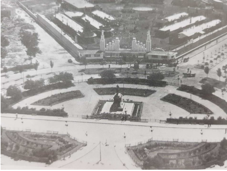
Resim 5: Prost-Danger Planına göre uygulanan dairesel formlu Cumhuriyet Meydanı oluşumu (Serçe ve diğerleri, 2003, 94)

Sonuç olarak 1930'lu yıllarda Yapı ve Yollar Kanununun ve Belediyeler Kanununun yürürlüğe girmesi ile Prost-Danger Planından uzaklaşmıştır. Yeni kanunlara göre imar şartları değiştiği için İzmir kentinde yeni imar planları hazırlanması süreci başlamıştır. 1951 yılında İzmir Belediyesi tarafından İzmir Şehri Uluslararası İmar Planı Yarışması düzenlenmiş ve yoğun ilgi gören yarışmaya 60'tan fazla proje katılmıştır. Bu projelerden ilk beşe girenler Belediye tarafından satın alınmıştır. 1965 yılında hızla artan nüfus ve kentleşme problemleri, yeni planların hazırlanmasını gündeme getirdiğinden İmar ve İskân Bakanlığı bünyesinde İzmir Metropolitan Alan Nazım Plan Bürosu kurulmuştur. Detaylı araştırma ve çalışmalar sonucunda bu büro tarafından hazırlanan plan ve rapor, 1973 yılında İmar ve İskân Bakanlığınca onaylanmış ve hayata geçirilmeye başlanmıştır. 1989 yılında değişen şartlar ve koşullar gereği geçerliliğini yitirmeye başlayan önceki planın yerine "1/25000 ölçekli İzmir Büyükşehir Bütünü Nazım Plan Revizyonu" yapılmıştır (İzmimod, 2016, 63-69). Bu tarihten sonraki uygulanan planlar modernleşen hayatın gerekliliklerinden dolayı kentsel olmaktan ziyade, daha bölgesel veya yerel yöneliktir.