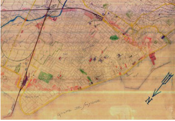
Resim 4: Prost-Danger Planı-1924 (Beyru, 2011, 50)

Birkaç ay devam eden araştırmaların sonrasında Henri Prost öncülüğünde iki kardeş, Rene ve Raymond Danger, İzmir'in imar planını 1924 yılı Eylül ayında tamamlayıp İzmir Belediyesine teslim etmişler ve 1925 yılı Ağustos ayında plan kabul edilerek, "Prost-Danger Planı" olarak uygulamaya konmuştur. (Resim 4)