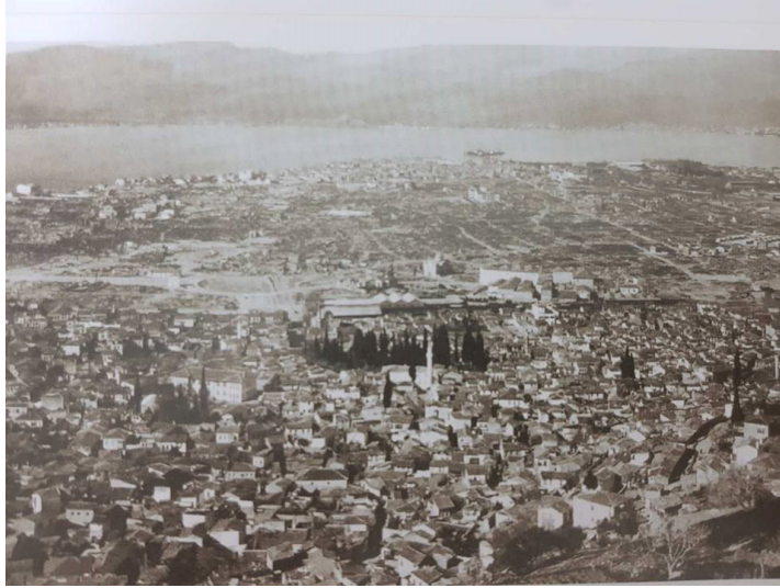
Resim 3: 1922 İzmir Yangını sonrası şehirde oluşan büyük harabe alanı (Serçe ve diğerleri, 2003, 23)

görülmektedir. Zamanla (yaklaşık 20 yıl) enkaz alanının temizlenmesi kentin içindeki boşluğu daha net görülmesini sağlamıştır (Serçe, Yılmaz ve Yetkin, 2003, 15-18).