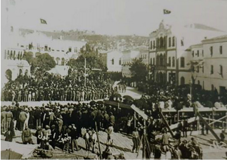
Resim 6: 1932 yılı öncesinde Cumhuriyet Meydanı planlamasının yapılmadığı yıllarda Konak Meydanında 9 Eylül tören kutlamaları (Serçe ve diğerleri, 2003, 142)