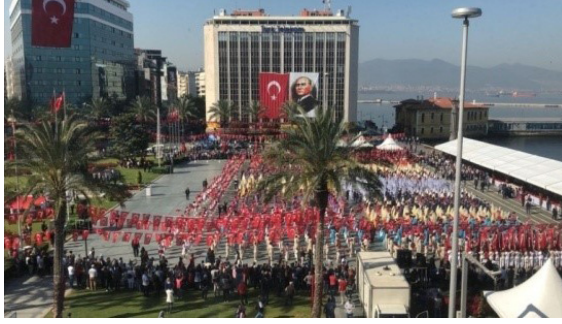
Resim 11: 23 Nisan 2018 Ulusal Egemenlik ve Çocuk Bayramı kutlamaları (Güngördü, 2018,1)