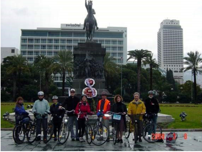
Resim 15: Perşembe Bisikletçileri buluşma noktası ( http://www.turkbike.com/tag/izmir-bisiklet-derneği/ ,2018,1)