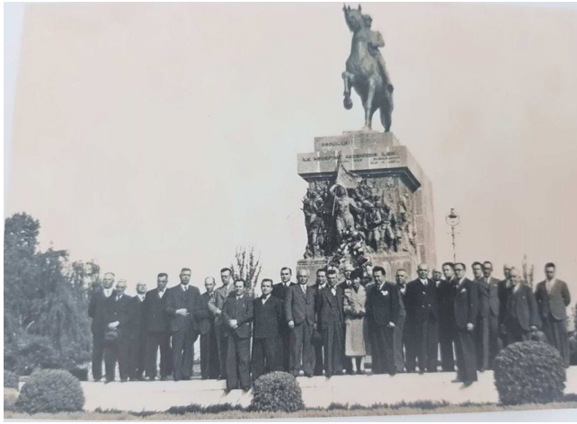
Resim 8: 1932 yılı Cumhuriyet Meydanı ve Atatürk Anıtı açılışı (Serçe ve diğerleri, 2003, 96)

Yangından etkilenen bölge Prost-Danger Planı ile yeniden kurgulanmış ve Cumhuriyet Meydanı kentin denize açılan simgesel kapısı olmuştur. Meydan; yarım daire şeklinde, etrafı kamusal yapılar, belediye sarayları ve üniversite binaları ile tasarlanmış bir odak noktası görevi görmüştür. Ayrıca Meydanda bulunan, P.Canonica'ya yaptırılmış olan Gazi Heykeli de kent için bir diğer simgesel gösteri aracı olmuştur. 1932 yılında Cumhuriyet Meydanı ve Gazi Heykelinin resmi açılışı gerçekleştirilmiştir (Bilsel, 2009, 12-16).