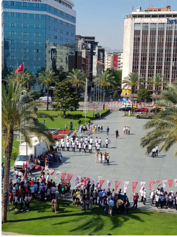
Resim 17: 5 Haziran Dünya Çevre Günü buluşması (Güngördü, 2018, 4)

Özel günler dışında Meydanın günlük kullanımını incelediğimizde ise yoğun bir turist kullanımından söz etmek mümkündür. Her gün, günün farklı saatlerinde Meydandaki Atatürk Heykelinde bireysel ya da grup olarak fotoğraf çektiren turistlere rastlanabilmektedir. Bu durumun haricinde Meydanın kentin deniz ile ulaşımını sağladığı Pasaportun İskele ile yakınlığı, ulaşımdan kaynaklanan kullanım yoğunluğunu da beraberinde getirmektedir. Meydanın bulunduğu Alsancak Bölgesinin çoğunlukla iş merkezlerini barındırması, Meydanın şehrin merkezinde oluşu, özellikle iş giriş-çıkış saatlerinde halkın Cumhuriyet Meydanını kullanmasına neden olmaktadır. Deniz ulaşımının dışında kent içinde toplu taşıma araçlarına bakıldığında Meydanın otobüs ve metro hattına yürüme mesafesi olduğunu ve günlük kullanımda insanların Cumhuriyet Meydanını ana ulaşım noktası olarak kullanıldığı görülmektedir.