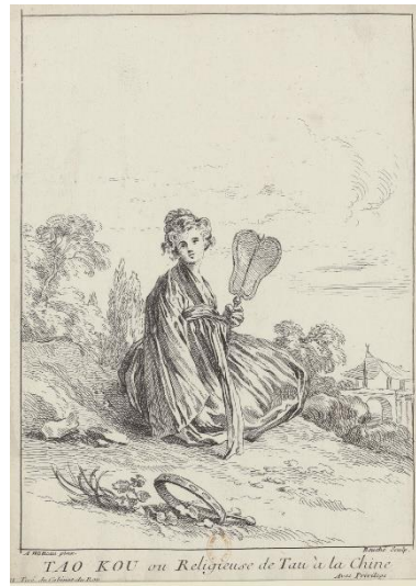
Şekil 5. Tao Kou on Religiuse de Tau, Gravür,1731 The British Museum, Londra

François Boucher`in Chinoiserie etkisinde, farklı temaları içeren gravürleri bulunmaktadır. Bu gravürlerin ortak özelliği figürlerin resmin tam merkezinde kırsal bir alanda ayakta ya da oturarak resmedilmeleridir.