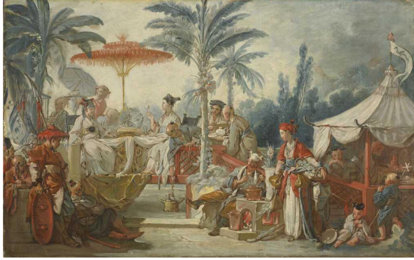
Şekil 10. Festin de l'empereur de Chine, TÜYB, 40x64 cm, 1742, Musee des Beaux, Besançon

Şekil 9'da Boucher'ın resmettiği yaşlı adam figürü kıyafetiyle ve sakallarıyla Çin'e özgü bir figürdür. Elinde bulunan bitki Çin'de fo-şu adı verilen "Buda eli meyvesi"dir. Turunçgile benzeyen bu meyve güzel kokması sebebiyle odalarda saklanan ancak yenmeyen bir bitkidir. Çin'de bu meyve birçok oğul, çok mutluluk ve uzun ömrü simgelemektedir (Eberhard, 2000, s.70).