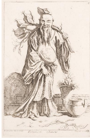
Şekil 9. Recueil de diverses chinoises du Cabinet de Fr. Boucher peintre du Roi, Gravür 1738 -1745, The Metropolitan Museum, New York