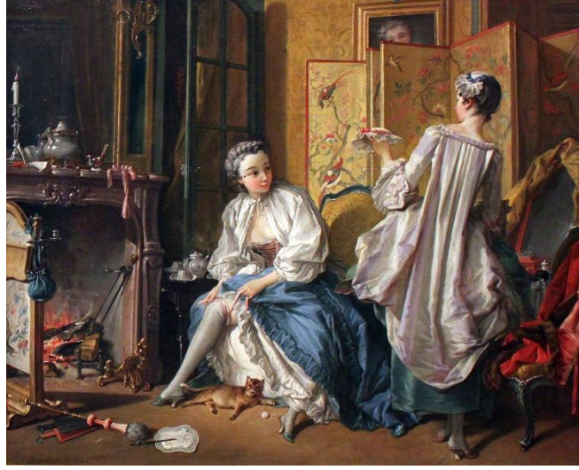
Şekil 4. La Toilette, TÜYB, 52.5x66.5cm, 1742, Thyssen- Bornemisza Koleksiyonu, Madrid

1742`de resmedilen “La Toilette” isimli eser, yatak odasında bayan bir hizmetçi ile jartiyerini bağlayan bir hanımefendiyi göstermektedir. Oda, Uzak Doğu eşyaları ile doldurulmuştur. Hanımefendinin yanında küçük bir masa üzerinde Çin`e özgü çay seti yer almaktadır. Yerde bir yelpaze bulunmaktadır. Oturan hanımefendinin arkasında yer alan paravan, çiçekler ve kuşlardan oluşan bir tasarım ile süslenmiştir. Eberhard`a göre; saksâğan kuşu, bambu ve erik çiçeklerinden oluşan bu motif Çin`de dostluk işaretleri ve mutluluk habercileri olarak tanımlanmaktadır (2000, s.38).