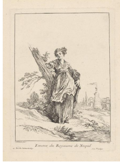
Şekil 6. Femme du Royaume de Nepal, Gravür, 1731, The British Museum, Londra

Boucher'ın eserinde, Şekil 5'te figür kırsal bir alanda toprak bir tepede oturmaktadır. Kadın figür, Çin'e özgü bir kıyafet giymiş ve sol elinde Çin'in sembolü olan kelebek şeklinde bir yelpaze tutmaktadır. Arkasında kabarık ağaçlar ve bir köprü vardır. Ön planda bulunan bazı bitkilerin yakınında, çimlerin üzerinde bir def yer almaktadır. Şekil 6'da figür kırsal bir alanda toprak bir tepede kurumuş bir ağaca yaslanmış ve ayakta durmaktadır. Figür, Çin kültüründe sıkça rastlayabileceğimiz belinden bağlamalı bir kıyafet giymiştir. Arka planda Çin tapınağı Pagoda yer almaktadır.