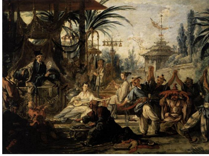
Şekil 11. La Danse Chinoise, TÜYB, 300x570cm, 1742, Musee des Beaux Arts, Besançon

Boucher'ın "La Danse Chinoise" eseri, palmiye ağaçları, yemyeşil bitki örtüsü ve binalar ile çevrili bir alanda dans eden ve şarkı söyleyen bir grup insanı sunmaktadır. Soylu ya da yüksek tabakayı temsil eden bir adam yüksekçe bir düzlemde oturmaktadır. İnsanlar bu adamın önünde dans etmekte ve enstrümanlarını çalmaktadırlar. Şapka takan ve bir sabahlık giyen bu figür, sol elinde yuvarlak bir yelpaze tutmaktadır ve dans eden insanları izlemektedir. Oturan adamın sol tarafında bir kadın üçgen bir zil çalarken, sol tarafında bir kadın Çin'e özgü bir çalgı olan sanxian enstrümanını çalmaktadırlar. Kafası kazıtılmış küçük bir çocuk çubuk şeklinde zilleri çalmaktadır. Resmin sağında dikkatini müziğe vermiş, dans eden, ellerini kaldıran beş kişilik bir grup insan vardır. Bu figürlere bakıldığında saç şekillerinin ve kostümlerinin Çin'e özgü olduğu görülebilir. Bu grubun tam ortasında dans eden adam Çin'e özgü bir şapka takmıştır.