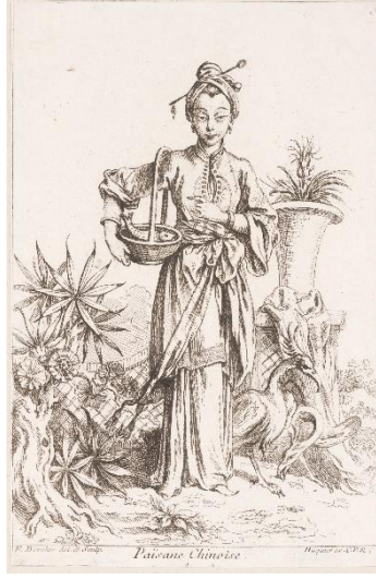
Şekil 8. Recueil de diverses chinoises du Cabinet de Fr. Boucher peintre du Roi, Gravür, 1738 -1745, The Metropolitan Museum, New York