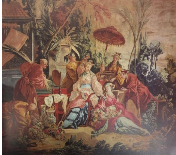
Şekil 2. Chinoiserie örneği Royale de Beauvais İmalatı Halı, Özel Koleksiyon (Jaryy, 1981).

Rokoko dünyasının son derece uçuk ve aydınlık renkli sanatçısı Boucher eserlerinde burjuvazi konuları seçmiş ve sıcak tonlarda çalışmıştır. İpek kumaşlara desenler çizerek dönemin son derece gözde "Chinoiserie"lerinin yaratıcısı olmuştur (Conti, 1978, s.55).