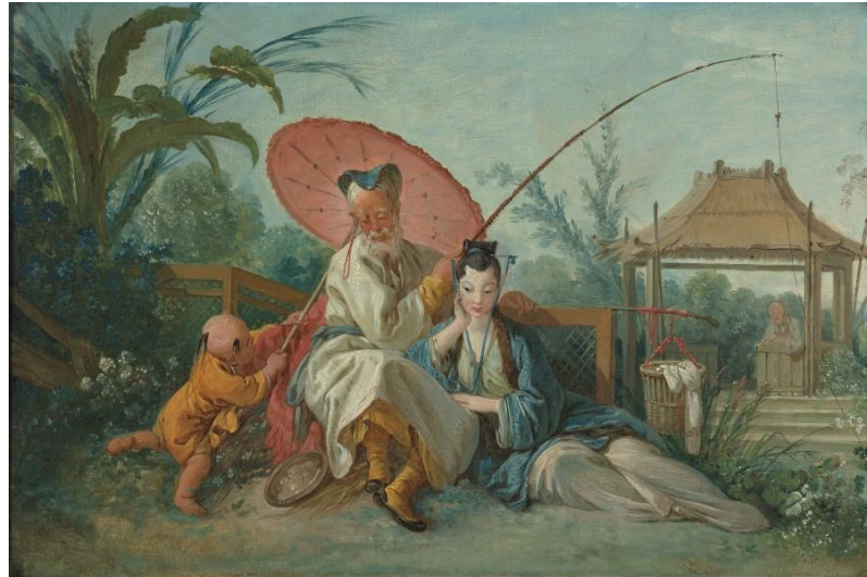
Şekil 12. The Chinese Fishing Party, Halı, 1742.

Boucher'ın "La Danse Chinoise" eseri, palmiye ağaçları, yemyeşil bitki örtüsü ve binalar ile çevrili bir alanda dans eden ve şarkı söyleyen bir grup insanı sunmaktadır. Soylu ya da yüksek tabakayı temsil eden bir adam yüksekçe bir düzlemde oturmaktadır. İnsanlar bu adamın önünde dans etmekte ve enstrümanlarını çalmaktadırlar. Şapka takan ve bir sabahlık giyen bu figür, sol elinde yuvarlak bir yelpaze tutmaktadır ve dans eden insanları izlemektedir. Oturan adamın sol tarafında bir kadın üçgen bir zil çalarken, sol tarafında bir kadın Çin'e özgü bir çalgı olan sanxian enstrümanını çalmaktadırlar. Kafası kazıtılmış küçük bir çocuk çubuk şeklinde zilleri çalmaktadır. Resmin sağında dikkatini müziğe vermiş, dans eden, ellerini kaldıran beş kişilik bir grup insan vardır. Bu figürlere bakıldığında saç şekillerinin ve kostümlerinin Çin'e özgü olduğu görülebilir. Bu grubun tam ortasında dans eden adam Çin'e özgü bir şapka takmıştır.