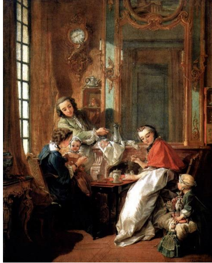
Şekil 3. Le Dejeuner, TÜYB, 81.5x65.5cm, 1739, Louvre Müzesi, Paris

Bu çalışmanın amacı Francois Boucher'in eserlerinde Chinoiserie etkisini incelenmektedir. Bu amaç doğrultusunda Boucher'in Çin'in sanatı ve kültür anlayışından nasıl etkilendiği ve sanat eserlerini nasıl şekillendirdiği araştırılmıştır. Konumuz itibariyle incelediğimiz 10 eserde yer alan Çin sanat ve kültür anlayışı anlatılacak olursa ilk çalışma sanatçının "Le Dejeuner" isimli eseridir.