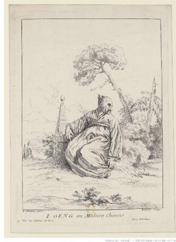
Şekil 7. I Geng ou Medecin Chinois, Gravür, 1731, The British Museum, Londra

Boucher'ın eserinde, Şekil 5'te figür kırsal bir alanda toprak bir tepede oturmaktadır. Kadın figür, Çin'e özgü bir kıyafet giymiş ve sol elinde Çin'in sembolü olan kelebek şeklinde bir yelpaze tutmaktadır. Arkasında kabarık ağaçlar ve bir köprü vardır. Ön planda bulunan bazı bitkilerin yakınında, çimlerin üzerinde bir def yer almaktadır. Şekil 6'da figür kırsal bir alanda toprak bir tepede kurumuş bir ağaca yaslanmış ve ayakta durmaktadır. Figür, Çin kültüründe sıkça rastlayabileceğimiz belinden bağlamalı bir kıyafet giymiştir. Arka planda Çin tapınağı Pagoda yer almaktadır.