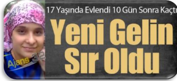
Resim 6. Gazete haberi (“Yeni gelin”, 2013).