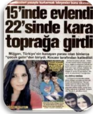
Resim 5. Gazete haberi (“15’inde evlendi”, 2018).

Söz konusu haber metinleri incelendiğinde; yaşanan durumda veya olayda çocuğun kendisi sorumluymuş gibi haberlerin aktarıldığı anlaşılmaktadır (akt. Ova, 2014; Dursun, 2007, s. 124). Ova (2014)’nın da belirttiği gibi bu yaklaşım çocuk gelin olgusunu bir yandan “kişisel” bir olgu olarak algılanmasına sebebiyet vermekte; öte yandan evliliğin çocuğun sorumluluğu altında gerçekleşmiş olduğu izlenimi vermektedir. Bir diğer açıdan haber metinlerinde haberin aktarımı sırasında çocuk hakları ihlali de söz konusu olabilmektedir. Türkiye’de yapılan yayınlarda haber konularında çocukların yeterli düzeyde simgelenemediği ve yalnız kötü bir sonuç ortaya çıktığında kabahatli veya kurban olarak yer aldığı görülmektedir ( Resim 6 ) (akt. Ova, 2014; Duran ve Kubilay, 2010). Burada vurgulanmak istenen, çocuk yaşta evlendirilen kız çocukların şiddete maruz kaldıktan sonra haber metinlerinin konusu olmalarıdır (Ova, 2014). ‘Kocasının evine dönmek zorunda kaldı, ne de olsa kadının yeri kocasının yanındı’ deyişi ev içerisinde yaşanan şiddetin haber metinlerinde meşrulaştırması görülmektedir (Ova, 2014). Bu gibi haberlerin yaygınlaşması ise çocuk yaşta yapılan evlilikler için yeteri kadar bilgi aktarılmadığı gibi topluma meşru bir olay olarak da gösterilebilmektedir.