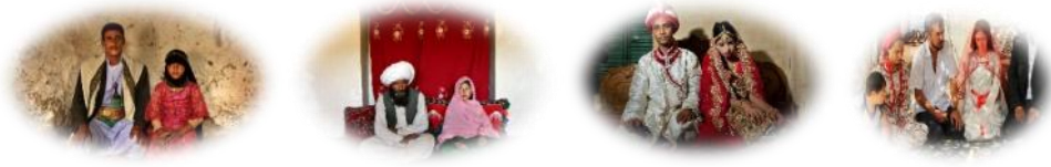
Resim 1. Dünyadan çocuk evlilikler

(“Child brides”, 2016) (“Islamic child”, 2018) (“15’indeki çocuk“, 2015) (“Halam geldi”, 2014)