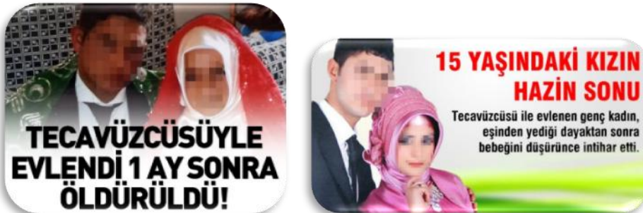
Resim 4. Gazete haberleri (“13 yaşında”, 2015; “15 yaşındaki”, 2012)