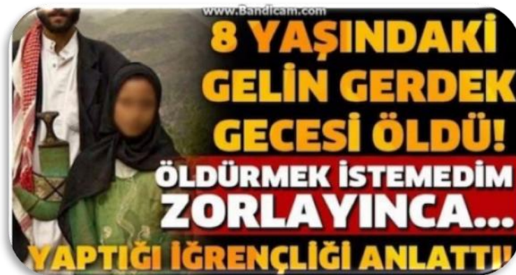
Resim 2. Gazete haberi (“8 yaşındaki”, 2013).

Küçük yaşta evlendirilen çocuklar evlilik aktinin yapılmasıyla birlikte erişkin cinsel yaşamına giriş yapmaktadır. Psikoseksüel gelişimini henüz tamamlamamış kız çocuğunun bedensel ve ruhsal olarak cinsel ilişki kurmaya hazır olmadan cinsel ilişkiye zorlanması ölümcül sonuçlara da sebebiyet verebilmektedir ( Resim 2 ).