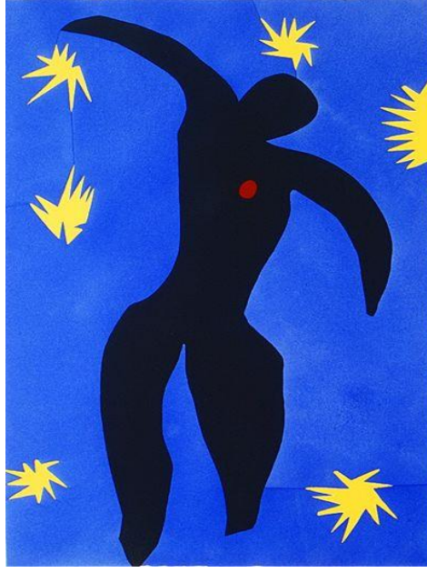
Görsel 4. Henri Matisse, İkarus, Jazz resimli kitabından 8. Plaka, 1947, Pochoir baskı, 41,9 x 64 cm, Metropolitan Müzesi, New York

Dikey dikdörtgen olarak kurgulanmış eserde, mavi zeminin gökyüzünü, sarı kâğıtlardan yıldızlar gibi kesilmiş parçaların güneşi ve ışınlarını, kırmızı rengin İkarus'un genç ve heyecanlı kalbinin tutkusunu ve kendini gerçekleştirmeye karşı hissettiği coşkunu, figürün tamamını kaplayan siyah rengin ise İkarus'un aciz ve kara talihini simgelediği düşünülmektedir. Eserin merkezinde yer alan İkarus, boşlukta düşer pozisyonda resmedilmiştir. Bu düşüş karşısındaki çaresizliği, kötü sonuçla neticeleneceğinden diğer bir deyişle kaçınılmaz ölümü getireceğinden figür tamamen siyah renkle ifade edilmiştir. Ancak bu çaresizlik içerisindeki beden, heyecanlı coşkulu kalbinin canlılığı ise, kırmızı renkle betimlenmiştir. Ölüm anında, o da siyah bedenin içerisinde kırmızılığını yitirip karanlığa karışacaktır. Bu ifade biçimiyle Matisse'in İkarus eseri, o zamana dek yapılmış diğer İkarus örneklerinden daha yalın ve simgesel anlamlar taşımaktadır.