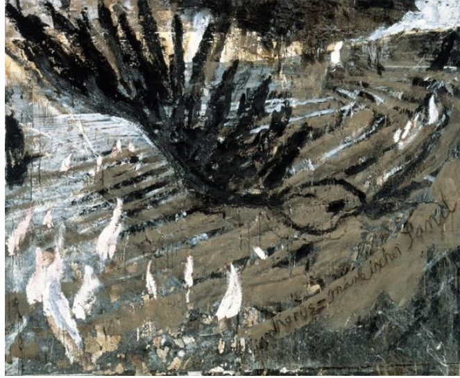
Görsel 5. Anselm Kiefer, Mart'ta Brandenburg Topraklarında İkarus, 1981, Tuval üzerine, yağ, emülsiyon, gomalak, kum ve fotoğraf, 290x360 c

Vincent Van Gogh kardeşi Theo'ya yazdığı mektuplarından birinde babasıyla yazıştığı bir mektuptan bahsetmektedir. “Babam bir keresinde bana; ‘İkarus’un hikâyesini unutma! Güneşe doğru uçmak isterken, çok yükseldi ve kanatlarını kaybedip deniğe düştü’ diye yazmıştı” (Rosenthal; 1987: 17). Van Gogh’un babası da sanatçıyı İkarus’a benzeterek mitolojik bir gönderme yapmaktadır.