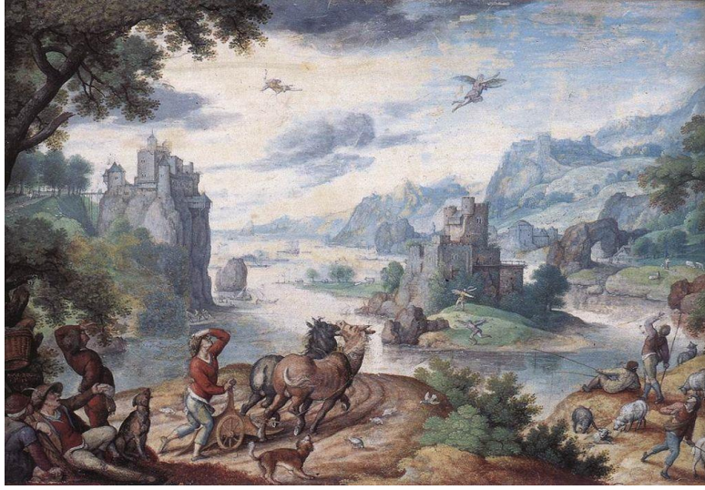
Görsel 3. Hans Bol, İkarus'un Düşüşü ile Manzara, 16.yy'ın 2.yarısı, 13,3 x 20,6 cm, kağıt üzerine suluboya, Mayervan den Bergh Müzesi, Anvers, Hollanda.

Brueghel'in çağdaşı Hans Bol, dönemin popüler konusu olan İkarus'u Brueghel'den farklı şekilde tasvir etmiştir (Görsel 2). Sanatçının eserleri çok küçük boyutlarda olmasına rağmen, içeriğindeki anlatım ve kompozisyon zenginliği bakımından dikkat çekmektedir.