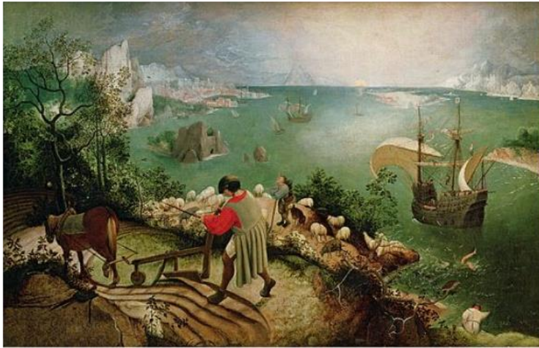
Görsel 2. Pieter Bruegel, İkarus’un Düşüşü ile Manzara, 1558, 73x 112 cm, A.Ü.Y.B, Kraliyet Güzel Sanatlar Müzesi, Belçika.

Döneminin popüler teması haline gelen “İkarus’un Düşüşü” Pieter Bruegel’in de dikkat çeken eserlerinden biridir (Görsel 1). Sanatçının 1558 yılında yaptığı eserinde diğer İkarus konulu eserlerden bariz farklılıklar görülmektedir. Esasen Bruegel’in eseri, dönemin özelliklerini de yansıtan bir manzara resmidir. İkarus’un eserin merkezinde yer almayıp dolaylı bir anlatımla sunulması bakımından diğer İkarus örneklerinden ayrıldığı söylenebilir.