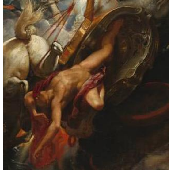
Görsel 3. Peter Paul Rubens, İkarus'un Düşüşü, 1636, Panel üzerine yağlı boya, 27 x 27 cm, Kraliyet Güzel Sanatlar Müzesi, Belçika.