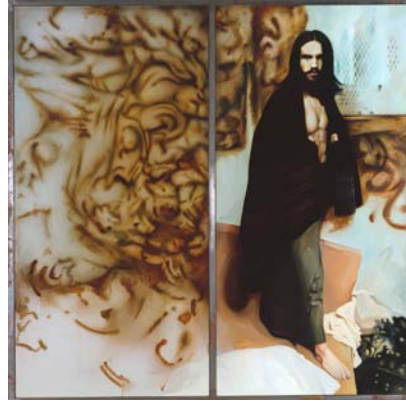
Resim 4: Richard Hamilton, Vatandaş, 1981-83, tuval üzerine yağlıboya, 206,5x210 cm, Tate Koleksiyonu, Londra, İngiltere (Doğanay, 2011).

1980'lerde resimlerini bilgisayar destekli yapmaya başlamış ve özellikle baskı resim alanında çalışmıştır. Hamilton, yaşamında bir süre Kübizm, Fütürizm akımlarına ilgi duymuş ve soyut çalışmalar üretmiştir. Bu soyut çalışmalarında özellikle devinim halinde, renklerle ve ışıkla belirtilmiş motifler, belirli bir ritmi takip etmiştir. Daha sonra sanatçının çalışmalarında ki gerçekçiliği koruyarak tüketim sembollerini ve imajları bir kompozisyon içinde birleştirmiştir (Osterwold, 2007).