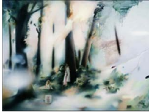
Resim 3: R. Hamilton, “Açık Pembe Peyzaj”, 1971, Tuval Üzerine Yağlıboya, Ludwig Müzesi ( www.tate.org.uk/art/artworks/hamilton-soft-pink-landscape-p07447 ).

1960'lı yıllarda Pop-Art akımı içinde Richard Hamilton da, diğer sanatçılar gibi, kitle kültürünün saptanmasında, kitlenin günlük kullanım alışkanlıklarını eleyerek bir araya getirirken, yine fotoğrafa başvurmuştur. Burada hazır imgeler, fotoğrafın hazır gücüne dayanan bir gereksinim sonucu oluşmuştur. O'nun bu üslubu daha sonra 80'li yıllarda Fotogerçekçi sanatçıların önünü açmıştır (Osterwold, 2007).