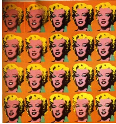
Resim 5: Warhol, "Marilyn Monroe", 1967, serigrafi baskı, her biri 91,5x91,5 cm, Andy Warhol Görsel Sanatlar Vakfı, New York (Buchholz ve diğ., 2012, s. 487).

Amerikalı ressam ve grafik sanatçısı Robert Raushenberg, 1950'lerde Soyut Ekspresyonizm'in köktenci öznelliğine tepki olarak gelişen Pop Art akımının habercisi olmuştur. Yeni sanatsal ifade formları arayışında Alman Dadacılık ile tanışmıştır. Bu akım özellikle kolajları ve topluma olan eleştirel bakışı, sanatçıyı Dada'nın temel fikirlerini sorgulamaya ve soyut sanatın baskın etkisine karşılık olarak Yeni-Dadacı kolajlar yaratmaya itmiştir. Robert Raushenberg, 1960'larda en çok Amerikan metropol yaşamının çok katmanlı bir portresini çıkardığı büyük boyutlu, kolaj benzeri dizileri ile dikkat çekmiştir. Başka şeylerle bir araya getirdiği gündelik olayların dergilerdeki fotoğraflarını aktarmak için serigrafi baskı gibi farklı teknikler kullanmıştır (Buchholz, Bühler, Hille, Kaeppele ve Stotland, 2012, s. 483).