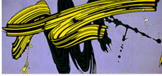
Resim 6: Roy Lichtenstein, “Sarı ve Yeşil Fırça Darbeleri”, 1966, tuval üzerine akrilik, 213,4 x 457,2 cm, Modern Sanat Müzesi, Frankfurt, Almanya (Osterwold, 2007).

Lichtenstein eserlerindeki çıkış noktası ise, fotoğrafçılıkta kullanılan, büyütme tekniğindeki noktalar olmuştur. Lichtenstein eserlerinde fotoğrafçılıkta gren denilen noktacıkların meydana çıkması olayını, mürekkep taşkınlıkları ile oluşan kontörleri, kaba gazete kâğıdı dokusu ve kaydırılmış, eğritilmiş renklendirmeleri kullanmıştır.