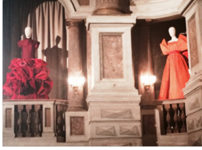
Mantua Bibiena tiyatrosu Roberto Capucci kreasyonları 2 Haziran 2012 Mantua, İtalya (URL 14).