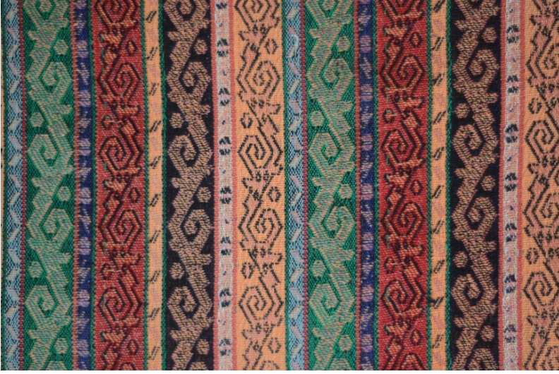
Resim 7. Gürün Şal Örneği, Temur Yalçın.

İkinci kumaş örneğinde kullanılan örgü incelendiğinde, desende 2/1 ve 1/2 dimi, kenar ve kontürlerde ise bezayağı örgü kullanıldığı görülmüştür. Bu şal örneğinde, Resim 8’de görüldüğü gibi kullanılan üç renk atkı ipliği, kumaşın iki yüzünde de örgünün içindedir.