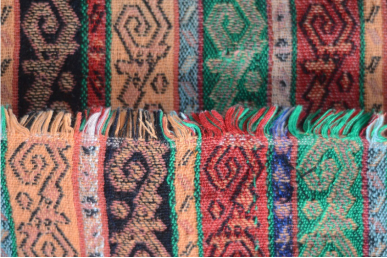
Resim 8. Gürün Şal Örneği, Temur Yalçın.

İkinci kumaş örneğinde kullanılan örgü incelendiğinde, desende 2/1 ve 1/2 dimi, kenar ve kontürlerde ise bezayağı örgü kullanıldığı görülmüştür. Bu şal örneğinde, Resim 8’de görüldüğü gibi kullanılan üç renk atkı ipliği, kumaşın iki yüzünde de örgünün içindedir.