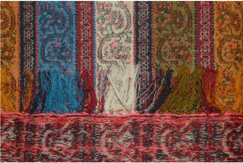
Resim 5. Gürün Şal Örneği, Gürün Belediye Koleksiyonu.

Birinci kumaş örneğinde kullanılan örgü incelendiğinde, desende ve bordürde 2/1 ve 1/2 dimi, kenarda ise bezayağı örgü kullanıldığı tespit edilmiştir. Bu şal örneğinde, Resim 5’de görüldüğü gibi kullanılan atkı iplikleri kumaşın arka yüzünde serbest bırakılmıştır.