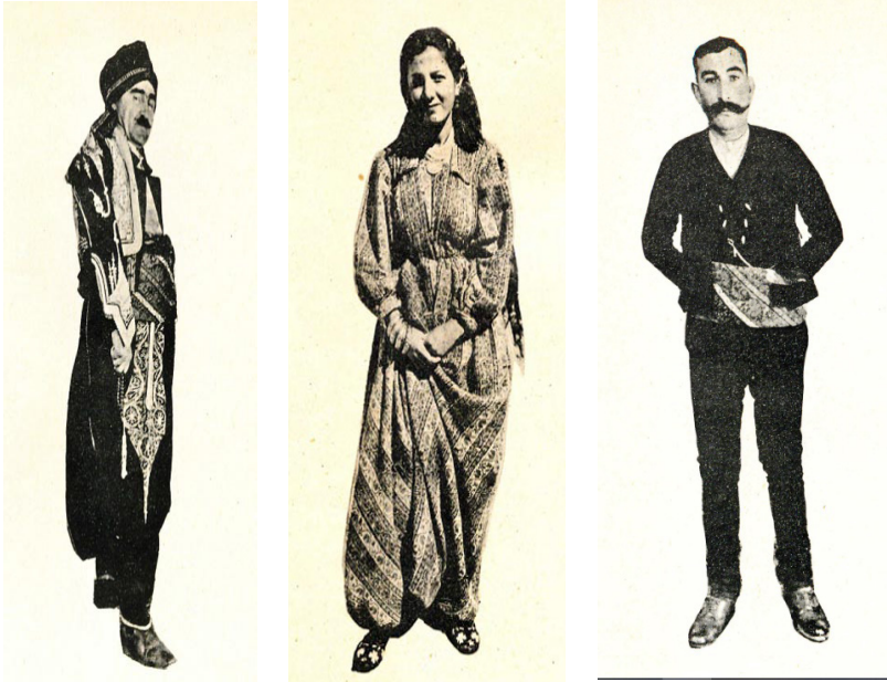
Resim 3. “Gürün Şalları’nın Kullanımına Örnekler” (Özbel, 1949: 28-31-32).

Bunlara ek olarak Akça Tokatlı ve Erzurumlu Jorayev’in (2016: 188) aktardığı gibi; “Giyim dışında minderlerde, kapı perdelerinde, iç mekân döşeme işlerinde, ocak yaşmaklarında, bohçalarda, kavuk örtülerinde, sandık örtülerinde, cenaze merasiminde tabut üzerine örtü olarak ve türbelerde sandıklar üzerine örtü olarak da kullanılmıştır”.