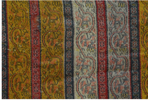
Resim 10. Gürün Şal Örneği, Ön Yüz, Mesude Öztürk.

Üçüncü kumaş örneğinde kullanılan örgü incelendiğinde, desende ve bordürde 2/1 ve 1/2 dimi, kenarda ise bezayağı örgü kullanıldığı görülmüştür. Bu şal örneğinde, Resim 11’de görüldüğü gibi kullanılan atkı iplikleri kumaşın arka yüzünde serbest bırakılmıştır.