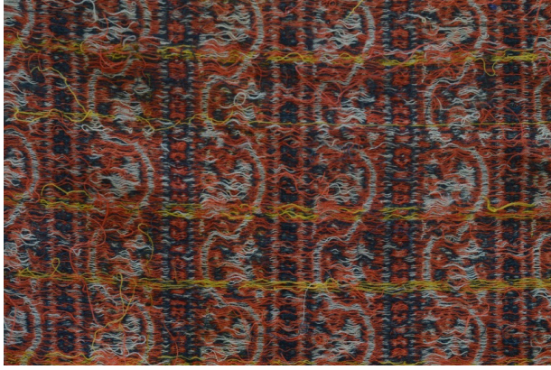
Resim 11. Gürün Şal Örneği, Arka Yüz, Mesude Öztürk.

İncelenen bu Gürün Şal örneğinde, atkı ve çözgü ipliği yündür. Raport eni ölçüldüğünde, hardal, beyaz ve gri renklerin etkili olduğu boyuna kalın yolların eni 4,8 cm, kırmızı ve siyah renklerin hâkim olduğu ince yolların eni 1,8 cm, yollar arasındaki ince bordür eni 0,2 cm genişliğinde dokunduğu tespit edilmiştir. Raport eni toplamda 28 cm'dir. Raport boyu ise 10 cm uzunluğundadır. Zeminde çözgü ipliği rengi, motif ve motif kontüründe de atkı ipliği rengi etkindir. Bir raport, dört kalın ve dört ince yolların, aralarında kontür kullanılarak düzenlenmesi ile oluşturulmuştur.