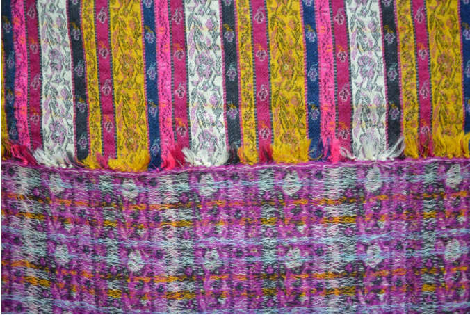
Resim 14. Gürün Şal Örneği, Belkız Turhan.