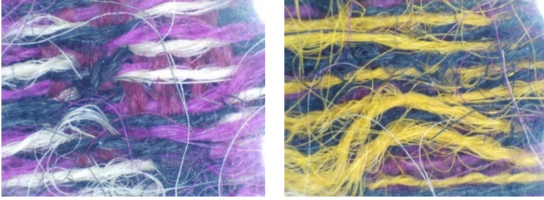
Resim 15. Gürün Şal Örneğinin Mikroskop Görüntüleri.

İncelenen dördüncü Gürün Şal örneğinde, atkı ve çözgü ipliği yündür. Raport eni ölçüldüğünde, beyaz ve sarı renklerin etkili olduğu boyuna kalın yolların eni 3,7 cm, lacivert, pembe, mor, siyah ve sarı renklerin hâkim olduğu ince yolların eni 1,2 cm ile 1,8 cm aralığında, yollar arasındaki ince bordür eni ise 0,2 cm genişliğinde dokunduğu görülmüştür. Raport eni toplamda 17,2 cm'dir. Raport boyu ise 8,2 cm uzunluğundadır. Zeminde çözgü ipliği rengi, motif ve motif kontüründe de atkı ipliği rengi etkindir. Bir raport, iki kalın ve altı ince yolların, aralarında kontür kullanılarak düzenlenmesi ile oluşturulmuştur.