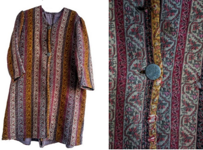
Resim 2. Nevşehirli Ünal Ailesi'ne ait Kaftan.

Çubuklu şal deseni ile dokunan Görün Şalları, kadın giyiminde ve başa direkt sarılarak ya da fes, rakçin, arakçin adı verilen başlıkların üzerine sarılarak kullanılmıştır. Kare biçiminde olan şallar ise uçları püskülle