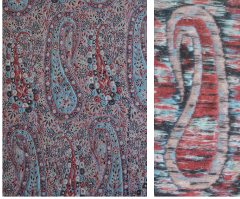
Resim 1. M.Ü.G.S.F. Kütüphanesinde Bulunan, Kenan Özbel Koleksiyonu Görün Şal Örnekleri.

Gürün Şal dokumacılığında kullanılan iplikler; önceleri doğal boyalar ile doğal yöntemlerle boyanırken, sonrasında boyamacılıkta suni ve sentetik boyarmaddeler de kullanılmıştır. Çok renkli dokumalar olan Görün Şal dokumalarında, temel renk beyaz ve siyahtır. Alanda yapılan kumaşlarda kullanılan renkler gözlemlendiğinde siyah ve beyaz iplikler dışında; yeşil, turuncu, kırmızı, mavi, pembe, haki, gri, mor ve bordo renklerde ipliklerin de kullanıldığı görülmüştür.