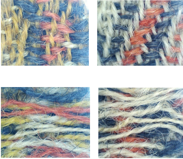
Resim 12. Gürün Şal Örneğinin Mikroskop Görüntüleri.

İncelenen bu Gürün Şal örneğinde, atkı ve çözgü ipliği yündür. Raport eni ölçüldüğünde, hardal, beyaz ve gri renklerin etkili olduğu boyuna kalın yolların eni 4,8 cm, kırmızı ve siyah renklerin hâkim olduğu ince yolların eni 1,8 cm, yollar arasındaki ince bordür eni 0,2 cm genişliğinde dokunduğu tespit edilmiştir. Raport eni toplamda 28 cm'dir. Raport boyu ise 10 cm uzunluğundadır. Zeminde çözgü ipliği rengi, motif ve motif kontüründe de atkı ipliği rengi etkindir. Bir raport, dört kalın ve dört ince yolların, aralarında kontür kullanılarak düzenlenmesi ile oluşturulmuştur.