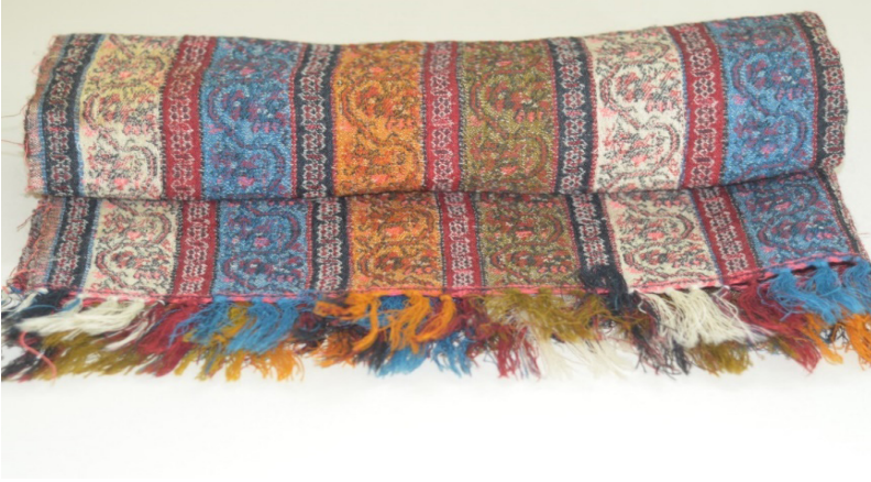
Resim 4. Gürün Şal Örneği, Gürün Belediye Koleksiyonu.

Birinci kumaş örneğinde kullanılan örgü incelendiğinde, desende ve bordürde 2/1 ve 1/2 dimi, kenarda ise bezayağı örgü kullanıldığı tespit edilmiştir. Bu şal örneğinde, Resim 5’de görüldüğü gibi kullanılan atkı iplikleri kumaşın arka yüzünde serbest bırakılmıştır.