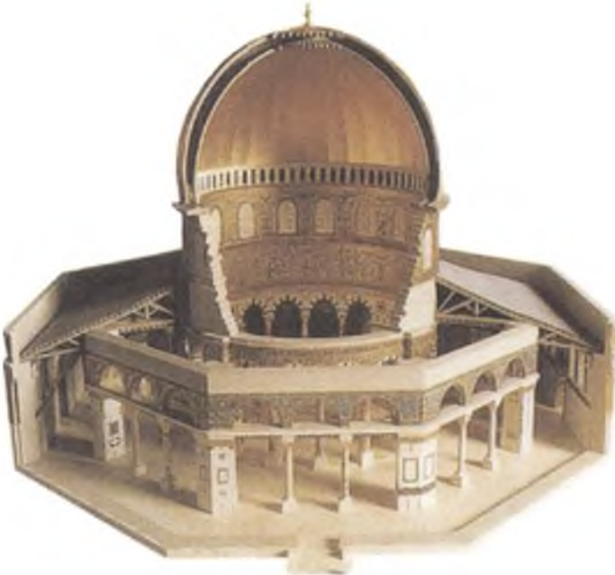
(M. De Vogüe'den) Resim II: Kubbetü's-Sahra'nın Ön Kesit Görüntüsü