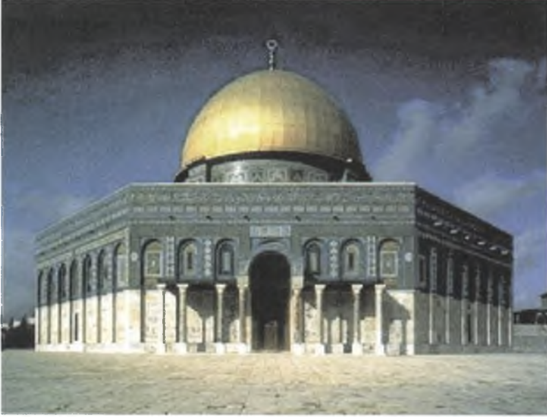
Resim I : Kubbetü's-Sahra'nın Genel Görünüşü