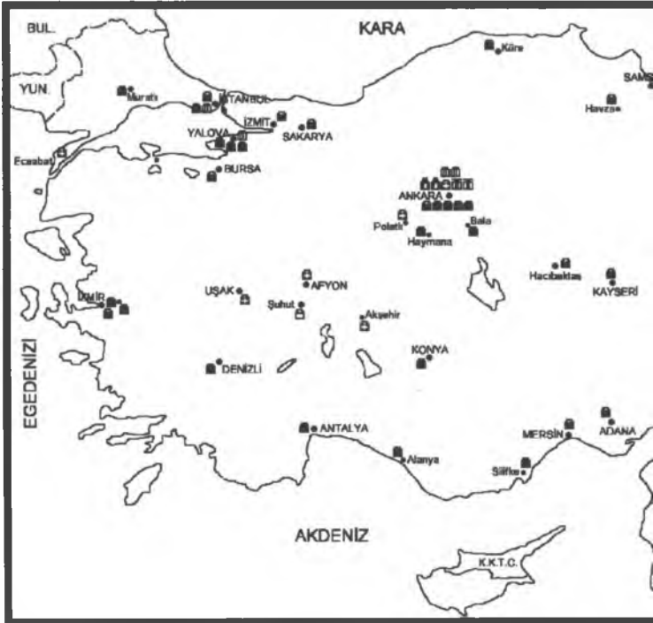
Harita 1. Atatürk'ün Kullandığı Evler