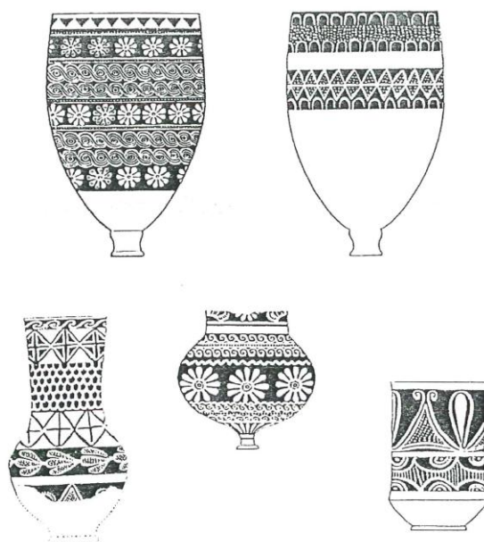
Nuzi Seramiği (Wilhem, 1989)