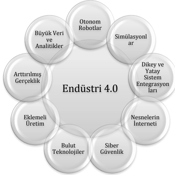
Şekil 1. Endüstri 4.0 Döneminde Ürünlerin Üretiminde Kullanılacak 9 Teknoloji (Boston Consulting Group, 2015)

Diğer taraftan, Endüstri 4.0 fiziksel ve dijital birçok yapının üzerinde yükselmektedir. Fiziksel olarak bakıldığında akıllı fabrikaların kurulması, siber-fiziksel sistemlerin geliştirilmesi, özerk taşıtların piyasaya sürülmesi, ileri robotik uygulamaların kullanımı ve 3D yazıcıların yaygınlaşması önemli itici kuvvetler olarak karşımıza çıkmaktadır. Dijital olarak ise nesnelerin internetinin yaygınlaşması ve dijital para birimlerinin ortaya çıkması bu devrimi daha da sağlamlaştırmaktadır (Schwab, 2016; Lasi vd., 2014).