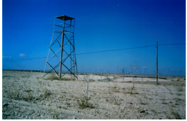
Foto 10. Birecik Şehri doğusunda, plato üzerinde yeni tesis edilen fıstıklıktaki metalden yapılmış bir fıstık hollüğü.