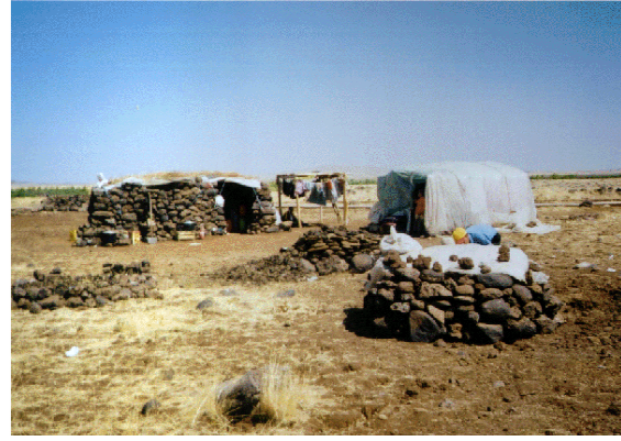
Foto 6. Karacadağ bucak merkezi yakınlarında bazaltlardan yapılmış diğer sebze holligi

Sebze holliklerinden değişik bir tür de Şanlıurfa Şehri'nin güneyinde, Karakoyun deresinin Harran Ovası'na çıktığı yerden başlayarak vadi boyunca sıralanan sebze bahçelerinde görülür. Burası şehrin eskiden beri sebzelikleri durumundadır. Ancak, son yıllarda Şanlıurfa şehrine yakın yerlerdeki sebze alanlarda ahşap dört direk ve pamuk çuvallarıyla iki tarafı kaplanmış hollikler ile sazdan yapılmış “L” şekilli holliklere de rastlanmaktadır (Foto 7-8). Bu tür hollikler sebze bahçelerinin sahipleri tarafından günlük olarak kullanılırlar. Sabah saatlerinde gelen aile bireylerinin iş sırasında dinlenme ve yiyeceklerini saklamaları için yapılan bu hollikler, aynı zamanda toplanan sebzelerin güneşten etkilenmemeleri için bir koruyucu vazifesi de görürler. Bunlar da pamuk holliklerinde olduğu gibi yol ve suya yakın yerlere yapılırlar.