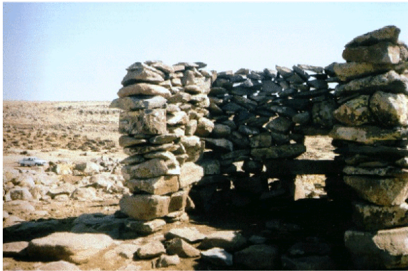
Foto 13. Siverek platosu üzerinde bazaltlardan yapılmış bir çoban hollığı.

Buradaki hollikler daha ziyade köyden 1-2 km uzaklıkta bahar mevsiminde, kuru vadiler içinde, kaynak sularına bağlı olarak derince kazılan ve etrafı bazalt taşlarıyla çevrili olan bir alanda, küçük bir gölet özelliğinde, biriktirilen suyun yakınındaki gölgeliklerdir. Zaman zaman etraflarının geniş çitlerle çevrili olduğu bazı hollikler de davarların sağımı için yapılmaktadır. Suyun kenarındaki düzlükte sağımı ve sulamaya yapılan sürü ögle sığağından fazlaca olumsuz etkilenmemesi için kabaca 2-3 metre uzunluğunda, 80-100 cm yüksekliğinde, kuzeydoğu-güneybatı istikametinde yapılan duvarların kenarında hayvanlar dinlenmeye çekilirler, bu duvarları yöre halkı hollik olarak kabul etmektedir. Bunların fonksiyonuna bakınca Bucak tarafındakilerle aynı amaca hizmet etmektedirler. Fakat üstlerinin örtülü olmaması ve sadece tek bir duvardan oluşmalarıyla da diğer holliklerden şekil bakımından ayrılmaktadırlar. Bunları kullanan köylülerin çoğunluğu bunlara gölgelik demektedir.