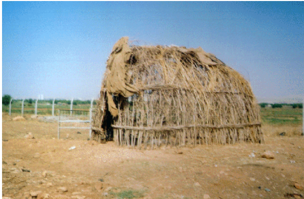
Foto 17. Şanlıurfa Şehri güneyinde dut dallarından yapılmış bir sebze holligi. Bunlara yörede "Hayma" da denilmektedir.

Şanlıurfa şehri atık sularının döküldüğü Karakoyun deresinin ovaya ulaştığı yerden itibaren güneye doğru uzanan düzlük alanda (bu alan geçmişten günümüze kadar şehrin sebze ihtiyacını karşılamaktadır), dut ağaçlarının uzun dalları yan y ana getirilerek 20-30 cm derinliğinde yere gömülmede üst tarafları ise yukarıda birleştirilerek 8-10 metrekare büyüklüğünde kubbemsi bir görüntü sağlanmaktadır. Bu ahşap malzemeden güneş ışınlarının içeriye sızmaması için holligin etrafı pamuk çuvalarıyla kapatılmaktadır. Yapının ahşap duvarları iki kuşak halinde yine dut ağaçlarından seçilmiş uzun dalların yan yana eklenmesiyle sağlamlaştırılmaktadır (Foto 17-18).