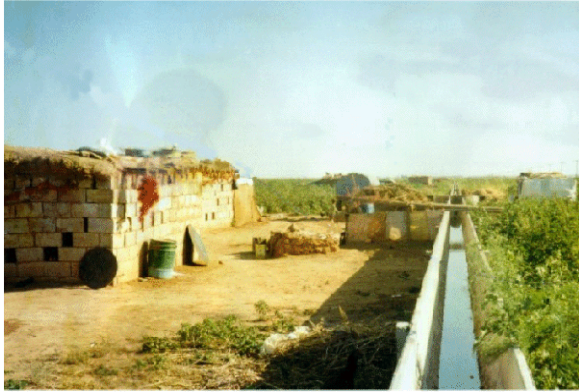
Foto 15. Harran Ovası'nda yapı malzemeleri ve eklentilere örnek bir pamuk holligi.

bir gölgelik yapılmakta, bu haliyle yapı malzemesi ve planıyla bilinen holliklerden farklı bir hollik tipi ortaya çıkmaktadır (Foto 16).