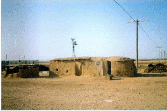
Foto 1. Harran Ovası ve Suruç Ovası'nda kerpiçten yapılan holliklere bir örnek.

oluşturmaktadırlar. Son zamanlarda bu tür holliklerin sayısı atmaktadır. Bunlar çoğalarak sürekli yaşama alanı haline gelince, yanlarına bir veya iki katlı betonarme evler de yapılmaktadır (Foto 3-4).