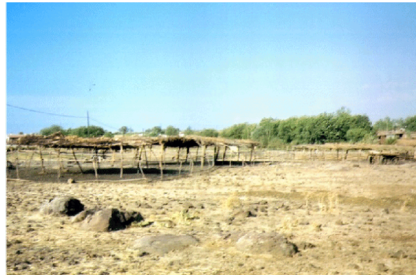
Foto 14. Siverek İlçesi, Bucak nahiyesine bağlı Söğüt mahallesinde hayvan gölgelikleri.