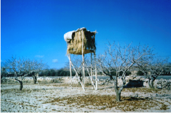
Foto 9. Birecik Şehri doğusunda, plato üzerinde, ahşaptan yapılmış eski bir fıstık hollüğü.

yer tutmadığından o dönemlerde fıstık hollikleri yoktu. Fıstıklıkların yaygınlaşması ve genişlemesine bağlı olarak bakımı ve kontrolü zorlaştığından, aynı zamanda fıstığın ekonomik yönden değer kazanmasından dolayı fıstık hollikleri ortaya çıkmıştır. Ancak bunların yerleşme özelliğine sahip olduğu söylenemez.