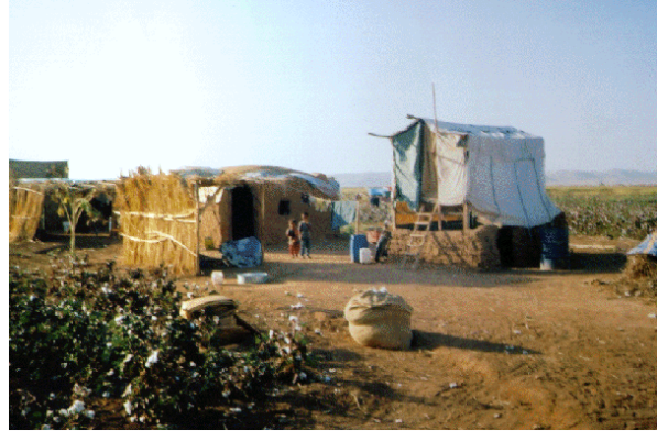
Foto 16. Harran Ovası'nda sazlardan yapılmış bir hollik. Yanında pamuk çuvaları ile örtülmüş taht.

Şanlıurfa şehri atık sularının döküldüğü Karakoyun deresinin ovaya ulaştığı yerden itibaren güneye doğru uzanan düzlük alanda (bu alan geçmişten günümüze kadar şehrin sebze ihtiyacını karşılamaktadır), dut ağaçlarının uzun dalları yan y ana getirilerek 20-30 cm derinliğinde yere gömülmede üst tarafları ise yukarıda birleştirilerek 8-10 metrekare büyüklüğünde kubbemsi bir görüntü sağlanmaktadır. Bu ahşap malzemeden güneş ışınlarının içeriye sızmaması için holligin etrafı pamuk çuvalarıyla kapatılmaktadır. Yapının ahşap duvarları iki kuşak halinde yine dut ağaçlarından seçilmiş uzun dalların yan yana eklenmesiyle sağlamlaştırılmaktadır (Foto 17-18).