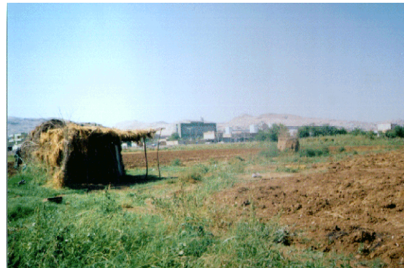
Foto 8. Şanlıurfa Şehri güneyindeki sebzeliklerde sazlar ile kaplanmış bir hollik.