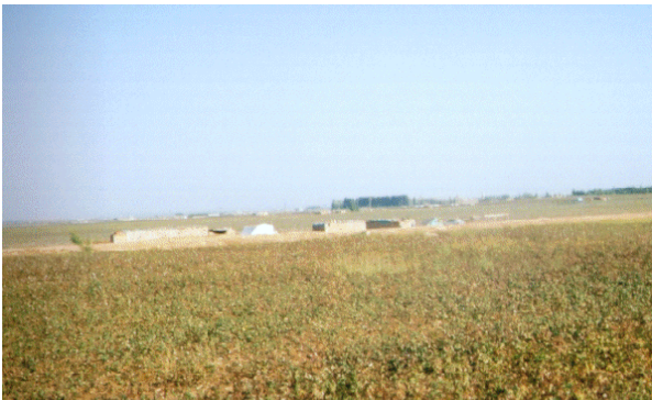
Foto11. Harran Ovası'nda kiracı, yarıcı, ortakçı hollikleri. Bunların çoğu pamuk tarlası kenarındadır.

Meskenin kurulacağı yerin seçimi çok önemlidir. Öncelikle herhangi bir yağış durumunda su altında kalmayacak, sağlığa uygun, sivri sineğin fazla olmayacağı, bunun için rüzgâr esintisini kolayca alabilecek yüksekçe bir yerde mesken kurulur. Kurulan bu mesken zaman içinde ihtiyaç durumuna göre gelişme gösterir. Hollik öncelikle, ailenin gün içinde soğuktan ve sıcaktan korunabileceği, güvenli olarak içinde geceyi geçireceği, gündüz ise yemek yapıp yiyebileceği, dinlenebileceği ve yatakların konulacağı şekilde düzenlenilir. Diğer taraftan aile fertlerinin sayısına göre de büyüklüğü değişebilen bir özelliğe sahip olacak şekilde hollikler yapılır. Çevresinde depo, ambar, tuvalet vb birçok eklentinin yapılacağı kadar da yere ihtiyaç vardır (Foto 11-12).