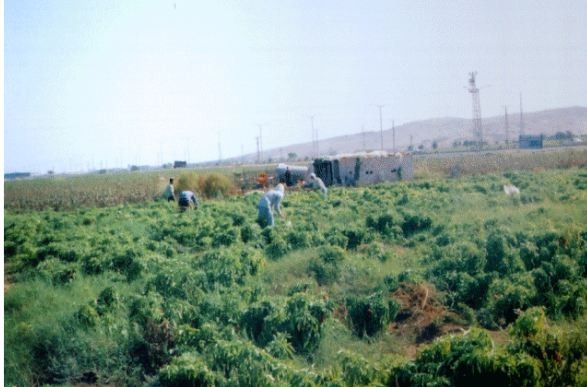
Foto 7. Şanlıurfa Şehri güneyindeki sebzeliklerde pamuk çuvalları ile kaplanmış bir hollik.

Sebze holliklerinden değişik bir tür de Şanlıurfa Şehri'nin güneyinde, Karakoyun deresinin Harran Ovası'na çıktığı yerden başlayarak vadi boyunca sıralanan sebze bahçelerinde görülür. Burası şehrin eskiden beri sebzelikleri durumundadır. Ancak, son yıllarda Şanlıurfa şehrine yakın yerlerdeki sebze alanlarda ahşap dört direk ve pamuk çuvallarıyla iki tarafı kaplanmış hollikler ile sazdan yapılmış “L” şekilli holliklere de rastlanmaktadır (Foto 7-8). Bu tür hollikler sebze bahçelerinin sahipleri tarafından günlük olarak kullanılırlar. Sabah saatlerinde gelen aile bireylerinin iş sırasında dinlenme ve yiyeceklerini saklamaları için yapılan bu hollikler, aynı zamanda toplanan sebzelerin güneşten etkilenmemeleri için bir koruyucu vazifesi de görürler. Bunlar da pamuk holliklerinde olduğu gibi yol ve suya yakın yerlere yapılırlar.