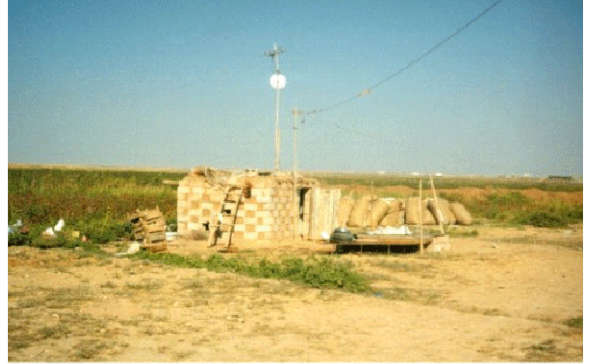
Foto 12. Harran Ovası'nda bir pamuk hollüğü.