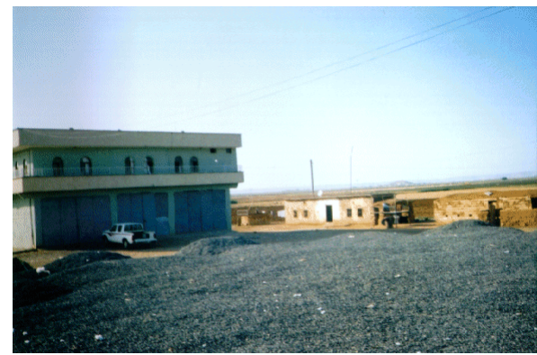
Foto 4. Holliklerin sürekli yerleşme haline geldiği Harran-Akçakale yolunda Aşğibeğdeş köyüne bağlı Göktepe mahallesi.