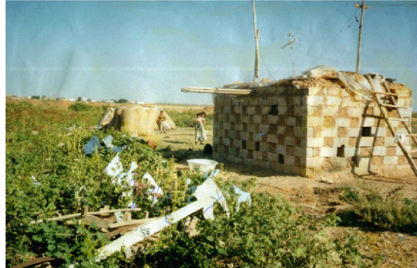
Foto 2. Harran Ovası ve Suruç Ovası'nda briketten yapılan holliklere bir örnek.