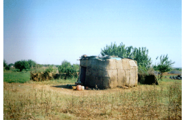
Foto 18. Şanlıurfa Şehri güneyinde pamuk çuvaları ile örtülmüş bir sebze holligi.

Ceylanpınar Ovası ile Viranşehir güneyindeki holliklerin Harran ve Suruç ovalarındakilerden tek farkı, yapı malzemelerinde ortaya çıkmaktadır. Harran Ovası ile Suruç Ovası'ndaki holliklerden eski olanlarında kerpiç ve ahşap direkler kullanılırken yenilerinde briket ve ahşap direk kullanılmıştır. Direkler kavak ağacından elde edilmektedir. Viranşehir güneyi ile Ceylanpınar Ovası'nda yapılan hollikler yeni olup ana malzeme bazalt taşlarıdır. Bütün holliklerde olduğu gibi burdaki hollikler de düz damlı olup dam, kavak ağacından elde edilen direklerin yanyana dizilmesinden sonra üzerine tahta veya saz örtü konulur ve en üste de killi toprak serilir. Son zamanlarda damlar betondan yapılmaktadır.