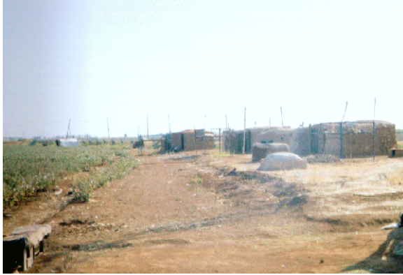
Foto 3. Harran Ovası'nda pamuk hollikleri yan yana yapılarak birçok üniteden oluşan yerleşmeleri meydana getirmişlerdir.