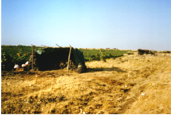
Foto 5. Karacadağ bucak merkezi yakınlarında “L” şekilli duvarlara sahip sebze holligi.

zamanlarda kuzey kısmında oluşan gölgesi sebze tarımını yapanların tek sığınma yeridir. Çünkü bu alanlarda gölge oluşturacak bir ağaç dahi bulunmaz. Burası aynı zamanda araç gereç ve diğer eşyalar ile yiyecek ve içecek suyun konulduğu bir mekandır. Batı tarafta, kuzey güney doğrultulu olan duvar ise öğleden sonraki güneş ışınlarının içeriye girmesine engel olmaktadır. Sabahın ilk saatlerinde ise hollik kullanılmadığından sabah güneşi herhangi bir olumsuzluğa neden olmamaktadır (Foto 5-6).