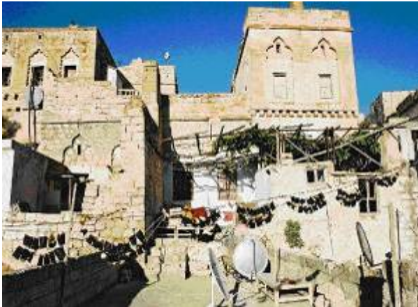
Resim 3. İlçedeki ilk konak olduğu düşünülen

Kuzeydeki tepenin üstünü kuşatan, ancak günümüze ulaşan kısımları kalıntıdan ibaret olan Savur Kalesi’nin sardığı alanın, ilk yerleşim bölgesi olduğu düşünülmektedir. Kentin ileri gelen ailelerinin ifadesine göre, Bağdat’tan gelen ve bu bölgede yerleşik düzene geçen aşiretlerin önde gelenlerinin kalenin hemen altına yaptırdığı konakla, kentin gelişim evresi başlamıştır. Birkaç yıl sonra da, karşı tepede altı yılda tamamlanan ve ilçede önemli bir nüfuzu bulunan ailenin konağı inşa edilmiştir. Dört katlı olan bu konaklar, savunmaya yönelik sırtlarını tepelere dayamaktadır. Kendilerine bağlı aşiret üyeleri de konakların çevresinde güç gösterisi yapacak şekilde evler ve konaklar yaptırmışlardır.