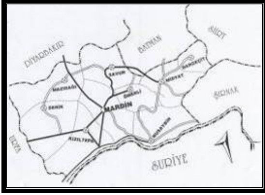
Harita 1. Mardin haritası