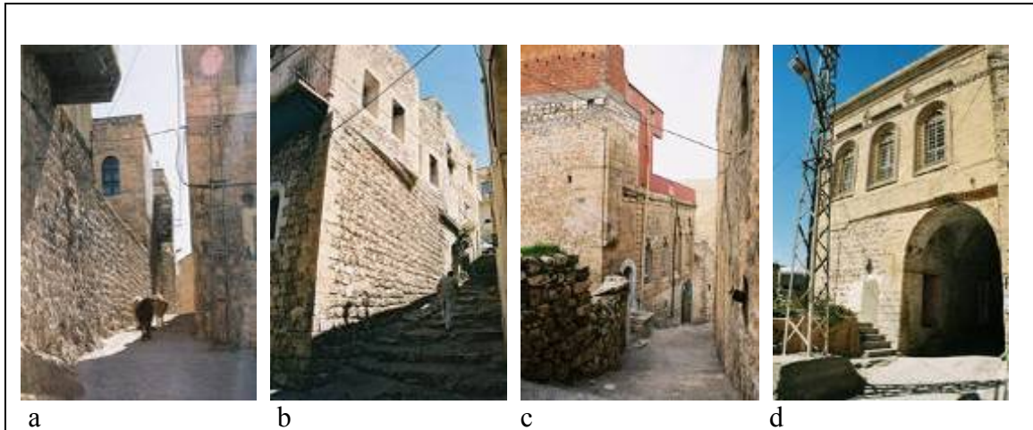
Resim.3. Savur’da sokak örnekleri

Yüksek kalın duvarlarla sınırlandırılan sokakların cepheleri kendisini saran evlerin giriş kapıları, ahır kapıları, giriş sahanlıkları, basamakları ve özentili pencereleri ile hareketlenmektedir. Birçoğu araç giremeyecek boyuttadır. Mardin’de sokak boyutları insan ölçülerinin yanı sıra bölgede kullanılan eşek, at, deve gibi taşıma hayvanlarının ölçüleri de dikkate alınarak, oldukça dar yapılmıştır (Alioğlu, F., 2000). Savur sokaklarının da aynı benzerliği göstermesi, boyutlarının belirlenmesindeki ortak gerekçeleri sergilemesindedir. Geleneksel yaşamın ağır bastığı kentte, at ve eşeklerle taşımacılık günümüzde de devam etmektedir.