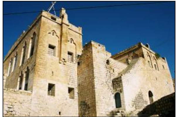
Resim 4. Hacı Abdullah Öztürk Konağı