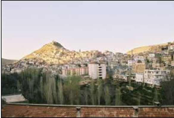
Resim 1-2. Savur'dan genel görünüşler

Savur, bugünkü idari bölünmede Mardin İline bağlı olmakla birlikte, tarihsel süreçte Mardin, Diyarbakır ve Batman ile bağlantılı olmuştur. Yukarı Mezopotamya'yı Yukarı Dicle Havzasına ve dolayısıyla antik çağların ve ortaçağın maden kaynaklarına bağlayan geçit noktalarından biri Savur'dur. Bu nedenle Savur hem antik çağlarda hem de ortaçağda stratejik bir nokta olarak bölge hakimiyetini elinde tutmak isteyenler için ele geçirilmesi gereken bir kale olmuştur. İrili ufaklı tepelerin, Savur ve Şeyhan Çaylarının bir bölümünü suladığı vadi ve yamaçlar, tahıl tarımına elverişli bir eğimle Dicle'ye doğru uzanır. Savur Kalesi, Mardin Ovası'ndan gelerek doğuda Midyat'a, kuzeyde ise Dicle ile Hasankeyf'e ulaşan eski ticaret yolunu kusursuzca denetleyebilme konumuna sahiptir(Ayaz,E., 2003).