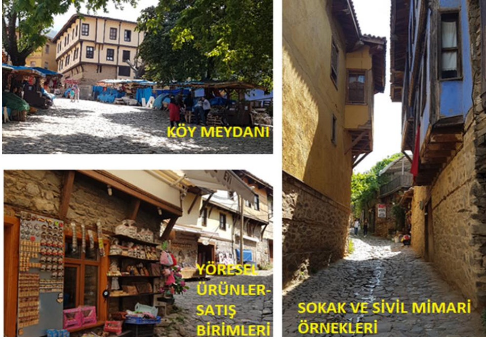
Şekil 3. Cumalıkızık kültürel peyzaj örnekleri

Cumalıkızık kültürel peyzajında yer alan öğeler Şekil 2'de verilmiştir.