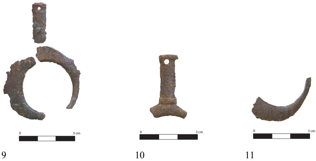
Resim 3. Katalog Numarası 4-11