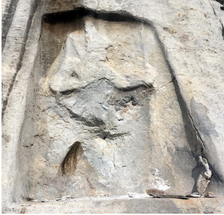
Tahribat Sonrası Durum

toplumun ve devletin ortak görevidir ve bu konuda tüm taraflar üzerine düşeni yerine getirmelidir.