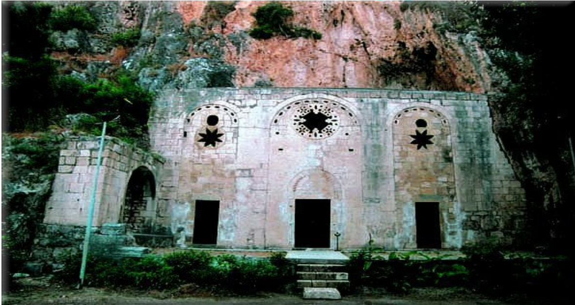
St. Piyer Kilisesi (Bugünkü durumu)

69 yılında Vitellus'u yenerek Roma'ya girdi. Daha sonra Roma'dan Kudüs'e doğru hareket etti. Titus, M.S.70 yılında Kudüs'ü işgal ederek buradaki Yahudilerin çoğunu öldürdü. Bu olaydan sonra Antakya halkı Yahudileri şehirden kovacaklarını söyleyerek Titus'u Antakya şehrine davet ettiler. Bu davet üzerine Titus kısa bir süre için Antakya şehrine geldi. 23 M.S. 75 yılında Efudyos'un katlinden sonra İgnatus Nurani, Antakya'da kuvvetli bir misyoner teşkilatı kurdu. Önce Antakya kilisesi içindeki Yahudi asıllı Hıristiyanlar ile Putperest asıllı Hıristiyanlar arasındaki ihtilafı gidermiş, sonra da özellikle Anadolu'daki kiliselere gönderdiği mektuplarla parçalanmaları önlemiştir. İgnatus Nurani'nin bu misyon faaliyetleri müminlerin sayılarının artmasına ve kilisenin güçlenmesine sebep oldu. İgnatus'un bu çalışmaları kısa bir zaman sonra imparatorluk içinde huzursuzluk yarattı ve şikayetler imparator'a kadar ulaştı. Bunun üzerine İmparator Trajan çıktığı Doğu seferi sırasında Antakya'ya uğrayarak kırk yıla yakın bir zamandır episkoposluk yapan İgnatius'u zincire vurdurarak Roma'ya gönderdi. 24