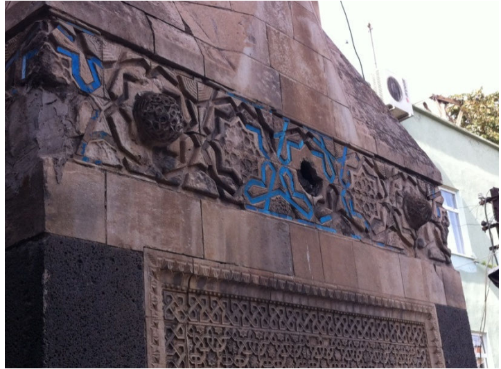
Resim 10. Çinili kaideden detay