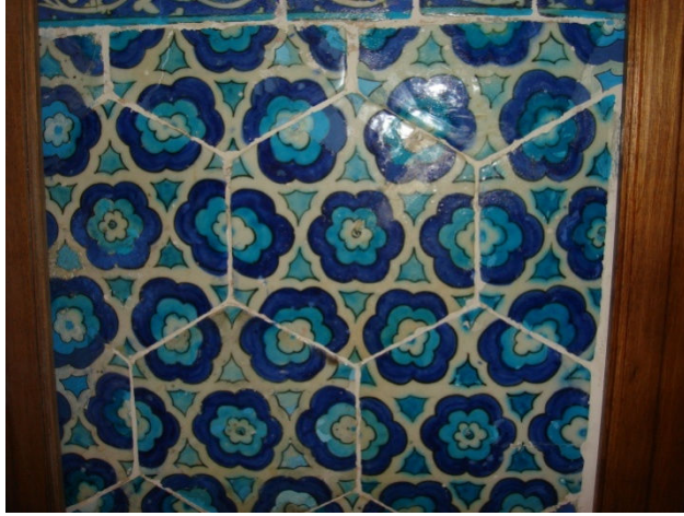
Resim 3. Mahfel kapısının yanındaki altıgen çiniler