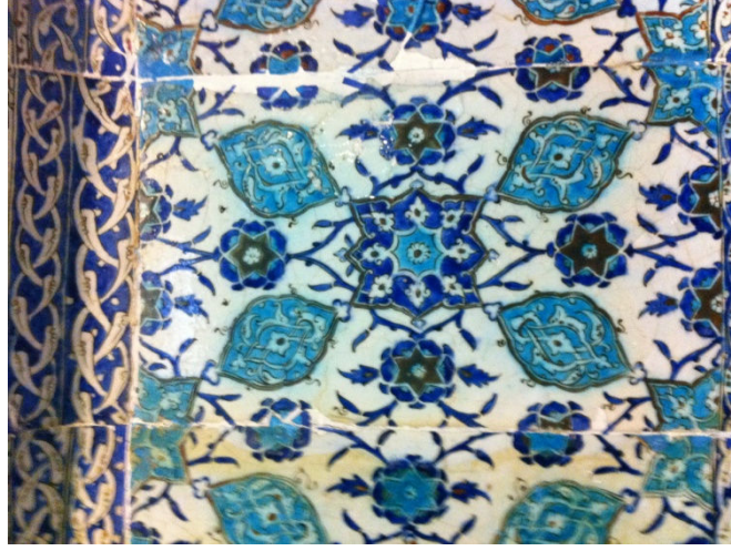
Resim 11. Mihrap çinisindeki palmet ve rumi geçişli bitkisel bir tasarım

kollarında devirli bir sıra ile şemse ve altı kollu yıldızlar yer almaktadır. Şemselerin içleri bitkisel dolguludur. Ayrıca palmet ve rumi geçişli bitkisel bir tasarım görülmektedir (Yıldırım, 2008; 601) (Resim 11).