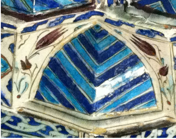
Resim 5. Mihrap köşe çinisi

mukarnaslar ise mavi, lacivert renkte ve çoğu çizgili, pek azı da çiçek motiflidir. Sümbül ve gül goncaları görülmektedir. Mukarnas aralarında saç örgüsü bezekler de yer almaktadır.