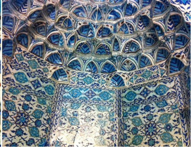
Resim 6. Mukarnas çinileri

Mihrap çinileri gonca gül ve geometrik bezemelerle tasarlanmıştır. Yaklaşık her yatay çini sırasında gül goncalarını görmek mümkündür (Resim 5). Bazı mukarnasların her iki köşesinde aynı kökten çıkmış iki adet kahve ile bordo rengi arası gonca gül görülmektedir. Goncalara ve yapraklı dallarına ise hareket verilmiştir. Goncaların yaprakları ve dalları bazen koyu yeşil kontur ile çizilmiştir. Bazen de gül yaprakları mavi ve goncanın dip kısımları hem mavi, hem kırmızı renkle sırlanmıştır. İkili gül goncalarının üstte yer alanı daha büyük, altta yer alanı daha küçük çizilmiştir. Her ikili gonca gülün bir tanesi sağa, bir tanesi sola bakmaktadır.