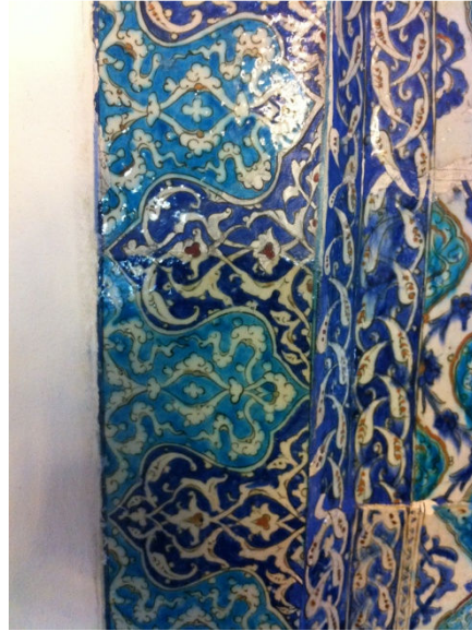
Resim 8. Mihrap bordür çinileri

Dokuzuncu sırada sekiz adet ikişer bordo gonca güllü çini yer almaktadır.