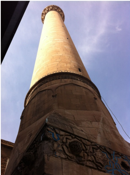
Resim 9. Çini kaideli minare

Melek Ahmet Paşa cami minaresinin köşeli kaidesinin üst kısmındaki kabartmalı taş süslemelerin iç kısımları çini ile kaplıdır. Firuze sırlı ince çini parçalar taş süslemenin arasında yer alarak, kaidenin dört tarafını dolaşmaktadır. Günümüzde çini kısımların çoğunun çeşitli nedenlerle yok olduğu gözlenmektedir. Bu cami Diyarbakır'da minaresinde çini süslemesi olan ikinci camidir (Resim 9, 10).