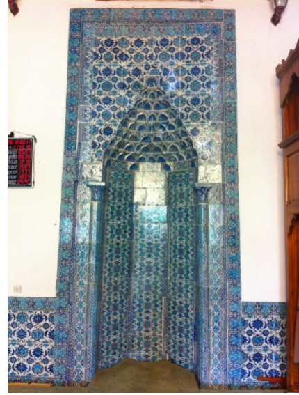
Resim 4. Mihrap çinileri

Cami süslemesinde yer alan motifler ise gül goncaları ve çiçek kesitlerinden oluşmuştur. Duvar çini süslemeleriyle, mihrabın üst kısmında yer alan motifler aynıdır. Bordürlerde görülen çini süsleme ise kenar duvarlarda yer almaktadır.