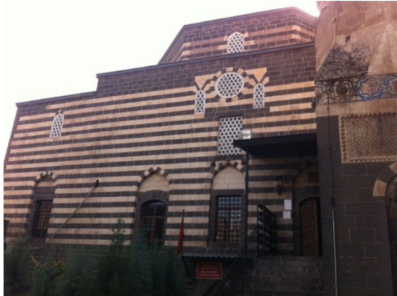
Resim 1. Melek Ahmet Paşa Camii

Melek Ahmet Paşa camii, içerisine depo, dükkan gibi mekanlar yapmak için yükseltilmiş ve iki katlı bir yapıya çevrilmiş tarihi bir eserdir. Caminin kuzey ve güney cepheleri siyah, beyaz taştan, kalan kısımlar siyah bazalt taştan yapılmıştır. Cami estetik çini bezemeleri, çinilerle ve taş işlemleri ile bezenmiş minare kaidesi ve merkezi plan özelliği taşımasıyla, bir Osmanlı mimarisi olarak önem arz etmektedir (Resim 1). 94