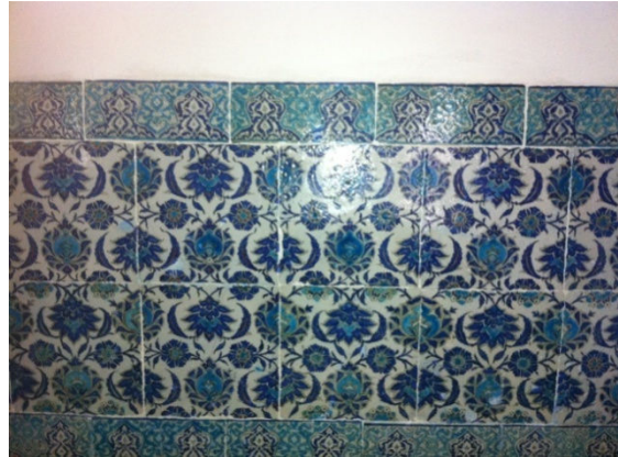
Resim 2. Harim duvarı çinileri