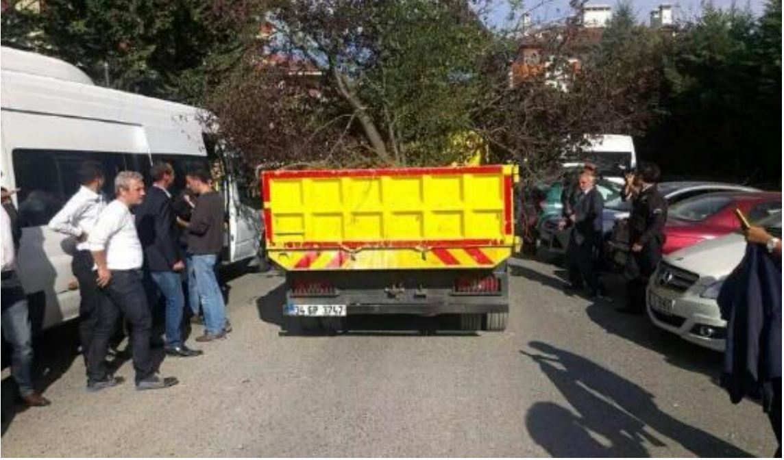
Ağaçlar alandan sökülüp götürülürken.