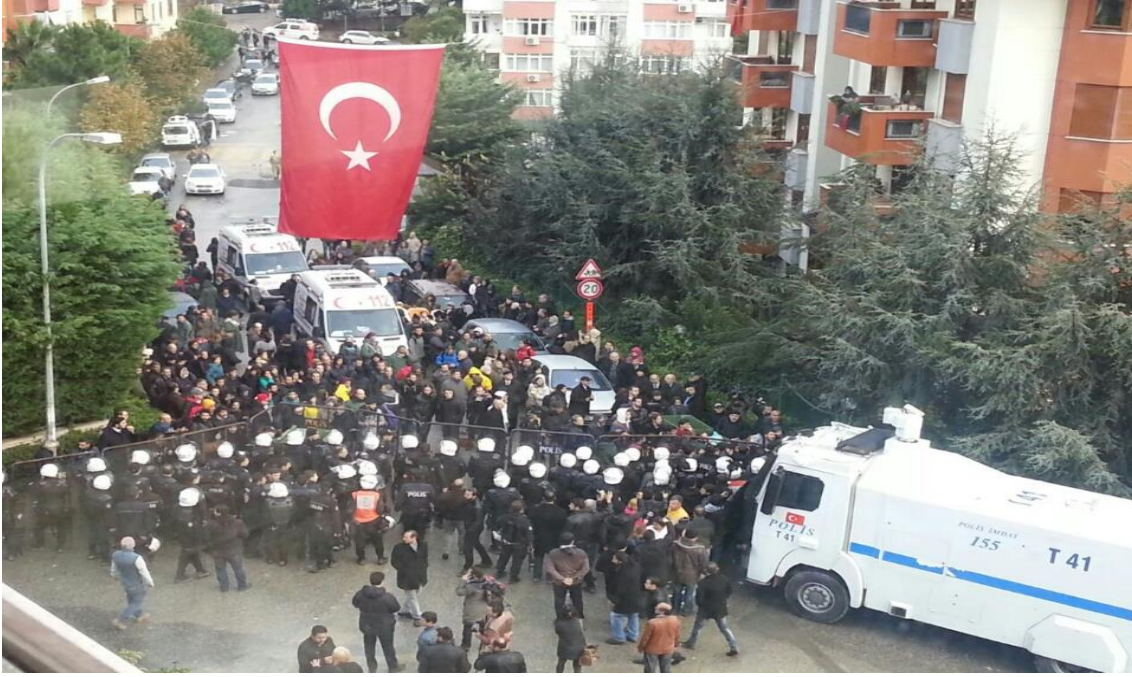
Direnış alanı: Prostestocular ve polisler.