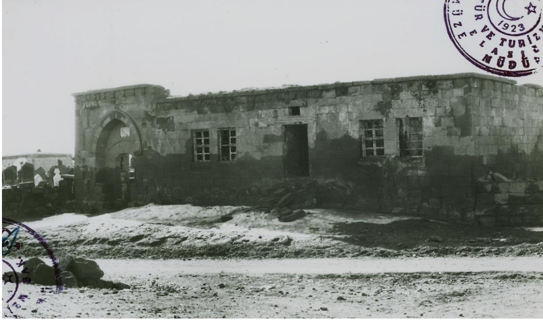
Tarihi Mollakent/Mellekend Medresesi ve Hazire Giriş Burcu

Şark medreselerinin toplum üzerindeki etkileri oldukça kuvvetlidir. Medrese-toplum ilişkisi bireyin doğumuyla başlamakta olup medreseler evlilik, ölüm, hukuki meseleler ve daha birçok alanda topluma rehberlik etmiştir. Medrese muhitinde bir çocuk doğduğunda çoğunlukla seydalar ona isim verip kulağında ezan okurlar. Kavga, anlaşmazlık veya herhangi hukuki bir davada yine seydalara başvurulur. Yerel tabirle şeri'ata gidilir. 19 Evlenen çiftlerin nikâhını seydalar kıyar. Cin çarpması veya herhangi psikolojik bir vakada yine seydalara müracaat edilir. Halen yerel halkın hafızasında devletin memuru olarak gördükleri imamlara karşı yaklaşımı mesafelidir. Buna mukabil onların yerine medrese âlimlerinin talep edilmesinin sebebi büyük ihtimalle resmi imamların sosyal sorunların çözümünde çoğunlukla yetersiz kalmaları veya gönülsüz davranmalarıdır. Çünkü halk yüzyıllardır medrese geleneği ile yaşamış ve medreseyi oldukça benimsemiştir. Buna mukabil gelen resmi imamlar toplumun sinir uçlarına dokunamamışlardır. Bu durumun başlıca sebepleri, gelen imamların dil ve kültür farkı, eğitim seviyelerinin yetersizliği, toplumu yeterince tanıyamamış olmaları ve devletin resmi ideolojisinin bekçileri olarak telakki şeklinde sırlanabilir.