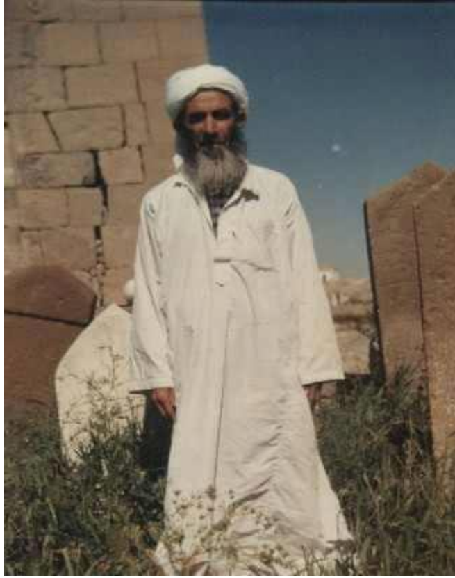
Seyyid Şeyh İhsan-ı Mellekendî

Seyyid Şeyh İhsan'ın medrese eğitiminde ikinci safha Mollakent Medresesi'nden ayrılması ile başladı. Şark medreselerinde genellikle talebelerin farklı medreselerde bir veya birden fazla eseri okuması bir gelenektir. Bu geleneğin sürdürülmesindeki en önemli neden ise medrese talebesinin yetişme sürecinde farklı medreselerde bulunması hem çağının âlimlerini, ekollerini ve diğer talebelerini tanınması hem de gittiği yerlerin mikro kültürel ve toplumsal yapılarını yakından müşahade etmesi onun ilim, irfan ve tecrübesine önemli katkılar yaptığına dair düşüncelerdi. Bu sebeple Seyyid Şeyh İhsan, babası Seyyid Abdullah-ı Mellekendî'nin de tavsiyesiyle Muş'un Kopo köyünde bulunan ve Şeyh Fethullah-ı Verkanisi'nin de oğlu olan Şeyh Kutbettin'in medresesinde ilim hayatına bir yıla yakın devam eder. Burada Seydası Şeyh Kutbettin'den Sadedini Taftâzânî'nin eseri olan ve talebeler arasında Sa'dini olarak bilinen Şerhu's-Sa'd ve Hallu'l Maâkid Şerhu'l-Kavâid kitaplarını okudu. 60 Kopo'daki kitaplarını tamamladıktan sonra Şeyh Kutbettin'in tavsiyesi üzerine Ahlat'a bağlı Pirus köyünde Melle Sıddık-i Subaşı'nın medresesine gitti. Burada İbn-i Akıl ve Suyuti'nin eserlerini derinlemesine tamamladı. Molla Cami adlı eseri ise yörenin büyük âlimlerinden birisi olan Melle Zahir-i Tendüreki'den aldı. Ayrıca bölge medreselerinde çok az bilinen Farsçayı da yine Melle Zahir'den iyi düzeyde öğrendi. 61