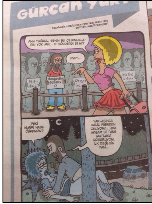
Şekil 3. Tecavüze ve temsile ilişkin bir karikatür 13