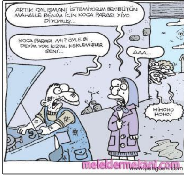
Şekil 5. Araç tamircisine ilişkin tiplene 19

Dolayısıyla karikatürler ötekini inşa etmekte ve onun parçası olan köylüyü alt kültür olarak sunmaktadırlar. Bu yolla kentsel orta sınıf normatif olarak doğrulanmakta ve arzu edilerek arzunun nesnesi haline gelmektedir (Williamson, 1995: 19'dan aktaran Banks vd., 1993). Bir başka deyişle tecavüz içerikli karikatürlerde alt sınıf üst sınıfa tecavüz etmektedir. Esmer ya da siyah erkek beyaz kadına tecavüz ettirilmektedir. Bir taraf şehirli, zengin, orta sınıf diğer taraf öteki, göçmen ve köylüdür. Bir yandan bir taraf yokluğu ifade ederken diğer taraf varlığı ifade etmektedir. Yokluğu temsil eden kişi, yokluğunun sebebi olarak varlıklığı görür ve ondaki ona ait olanı almak için ona saldırır. Hiç bir zaman bir araya gelemeyecek veya gelmek istediklerinde bir yığın engellerle karşılaşılması zorla ele geçirmeyi üretmiştir. Bu durumda aslında onun bedenine saldırarak bir yaşam tarzından veya kendini sömürdüğünü düşündüğü şeyden intikamını almaktadır. Böylece cinsellik bir iktidar aracı olarak simgeleşmektedir (Donnan ve Wilson, 2002: 251-256).