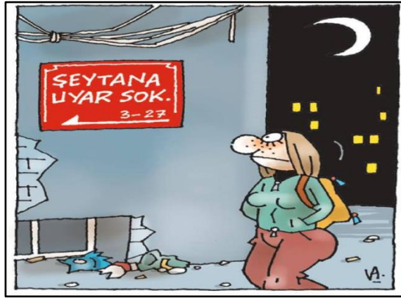
Şekil 1. Karikatürlerde Kullanılan Mekân 7

Karikatürlerde tecavüzün mekânlarına dikkatle bakmak, bazı toplumsal okumalara imkân vermektedir. Aşağıdaki karikatürde (Şekil 1) sokak kırmızı fon üzerinde ‘Şeytana Uyar Sokak’ 6 olarak adlandırılmıştır. Aslında Türkiye’de Sokak tabelaları çoğunlukla mavidir. Ancak buradaki kırmızı renktir. Kırmızı renk tehlikeyi, alarm durumunu, merakı, arzuyu ve pornografiyi temsil etmektedir. Bu mekândaki uyarıcılar eşliğinde tecavüz eylemini gerçekleştiren fail ‘şeytana uymuş’ oluyorsa, aslında eylemin sorumluluğunu yansıtarak kendinden uzaklaştırmaktadır. Ayrıca karikatürdeki binanın duvarlarının sıvası dökülmüştür. Çöpler sokağa gelişi güzel bırakılmıştır. Bu karikatürde çöplerin yerde olması ve bakımsızlık kamu hizmetinin uğramadığı ve alt yapı hizmetlerinin iyi olmadığına işaret etmektedir. Bu haliyle karikatürdeki bu tasvir yoksul bir mahalleye işaret etmektedir. Tersinden bir okuma yapıldığında, kamu hizmetlerinin düzenli yapıldığı ve bakımlı durumdaki mekânlarda tecavüz ihtimalinin azaldığı veyahut olmadığı çıkarımı da yapılabilir. Karikatürdeki kurgudan yola çıkarak, yoksul olmak ile tecavüzcü olmak arasında görsel bir korelasyon kurulduğu görülmektedir. Yoksul olmak ile suçlu olmak ilişkilendirilerek mekân ötekileştirilmektedir.