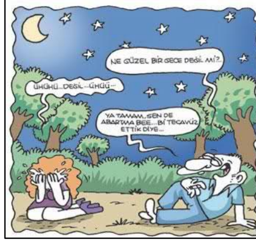
Şekil 2. Tecavüz zamanına ilişkin örnek 9

‘ötekiler’ o etiketlemeye maruz kalmaktadır. Bu bakışa göre gece dışarı çıkan bir kadın olası bütün ihtimalleri göze almış demektir.