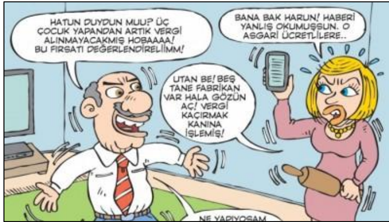
Şekil 6. Ekonomik sınıfı ifade eden karikatür 20