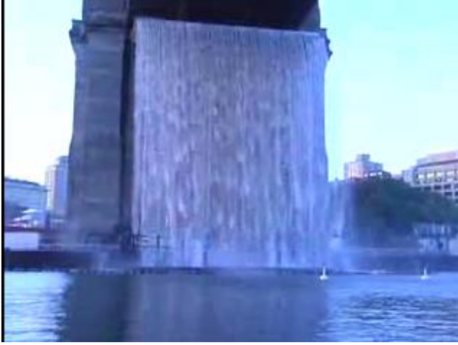
Resim: 7 Olafur Eliasson, "Doğu Nehri üzerinde şelaleler"

sanatın evrimi temsil eder. Yerleştirmeler medya (ses, ışık, koku) nesnelere, belirli bir ortamda kurulmuş tüm ifade biçimleriyle oluşur. Bunlardan birisi, New York'ta Danimarkalı sanatçı Olafur Eliasson tarafından üretilen yapay şelaledir. Pompalanan Su Doğu Nehri'ne 30 ve 40 metre yükseklikten geri düşer. Balık ve diğer su canlılarının zarar görmesi su filtrasyon ile engellenmiştir. Panelleri güneş ve su gücü ile çalışırken ve tüm canlıların çıkarları korunmaktadır. Çevre bilincini arttırmak için tasarlanmıştır.