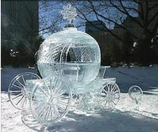
Resim 6: Leggievai Külkedisi buz arabası

Bu yapıların yapımında suyun görkemli ve büyümlü görünümü için çok büyük teknik bilinç ve sanatsal duyarlılık gösterilmiştir. Endülüs'ün kavurucu yaz sıcaklığından bir koruma olarak oluşturulan harika serin bir ortamda, kemerler ve tonozlu tavan ve içeri süzölen güneş ışığı ile mükemmel kristal saflığında suların olduğu zarif banyolar, dünyanın doğal su mağaralarını andırır. Angkor'daki Kamboçya Khmer mimarları görkemli taş tapınaklarında heybetli duran, suların sessiz muhafızları gibi heykeller inşa ettiler. Ayrıca hidrolik mühendislikleri ile eserlerinde şaşırtıcı derecede iyi etkiler uyandırdılar. Caserta Kraliyet Sarayı ve Veneto Palladian villası, Roma, Boboli Bahçeleri, zafer çeşmesi gibi çeşmeler; özellikle on altıncı ve on sekizinci yüzyıllar arasında inşa edilen çok sayıda İtalyan taş yapıları, unutulmazdır. Özel efektlerle aydınlatılmış kemerler, sütunlar, labirentler, hamamlar ve heykel çeşmeler aracılığıyla su hareketli olarak yapıları süslemiştir.