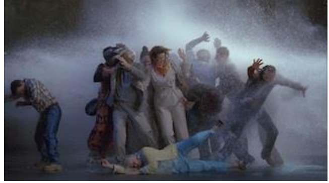
Resim 9: Bill Viola "Sal" 05'39"2004

"Yansıtan Havuz", 1977 ve 1979 arasında oluşturulmuş, Viola'nın erken video çalışmalarından biridir. Videoda havuzun kenarında bir süre bekleyen figürün atlaması esnasında vücudu havada donar ancak, havuzun suyu dalgalanmaya devam eder ve suyun şırıltıları da duyulur. Viola bu noktada görsel algımızla dramatik olarak oynar. O sahneye ait bir yama hareket etmez. Adeta havada asılı vaziyette donmuş, ancak sudaki aksinde hala canlıdır. Ve tekrar atlamasına kaldığı yerden devam eder. Birey bu noktada dönüşümün sembolü olmuştur. Bunun gerçek bir vaftiz ritüeli olduğunu belirtir Viola .