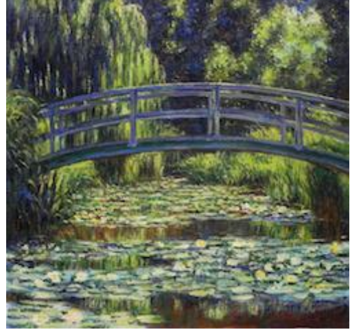
Resim 4: Claude Monet Giverny'de Japon köprü."

Suminagashi , antik Japon Ebru sanatı formu "yüzen mürekkep" anlamına gelir. Su üzerinde resim oluşur ve daha sonra soyut tasarımlar kağıt üzerine basılırlar. Bu form görüntüleri doğrudan suya da başka bir yarı-sıvı çözeltisinin yüzeyi üzerine mürekkebi az miktarda verme süreci ile oluşturulur. Bu yapıldıktan sonra, sanatçı genellikle başka bir katı ama emici yüzey üzerine büyük bir özen ve incelikle, kağıt veya tuval ile aktararak çalışmalarını tamamlar. Bu teknik yirminci yüzyılın başında “ Art Nouveau ” sanatçılarının çalışmalarını etkilemiştir.