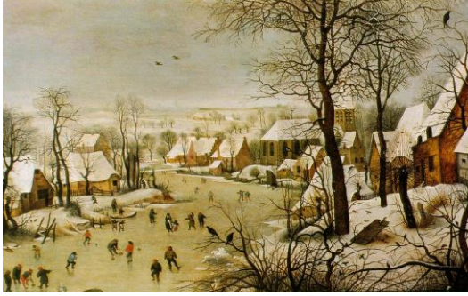
Resim 2: Baba Bruegel tarafından “Patenciler ve Kuş Tuzağı ile Kış Manzarası” 1565

Bu resim bir dönüştürme olaydır . Sadece bir yansımadan ziyade bir yerçekimidir. Nergiz’in kendi merkezine doğru devrilmesi , resmi stabilize eder ve bir enerji meydana çıkarır. Bu olay Kopernik ve Galileo ile aynı dönemde gerçekleşen, tesadüfi olmayan, Freud ’un daha sonra ‘ narsist ’ olarak adlandırdığı bir insanlık yarasıdır.