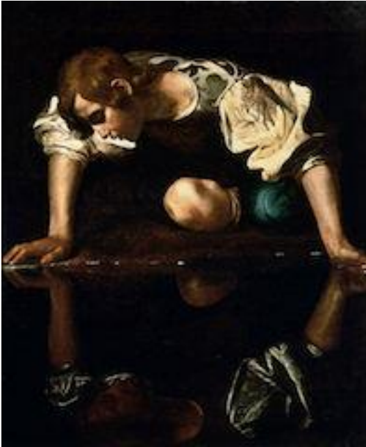
Resim 1: Caravaggio olarak da bilinen Michelangelo Merisi , tarafından "Nergis" 1597-1599

Bu resimde, kişinin asıl kişiliği ile yansıması arasında bir karşılaştırma yapılmaktadır. Bu adeta ideal ile gerçeğin yüzleşmesi gibidir. Resim diğer yandan dünyadan umduklarımız, düşlerimiz ve bunların ve ne kadar gerçekleştikleri ile ilgilidir.