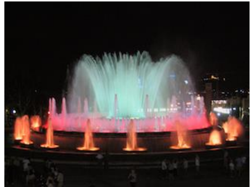
Resim 5: Montjuic, Barcelona'da Renkli fiskiyeler

1892 yılında, büyük empresyonist ressam Claude Monet , “ Giverny ” adında Kuzey Fransa'da bir köyde, evinin yakınındaki bir araziyi satın aldı. Yakınında da bir havuz inşa etti. Burası onun için yirmi beş yıl su ile sanatsal deneyimlerinin merkezi oldu. Yakından suda yansıyan parıltıları resmeden Monet bu yaptığının çağdaş resmin geleceğinde ne denli etkili olacağını bilmiyordu. Oradaki birçok çiçekler ve ağaçlar ona renk ve parlaklıklarıyla olağanüstü bir zenginlik sundu. Gölet üzerinde nilüferlerin olduğu büyük bir dizi resim yaptı. Monet resimlerinde bir geçen bir bulut, hafif esintiler ve su ya yansıyan ışığın sürekli oyunlarını göstermeyi çok iyi başarmıştır.