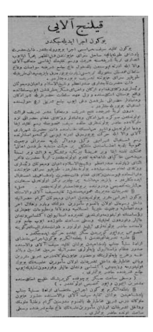
EK 2: Tanin Gazetesi 31 Ağustos 1918 tarihli "Kılıç Alayı" adlı haber