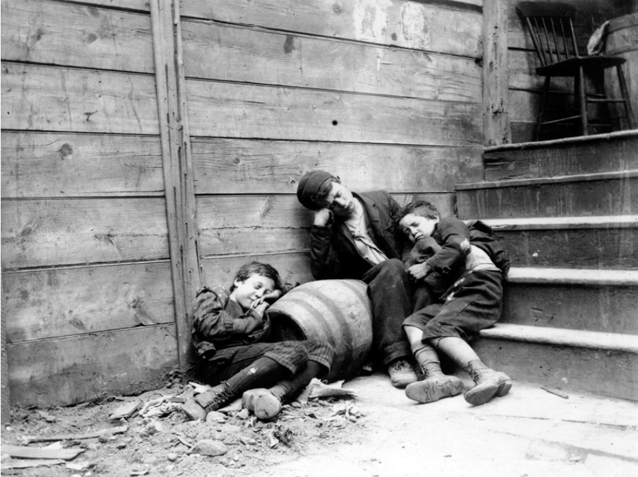
Riis'in fotoğrafı, sokakta uyuyan yoksul göçmen çocuklarını gözler önüne seriyor.

Gazeteciliğin 19. yüzyılda geçirdiği evrim ve kitleleşme ile birlikte araştırmacı gazetecilik de yeni bir boyuta taşındı. ABD'de özellikle göç, kentleşme gibi nedenlerle artan toplumsal sorunlara yönelik araştırmacı gazeteciliğin ilk örneklerini 19. yüzyılda verdiğini görüyoruz. Gerçek adı Elisabeth Jane Cochran olan, gazetecilikte Nelly Bly takma adını kullanan gazeteci 1887 yılında Joseph Pulitzer'in New York World gazetesinde işe başlar başlamaz Blackwell Kadın