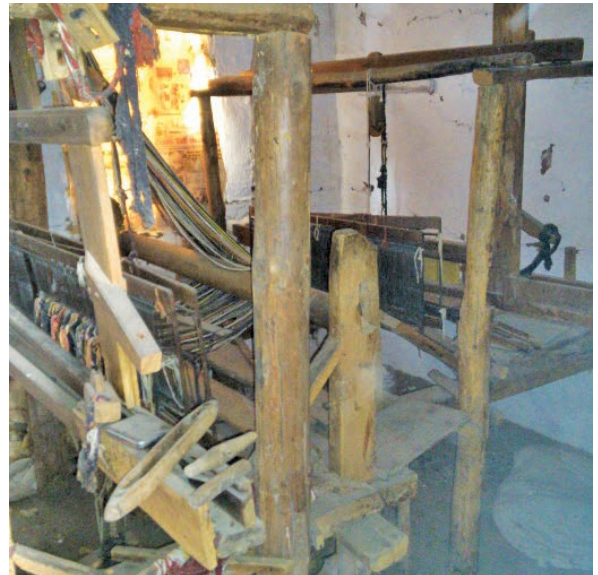
Fotoğraf 20-21: Kullanılamaz duruma gelmiş dokuma tezgahları (Arslan, 2016)