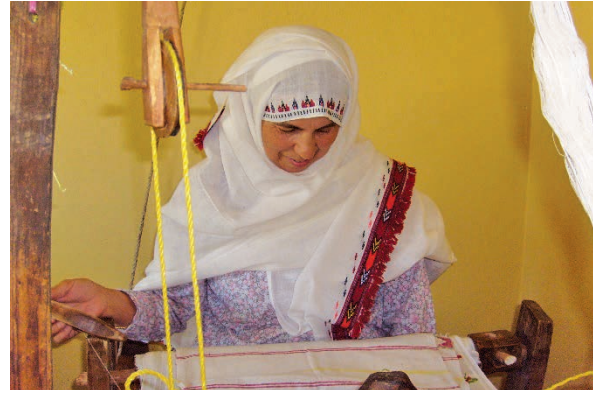
Fotoğraf 4-5: Tokalı örtmelerde desen dökümü ve dokuma işlemi (Başaran 2009)

Kastamonu’nun Selalmaz köyünde üretilen dokumalar da bezayağı örgü yapısındadır. Yörede “düz dokuma” olarak anılan bu bezlerin çözgü ve atkısında pamuk ile keten iplikler kullanılmaktadır. İplik numaraları çözgüde 20/2, 30/2, 40/2 ve 60/2, atkıda ise 20/1, 30/1, 40/1 ve 60/1’dir. Çözgü ve atkı ipliğinin dışında desen oluşturmak için bezeme ipliklerinden de yararlanılmaktadır. Düz