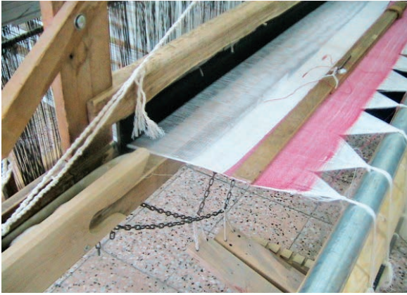
Fotoğraf 6-7: Selalmaz dokuma tezgahı (Özcan ve Başaran, 2016:116).

Şanlıurfa'da cülhacılık olarak anılan bez dokumalar hışvalı, şakkalı, direkli, puşu vb. isimlerle anılmaktadır. Bu bezlerin en büyük özelliği atkı ve çözgüsünde düzenli olarak kullanılan çizgilemeler ile elde edilen kareli/ekoseli görünüm ve üretiminde kullanılan 4 gücülü çukur tezgahlardır. Atkı ve çözgüsünde pamuk ve floş iplikler kullanılan ve sonrasında makinede işleme ile desenlendirilen dokumalar yöresel giysi ve ev dekorasyonlarında