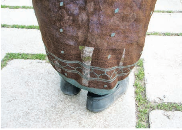
Fotoğraf 2: Ebrahim kullanımı

Yöresel olarak renk açısından “beyaz eham, boz eham, mor eham vb” (Emir, 2005; 36); desenleme açısından ise “çiçekli ve düz ehamlar” olarak dokunmaktadır. Düz ehamlarda zemin ve renkli ipliklerle ek bir desenleme yapılmadan bezayağı tekniği ile çizgiler uygulanmakta, desenli ehamlarda ise düz zemin üzerine ilave renkli ipliklerle brokar tekniğine benzer şekilde desenleme yapılmaktadır. Günümüzde bu amaçla kullanılan bazı ipliklerin orlon olduğu gözlenmektedir. Bahsedilen yörelerde geleneksel yöntemlerle evlerde veya atölye ortamlarında yaşatılmaya çalışılmaktadır.