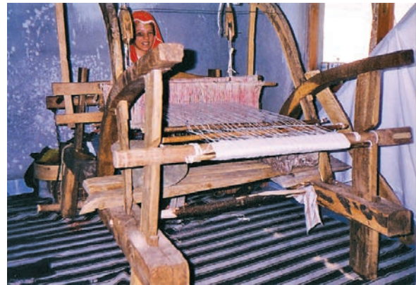
Fotoğraf 17-18: Pomak gelin kıyafeti ve dokuma tezgahı (Başaran 1996)