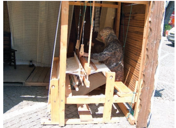
Fotoğraf 1: Eham dokumacılığında kullanılan tezgah (Başaran 2006)