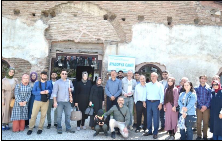
İznik Ayasofya (Orhan) Camii önünde