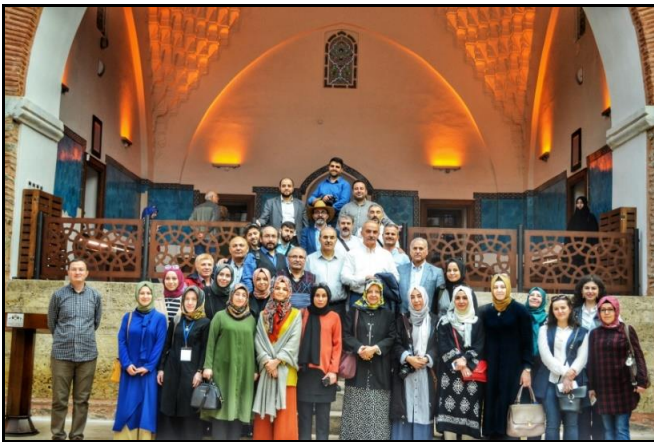
Muradiye Kur’an ve El Yazmaları Müzesi’nde