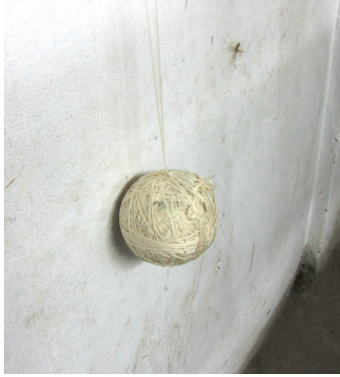
Fotoğraf-6: Kenevir İpliği Çilesi. (Fotoğraf: K. Saatçioğlu, Rize, 2011)

Tarama işlemi sonucu ortaya çıkan ince liflerin iplik haline getirildiği görülmektedir (Fotoğraf 6). İplik yapımında bölgede “iğ” (ortası şişkin, iki ucu sivri ve çengelli olan ağaçtan yapılmış iplik eğirme aleti) veya “öreke” (iplik eğirmekte