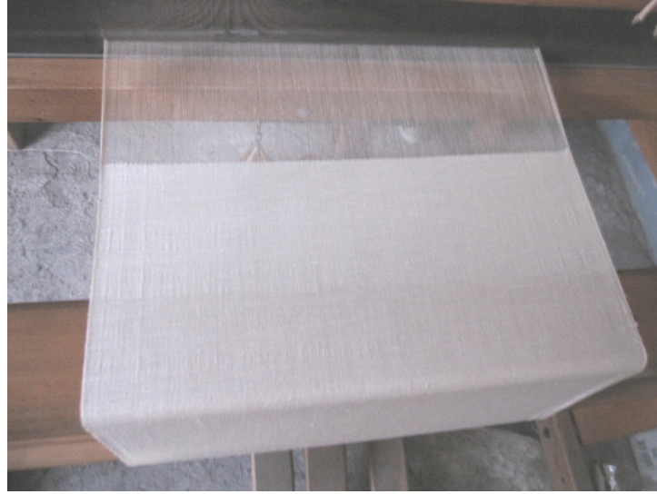
Fotoğraf-2: Dokuma Tezgahında Rize Bezi. 17

İnce ve yumuşak bir yapıya sahip olan Rize Bezi'nin, içeriğinde bulunan kenevir ve pamuk ipliklerinin nem çekme, havalandırma etkisi yapma ve havayı içerisinde tutmama gibi özellikleri sayesinde sağlıklı bir bez olduğu kabul edilebilir. Bu özelliklerden dolayı, dokumayı oluşturan ipliklerin şişmediği ve gözeneklerinin kapanmadan hava geçirgenliği ile teni havalandırdığı görülmektedir. Böylece dokumanın daha çok iç çamaşırı, gömlek gibi vücuda doğrudan temas eden giysilerde tercih edildiği ile karşılaşılmaktadır.