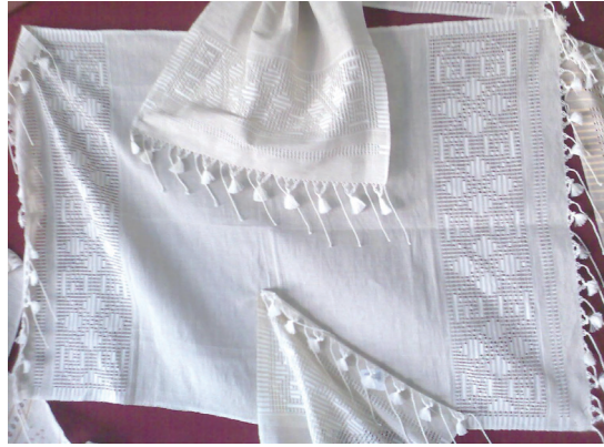
Fotoğraf-4: Rize Bezi Masa Örtüsü Takımı. 20 (Fotoğraf: K. Saatçioğlu, Rize, 2011)

ticari amaç doğrultusunda yapılan ürünlerdeki desenler ele alındığında; kaydırma desenler, bitkisel desenler (gül, lale, çay yaprağı, mine vb.) (Fotoğraf 3), geometrik desenler (baklava, üçgen, dikdörtgen, kare, kilim deseni vb.), hayvan desenleri (kelebek, kuş vb.) ve karışık desenlerin (yazı, saksı, su testisi vb.) ortaya konulduğu ile karşılaşılmaktadır. 19 Özellikle ev tekstili olarak kullanılacak olan Rize Bezleri üzerinde görülen desenlerin çoğunun ajur (delikli örgü) dokuma tekniği ile tasarlanıp oluşturulduğu görülmektedir (Fotoğraf 3-4-9).