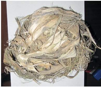
Fotoğraf-5: Kurutulmuş ve Temizlenmiş Kenevir Bitkisi Detayı. (Fotoğraf: K. Saatçioğlu, Rize, 2011)

Kenevir bitkisi çürütme işleminde kuruyan kenevir saplarının uygulanan üç farklı yöntem ile çürütüldüğü görülmektedir. Bunlardan birincisi durgun suda havuzlama (bölgede bu işleme limanlama adı verilmektedir), ikincisi akarsuda havuzlama (bölgede