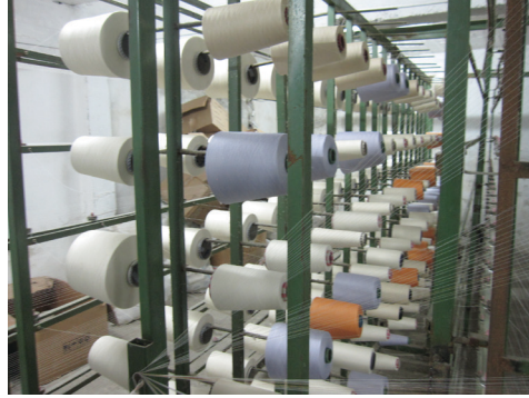
Fotoğraf-8: Çağ Tahtası (Çağlık). (Fotoğraf: K. Saatçioğlu, Rize, 2011)

Çözgü dolabı aracılığı ile dokuma tezgahına alınan çözgü ipliklerinin arasından geçen atkı iplikleri, bir tarak yardımı ile sıkıştırılır ve dokuma işlemine devam edilmektedir (Fotoğraf 9). Bu işlemin istenilen uzunlukta (metraj) devam ettirilerek, dokuma işleminin tamamlandığı görülmektedir. 32