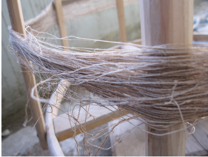
Fotoğraf-1: Kenevir İplikleri. (Fotoğraf: K. Saatçioğlu, Rize, 2011)

Bölgede üretilen dokumaları, pamuk, yün ve kenevir (bölgedeki adı ile “kendir”) ipliklerinden yapılan dokumalar olarak sınıflandırmak mümkündür. Diğer ipliklerle üretilen dokumalara oranla, kenevir iplikleri ile üretilen dokumaların sayısının daha