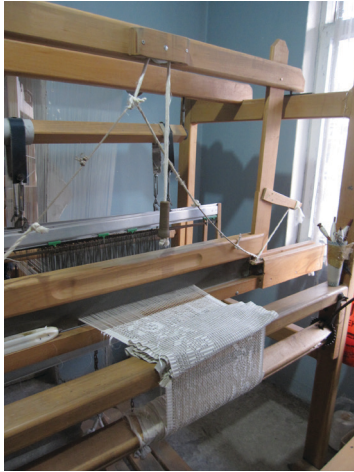
Fotoğraf-9: Geleneksel Dokuma Tezgahında Dokunan Rize Bezi. (Fotoğraf: K. Saatçioğlu, Rize, 2011)

Günümüzde Rize Bezi yapımında geleneksel tekniklerin kullanılması tam olarak terk edilmese de, diğer alanlarda olduğu gibi dokuma alanında da, teknolojinin sunduğu yeniliklerden yararlanılmaktadır. Dolayısıyla, Rize Bezi yapımında