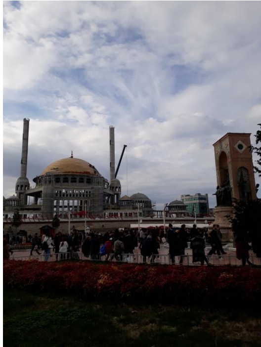
Şekil 2. Yapımı Süren Taksim Camisi ve Taksim Cumhuriyet Anıtı