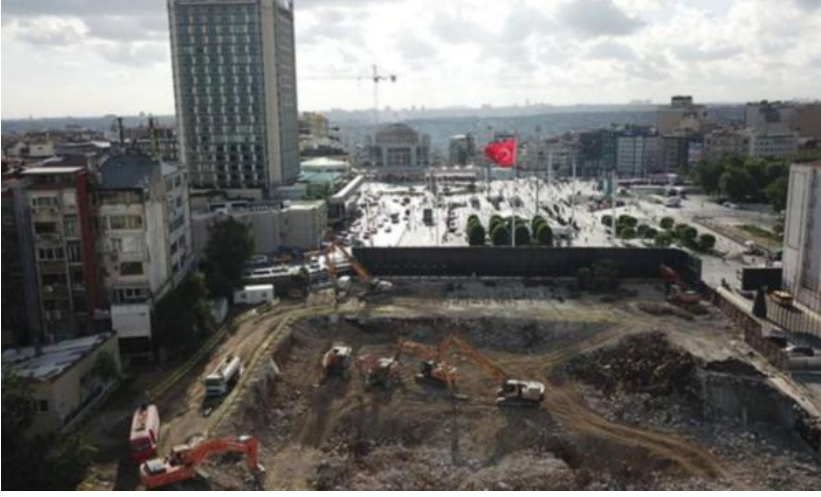
Şekil 1. Yıkılmış AKM ve Yapımı Süren Cami ile Taksim Meydanı