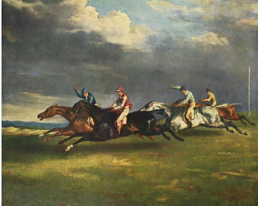
Resim 1. Theodore Gericault, Epsom At Yarışları, 1821

Bu bağlamda gerçekliği bire bir sunma anlamında resim sanatından başlayacak olursak, yaşanan gelişmeler sanat akımları doğrultusunda gerçekleşmiştir. Theodore Gericault’nun Epsom At Yarışları (1821) bu konuda örnek gösterilebilir (Resim 1). Bunun yanında yine Edward Muybridge’in Dörtnala Koşan Atlar (Resim 2) adlı çalışması göstermiştir ki “Bu tarihten elli yıl kadar sonra fotoğraf makinesi, hızla hareket eden atları anında tespit edecek yetkinliğe ulaştınca, hem ressamların, hem de seyircilerin yanıldıkları çıktı ortaya” (Gombrich, 1992: 10).