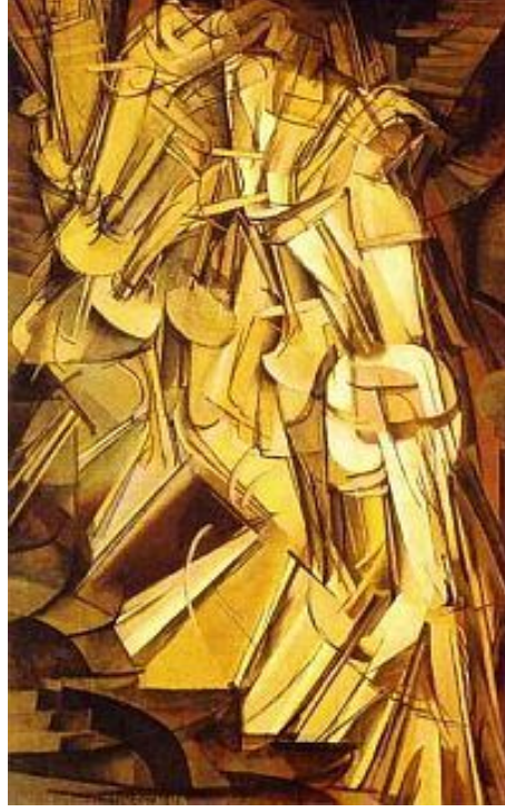
Resim 3. Merdivenden İnen Çıplak, Marcel Duchamp, 1912

Duchamp'ın bu resmi birbirini izleyen hareket evrelerinin tasviri aracılığıyla zaman içerisindeki uzamı betimliyor. Dolayısıyla yukarıda Gericault'nun söz konusu resmi (Resim 1) ile arasında bu bağlamda bir fark bulunmakta. İlk resimde söz konusu olan tasvirici yaklaşımın sanatçı tarafından yansıtılmasında kullanılan biçim ve yaklaşım, Duchamp'ın resminde (Resim 3) çok farklı bir biçim ve yaklaşım aracılığıyla gerçekleştiriliyor. Bu durumda farklı sanat dallarının farklı anlatım araç ve biçimleri arasındaki örtüşmeme durumu söz konusu. Ne var ki günümüz sanatsal üretim pratiklerinde gündeme gelen 'yeni medya' olgusu bize başka kullanım alanları da açmaktadır.