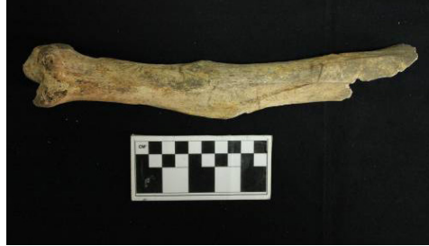
Resim 8: Giresun Adası- Kilise Dışı (14.09.2012). Tibiada kırık.

Erişkin ve erkek bir bireye ait tibiada kırık tespit edilmiştir. Tedavi edilen kemik anatomik bütünlüğünün bozulmasına sebep olmuştur (Resim 8).