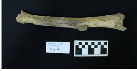
Resim 6: Giresun Adası- Kilise/ Kuzey Nef (2012), 41. birey. İyileşen tibiada enfeksiyon nedeniyle kemik oluşumu

Erişkin ve cinsiyeti belirlenememiş olan bireye ait sol tibiada kırık tespit edilmiştir (Resim 7).