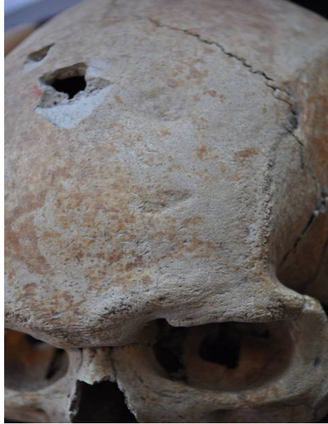
Resim 9: Tokul- Cranium frontal kemikte çökme

bireylerin tümünde yalnızca 1 adet kırık saptanmıştır. Ayrıca 1 kadın ve 1 erkek bireyin tibiasında vurma ya da çarpmadan kaynaklı yaralanma mevcuttur. Hem kafatası hem de gövde yaralanmalarının tümünde iyileşme izleri saptanmıştır. Tokul insanlarının travma örneklerinden de anlaşılacağı üzere, yaralanmaların tarım ve hayvancılık esnasında gerçekleşen kazalardan kaynaklandığı düşünülmektedir. Sonuç olarak, yaralanmanın nedeni ne olursa olsun, travmaya maruz kalan bireylerin ölüm sebeplerinin travmatik bir olgu neticesinde olmadığı görülmüştür. Kırıkların iyileşme gösterdiği de bu durumu destekler niteliktedir.