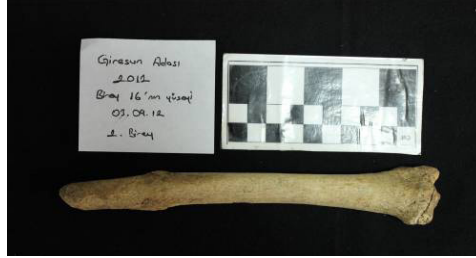
Resim 7: Giresun Adası- Kilise/ Kuzey Nef. Tibiada kırık

Erişkin ve cinsiyeti belirlenememiş olan bireye ait sol tibiada kırık tespit edilmiştir (Resim 7).