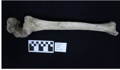
Resim 2: Giresun Adası- Açma 7- Açma 8 (2011), 1. birey.

Erişkin erkek bir bireye ait sol femur supracondylar kısmında oluşan kırık enfeksiyon sonucu tibia proximal ile tedavi sonucunda yanlış kaynamıştır. Birey hayattayken büyük ihtimalle yürümekte zorluk çekmiştir (Resim 2).