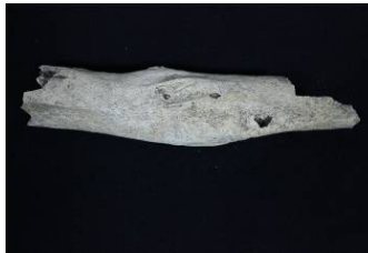
Resim 3: Giresun Adası- Açma 1 (2011). Tibiada kırık

Yaşı ve cinsiyeti belirlenemeyen Açma 1'den çıkartılan tibia parçasında şaft kırığı tespit edilmiştir (Resim 3).