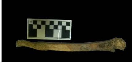
Resim 1: Giresun Adası- Açma 11 (2011), Mezar 3, 25. Birey Ulna kırığı

34 yaşında erkek bireye ait sağ ulna distalinde colles kırığı tespit edilmiştir. Tedavi edilmiş olan kırık enfeksiyona maruz kalarak anatomik bütünlüğün kısmen bozulmasına neden olmuştur (Resim 1).