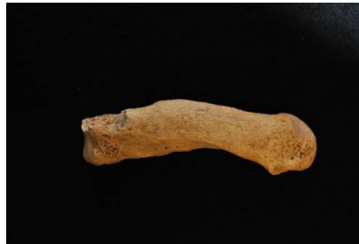
Resim 10: Tokul – Erkek bireye ait parmak kemiğinde kırık