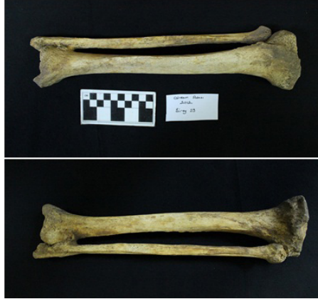
Resim 5: Giresun Adası- Kilise/ Kuzey Nef (2012), 39. Birey Fibula distal ucunda oluşan kırık enfeksiyon nedeniyle tibia distaliyle yanlış kaynaşmıştır.

41 yaşında erkek bireye ait sağ fibulada oluşan kırık tedavi sonucunda femur ile kaynaşmasına neden olmuştur (Resim 5).