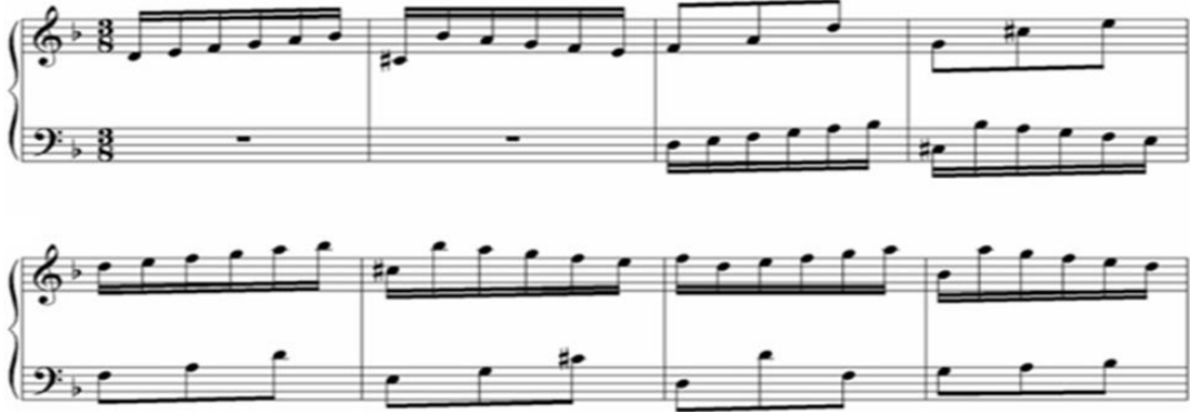
Şekil 2. Bach, BWV 775, Re minör İki Sesli 4. Envansiyon (URL 1).