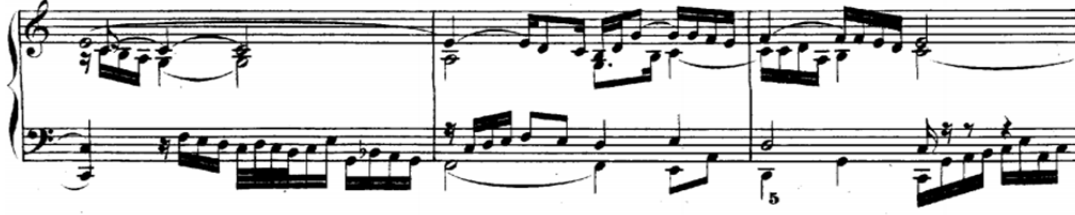
Şekil 20. Bach, BWV 870, İyi Düzenlenmiş Klavye, 2. Cilt, No. 1, Do Majör PrelüT (URL 6).