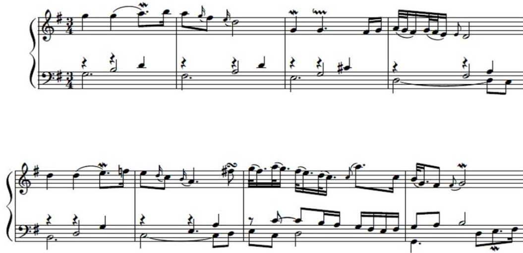
Şekil 14. Bach, Goldberg Varyasyonları, Arya (URL 4).

Şekil 15'te yer alan 1. Varyasyon, 3/4'lük ölçü sayısı ile başlar; partiler arasındaki sıkı taklit (imitation) ile ezgi, kanonik bir yapıyla işlenir. İki sesli invansyon biçiminde olan eserin ilk teması (konu) 1.-2.- 3.- 4. ölçüleri kapsar. Daha sonrasında tema sol ele geçerek 5.-6.- 7.-8. ölçülerde aynen tekrarlanır. 8'lik, 16'lık ritim kalıplarıyla bezenmiş eser sade, neşeli ve canlı karakterdedir.