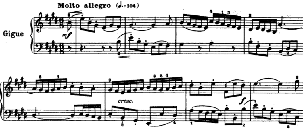
Şekil 13. Bach, BWV 817, 6. Fransız Süiti, Gigue (URL 3).