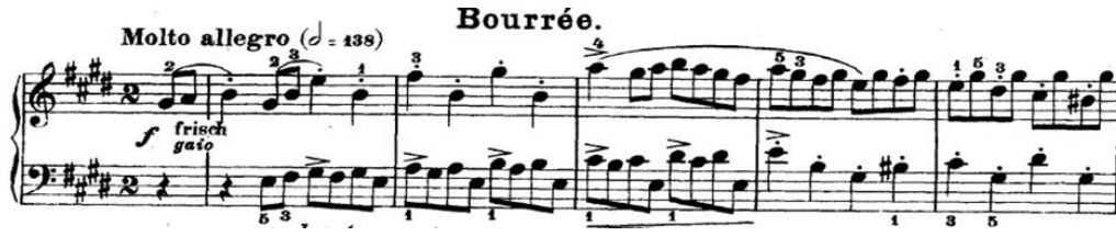
Şekil 11. Bach, BWV 817, 6. Fransız Süiti, Bourree (URL 3).