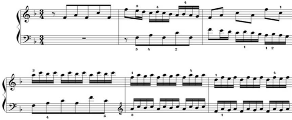
Şekil 3. Bach, BWV 779, Fa Majör İki Sesli 8. Envansiyon (URL 1).