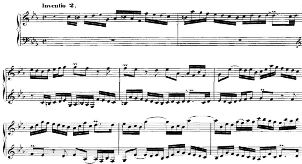
Şekil 1. Bach, BWV 773, Do minör İki Sesli 2. Envansiyon (URL1).

Şekil 1'de gösterilen BWV 773 Envansiyon, Do minör tonalitededir. 4/4 ölçü sayısı ile başlar. Eserde, kontrpuan yöntemiyle yazılan, taklit esasına dayanan yazı tarzı, "kanon" bulunur. 1. ve 2. ölçülerde "tema" (ilk motif) yer alır. Sonrasında, 3. ve 4. ölçülerde aynı motif, bir oktav pes olarak sol ele geçer. 5.-6. (Sağ el) ve 7.-8. (sol el) ölçülerde, eserin kanon yazısına dönüştüğü görülür. Melodiye can veren ritim, 32'lik, 16'lık ve 8'lik süre değerleriyle bezenmiştir.