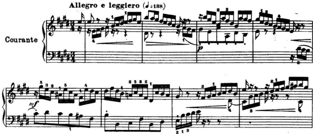
Şekil 7. Bach, BWV 817, 6. Fransız Süiti, Courante (URL 3).