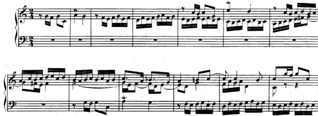
Şekil 21. Bach, BWV 870, İyi Düzenlenmiş Klavye, 2. Cilt, No. 1, Do Majör Füg (URL 6).