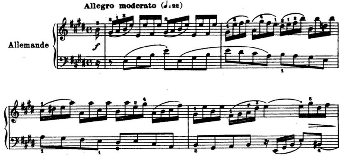
Şekil 6. Bach, BWV 817, 6. Fransız Süiti, Allemande (URL 3).

Şekil 13'teki süit formunun içinde yer alan Gigue Bölümü, 6/8'lik ölçü sayısı ile başlar. Uzatma bağları sıkça kullanılır ve "Molto allegro" tempodadır. Yapıt, Bourree ve Menuet bölümleri ile ritim/süre değerleri açısından benzerlik gösterir, sade ve icrasında teknik virtüözlük gerektirmeyen bir yapıdadır.