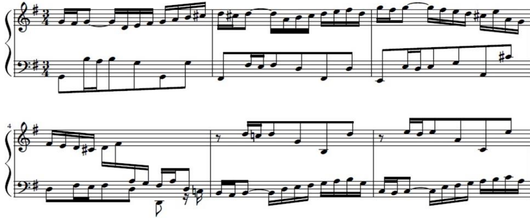
Şekil 15. Bach, Goldberg Varyasyonları, 1. Varyasyon (URL 4).