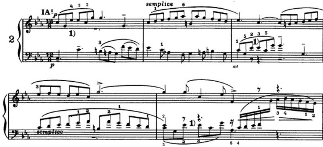
Şekil 5. Bach, BWV 788, Do minör Üç Sesli 2. Envansiyon (URL 2).