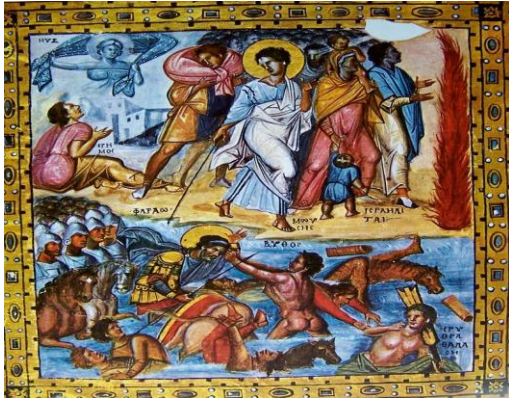
Şekil 2. “Moses The Israelites,” 10. yüzyıl. (The Book of Art, Origins of Western Art, URL, 2)

12. ve 13. yüzyıllarda klasik motifler doğrudan ve bilinçli olarak kullanılmıştır. Bu dönemde temalar Hristiyan temalarına kaymaya başladığı için bu dönem resimlerinde hem manevi dünyanın hem de maddi dünyanın imgeleri birlikte görülmektedir (Şekil 2, 3).