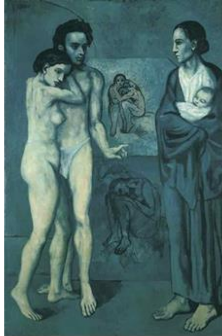
Şekil 15. Pablo Picasso, Yaşam, 1903, Tuval Üzerine Yağlı Boya, Cleveland Museum of Art, Ohio (URL, 6).

Pablo Picasso, mavi dönem çalışmalarındaki kompozisyonlarında mavi, gri tonları, yer yer beyaz ve siyah renkler ön plana çıkmıştır. Yoğun acı ve keder resmin tümüne yayılmış, bu durum renklerle de vurgulanıp güçlendirilmiştir. Yüzlerde yaşamı, canlılığı simgeleyen renkler yerine ölü ve soluk renkler