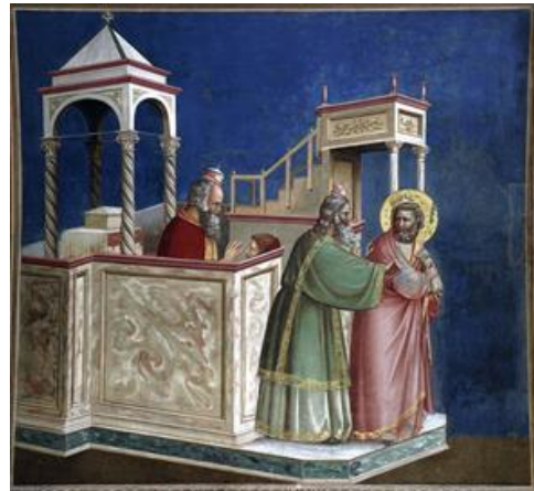
Şekil 7. Giotto, Joachim, 1304-06, Fresk, 200x185 cm Cappella Scrovegni (Arena Chapel), Padua (URL, 2)