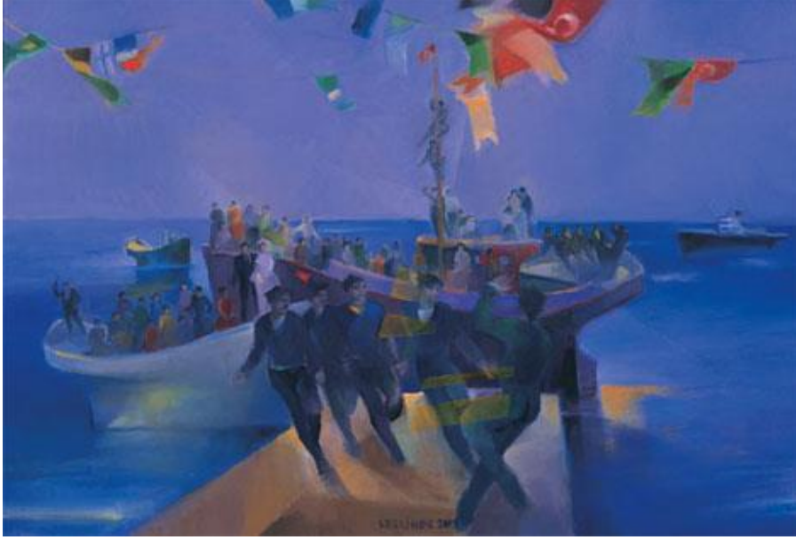
Şekil 19. Kayıhan Keskinok, "Karadeniz Düğünü", Tuval Üzerine Yağlıboya, 64x94 cm, 2003 (URL, 9).

Hüzünlü bir atmosferin hâkim olduğu bu resimde, kobalt ve Prusya mavisi ile çeşitlenerek vurgulanmak istenen anlam, figürlerdeki hareketliliğe rağmen sonsuzluk içerisinde içe dönük bir etki yaratmaktadır.