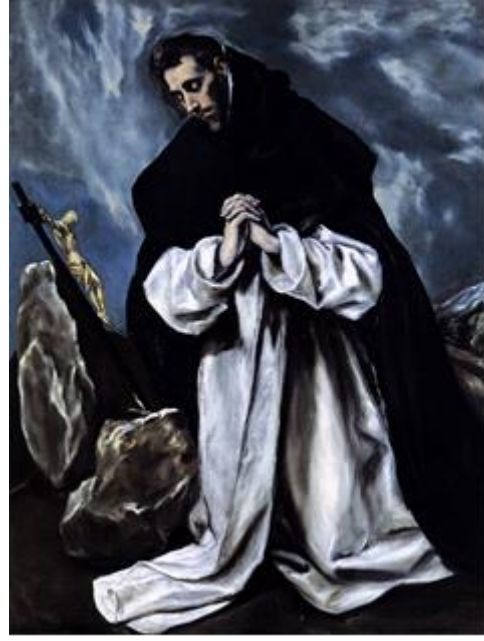
Şekil 10. El Greco, St Dominic Duada, 1586-90 Tuval Üzerine Yağlı Boya, 118 x 86 cm 200x185 cm Özel Koleksiyon, (URL, 2)

Fransız ressam Claude Lorrain resimde renk anlayışına büyük bir yenilik getirmiştir (Şekil 11). Soluk maviden koyu kahverengiye kadar yumuşak geçişlerle uzanan renk derecelenmeleriyle resimde ışık ve derinlik etkisini en iyi şekilde kullanan sanatçı bu yaklaşımı ile birçok sanatçının resim anlayışını etkilemiştir.