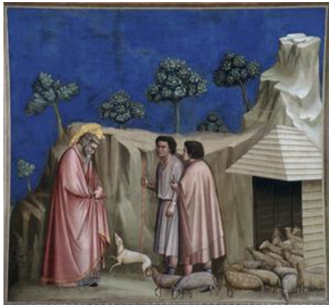
Şekil 6. Giotto, Çobanlar arasında 1304-06, Fresk, 200x185 cm, Cappella (Arena Chapel), Padua Scrovegni (URL, 2)

sembolize edilen kavramların etkisini güçlendirmiştir. Klasik sanat eserlerinde görülen mistik hava, kutsallık, dinsellik, formların ve renklerin armonileriyle yarılmıştır. Vurgulanmak istenen kavram renklere ve biçimlere yansımıştır (Aktürk, 2004).”