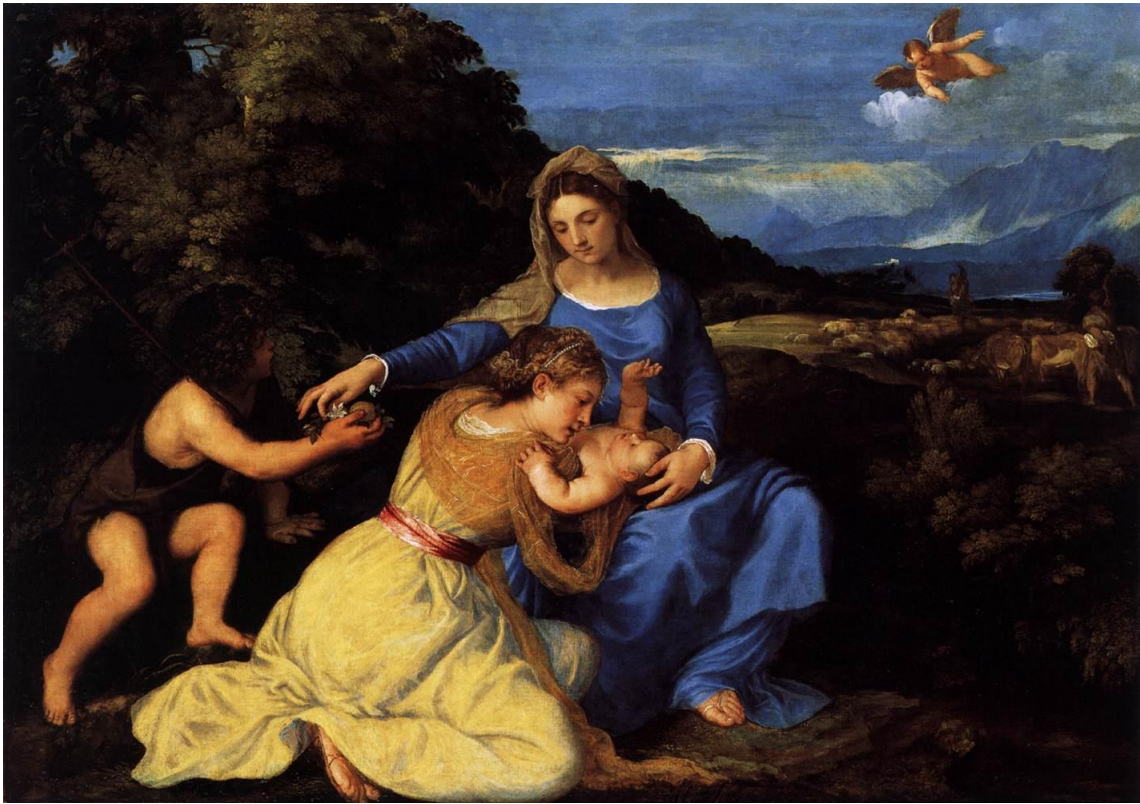
Şekil 8. Tiziano, "Meryem ve İsa," 1530, Tuval Üzerine Yağlıboya, 101 x 142 cm, National Gallery, London. (URL, 2)

ve Roma resminde renk, merkezi perspektife hizmet etmiştir. Bu nedenle resimde renk, doğada algılandığı şekli ile kullanılmıştır (Şekil 8). Öyle ki toprak, kahverengi; ağaç, yeşil; gökyüzü, mavi renklerle boyanmıştır. Işık- gölge etkileri için siyah ve beyaz kullanılmış; renge ışıklı yerler için beyaz, gölgeli yerler için siyah katılmıştır. Rengin bu şekilde kullanılmasına, temsil renk değeri denilmektedir. Temsili renk değerleri, bir dönemin dünya görüşünü ifade etmek için kullanılmıştır.