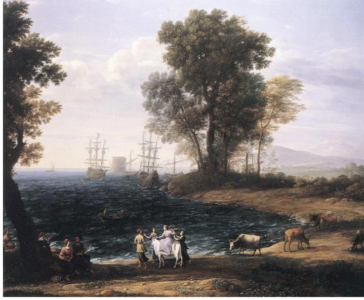
Şekil 11. Claude Lorrain, "Sahil Görüntüsü," 1667, Tuval Üzerine Yağlı Boya, 100 x 137 cm Pushkin Museum, Moscow (URL, 4).

En belirgin özelliği açık havada çalışmaları olan empresyonistler açık havada çalışarak ışığın yapraklar ve çiçekler üzerindeki titreşimlerini daha net görebilmişlerdir. "Empresyonist bir sanatçı için atmosfer titreşmektedir. Sanatçı, bu renk, ışık ve titreşimleri