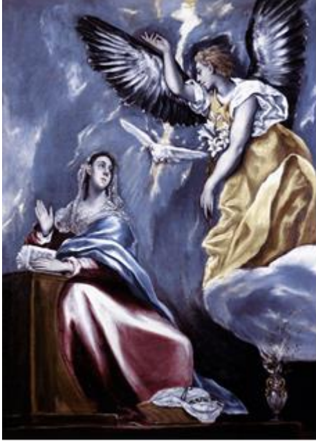
Şekil 9. El Greco, Müjde, Tuval Üzerine Yağlı Boya, 1595-1600, 91 x 66,5 cm Szépművészeti Múzeum, Budapest

resimlerde arka planı betimlemek için kullanılan mavi renk izleyende ruhani bir etki yaratmaktadır (Şekil 9, 10).