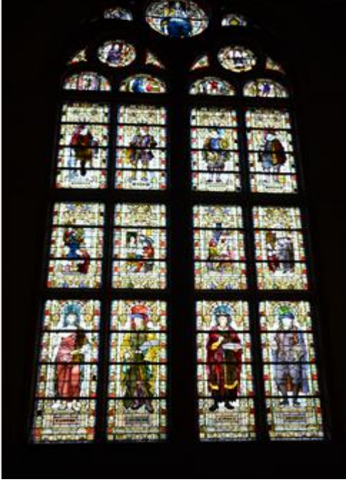
Şekil 4. Arena Chapel, Padua, Veneto (Orijinal, 2014).