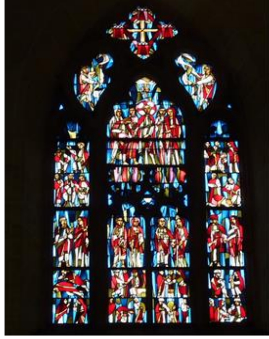
Şekil 5. Arena Chapel, Padua, Veneto (Orijinal, 2014).

Giotto di Bondone'nin eserlerinde mavi renk yeri, göğü, taşı ve suyu betimlemek için kullanılmıştır (Şekil 6, 7). Bu resimlerde kullanılan mavi renk resmi bir manto gibi sarmıştır (Gombrich, 1980). Sanatçının resimlerinde “renklerin birbirleriyle ve formlarla olan ilişkileri,