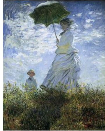
Şekil 13. Claude MONET, Şemsiyeli Kadın, 1875, Tuval üzerine yağlı boya, 100 x 81 cm National Gallery of Art, Washington (URL, 2)