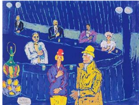
Şekil 18. Fikret Mualla, Mavi Bar, 1959, Karton üzerine guaş, 37 cm x 45 cm (URL, 8).