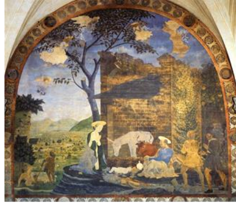
Şekil 3. Alessio Baldovinetti, Doğuş, 1460-62. (Fresk, 400 x 430 cm, Santissima Annunziata, Florence, URL, 3)

12. ve 13. yüzyıl resimlerinde kullanılan renkler antik dönem anlayışından izler taşımaktadır. Öyle ki renkler doğada oldukları gibi, yani biçimleri var olduğu gibi betimlemek için kullanılmıştır. Örneğin yukarıdaki resimlerde mavi renk havayı ve suyu betimlemek için kullanılmıştır.