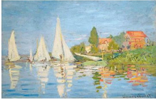
Şekil 12. Claude MONET, Regatta at Argenteuil, 1872, Tuval üzerine yağlıboya, 48 x 75 cm, Musée d'Orsay, Paris (URL, 2)

maddeleştiren kişi olmaktadır (Aktürk, 2004)." Gökkuşluğu renklerini temel alan ve doğayı tasvir eden bu sanatçılar, doğada çok bulunan mavi rengi resimlerinde ışıklı, parlak ve canlı olarak kullanmışlardır (Şekil 12, 13).