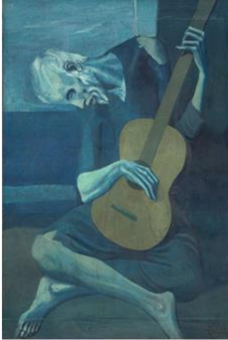
Şekil 14. Pablo Picasso, Yaşlı Gitarist, 1903, Tuval Üzerine Yağlı Boya, Art Institute of Chicago, Chicago (URL, 5).

arkadaşı Casagemas'ın ölümüyle bu dönemin başladığını dile getiren sanatçı ağırlıklı olarak kullandığı mavi rengi özellikle renklerin ruhsal yapısını anlatmak için kullanmıştır. En yakın arkadaşının ölümünün ardından dört yıla yakın mavi renk ağırlıklı resimler yapan ressam resimlerinde ölüme, acıya, umutsuzluğa yakın duran, yenilmiş, kimsesiz, yoksul, hasta ve çaresiz insanları, körleri acı, umutsuzluk ve üzüntü içinde tasvir eder (Şekil 14, 15). Bu resimlerde mavi rengin soğukluk etkisi yaratması ve insan beyninde hüznü çağrıştırmaları nedeniyle yoksulluk kavramı bu rengin tonlarıyla vurgulanmıştır (Aktürk, 2004).