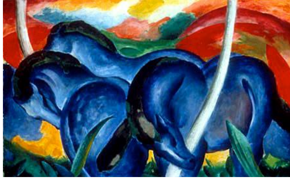
Şekil 16. Franz Marc, “Büyük Mavi Atlar,” 1911, Tuval Üzerine Yağlı Boya, 104.78 x 181.61 cm, Walker Art Center, USA. (URL, 4)

Resimlerinde yöresel konuları işleyen ressam Kayıhan Keskinok, heyecan ve hareket ögesi ve zaman zaman kaligrafik öğelerinde katkıda bulunduğu resimlerinde anlatımcı ve renkçi çizgisiyle dikkat çekmiştir. Birçok toplumda dürüstlüğün ve mantığın sembolü olan mavi renk onun resimlerinde uzaklığın ve sonsuzluğun temsilidir (Şekil 19).