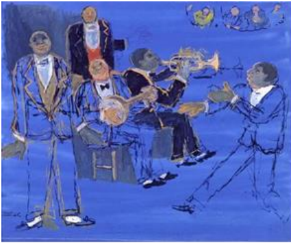
Şekil 17. Fikret Mualla, Cazcılar, 1956, Karton üzerine guaş, 51 x 65 cm (URL, 7).