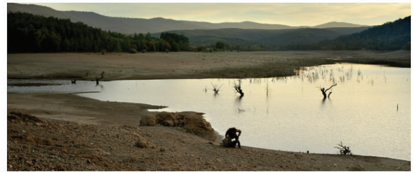
Görsel 13, 14: "Rıza ile Kavga"

Sinan öğretmenlik ataması sınavına girmek için gittiği Çanakkale'de, dedesinin evinde arayıp bulduğu eski bir kitabı satmak için kitapçıya gider. Kitapçıda Süleyman isimli yazarla karşılaşır. Kendisini yazara tanıtıp, izin isteyip konuşmak için oturur. Konuşma taşra, edebiyat, yazarlık etrafında şekillenir. 18 Konuşmaları sürdükçe yazar Sinan'ın onu dinlememesinden, iğnelemelerinden, tepeden bakan, küçümseyici tavrından rahatsız olmaya başlar. Film boyunca çeşitli sahnelerde gördüğümüz Sinan'ın, bu kibirli yani "insanın sevgi ile kendisi hakkında olduğundan daha üstün hüküm vermesi" (Spinoza, 2011: 188) tavrı sadece insanlara karşı değil Çan'a tepeden baktığı sahnede görüldüğü üzere taşra dahil her şeye yöneliktir.