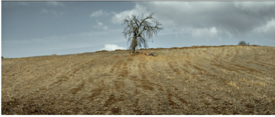
Görsel 5: “Uyku”

Bu karşılaşmayı, Spinoza’nın nefret beslediği şeyin yok olduğunu hayal eden kimsenin sevineceği önermesiyle birlikte düşündüğümüzde Sinan’ın neden duraklayıp uzaklaştığı daha anlaşılır olmaktadır: “Ruh, Bedenin etki (tesir) gücünü azaltan veya bağlayan objelerin varlığını yok edeni hayal etmeye çalışır, yani kin beslediği objelerin varlığını yok eden şeyi hayal etmeye çalışır; bundan dolayı Ruhta kinin objesinin varlığını yok eden bir objenin hayali ruhun çabasını tamamlar, yani ona sevinç verir; öyle ise Kin beslediği objenin yok olduğunu hayal eden kimse, sevinecektir” (2011: 146). Görüldüğü üzere, ilişkileri bizimle birleşmeyen, eyleme kudretimizi azaltan ve bu nedenle kederle duygulanmamıza yol açan şeyden nefret ederiz ve yok edilmesini isteriz (Deleuze, 2000: 63).