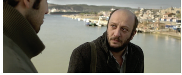
Görsel 15, 16: “Yazarla karşılaşma”

Sinan’ın kitabını bastırabilmek amacıyla başvurduğu yollardan birisi dedesinden aldığı altınları geri ödemeyen imamdan altınları almayı denemek olmuştur. Sinan’ın imamlarla karşılaşması ve yaptıkları konuşmayla ilgili olarak bir röportajda Ceylan şunları söylemiştir: