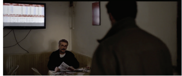
Görsel 4: "Ganyan Bayi"

Peki İdris'den dolayı mutsuz olanlar kimlerdir? ya da bir dış neden olarak İdris, Sinan dışında, başka kimleri kederlendirmektedir?