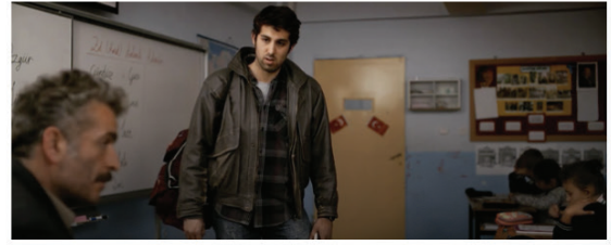
Görsel 9, 10: “Sınıfta Karşılaşma”

İdris akşam eve döndüğünde karısıyla para ve kumar oynamasıyla ilgili tartışma yaşar ve ona da kızgın cevaplar verir. Ardından Sinan’la konuşan İdris, kumar oynadığıyla ilgili gördüğü şeyi kendisine sormadan, yargılayıp hüküm vererek, infaz ettiğini söyler. Elleriyle çizdiği kayıp köpek ilanını odaya atarak, evi terk eder. Buna rağmen Sinan kumar oynamadığına inanmaz. Annesi de kaybolan köpek için ağlayışını anlatır. Bir yandan onun için üzülmesine bir yandan da kendilerine bir şey olsa kılı kıpırdamayacak olan kocasının köpeği için ağlamasına sinir olduğunu söyler. Anne ve oğul, İdris’in sevdiği köpeğini kaybetmesinden duyduğu keder ve yası komik bulmaktadır.