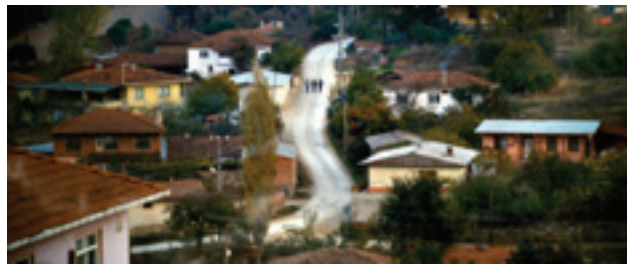
Görsel 17: “İmamlarla karşılaşma”