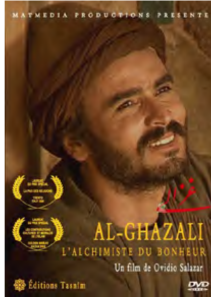
Görsel 14: Filmin afişi

Filmde, İranlı, İngiliz ve Amerikalı akademisyenlerle yapılan röportajlarda, İmam-ı Gazzali' nin düşünce sistematığının ve radikal görüşlerinin, günümüz dünyasında, siyasi akımları nasıl etkilediği de ele alınıyor.