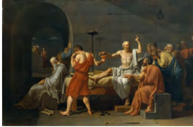
Görsel 2: Fransız Ressam Jacques-Lois David'in " Socrates'in Ölümü " adlı eseri