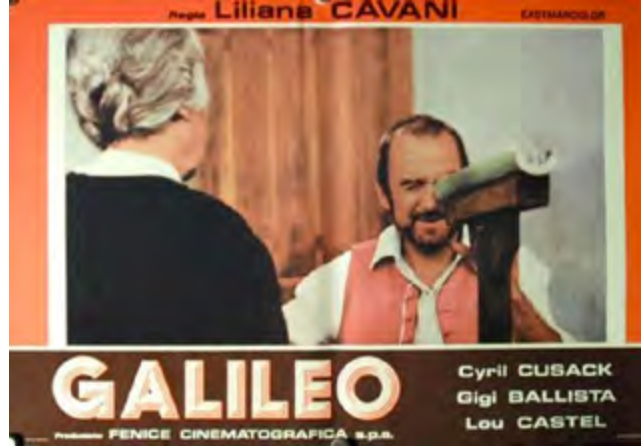
Görsel 8: Galileo (1968)

İtalyan film eleştirmeni Morando Morandini'nin, Kasım 1967 tarihli mektubuna cevaben Cavani, Galileo'nun yaşadığı tarihi bağnazlık ve fanatizm üzerine yorum yaptı ve çağdaş tartışmaların onaylanmamasıyla paralellikler kurdu (Angeli,2017:10).