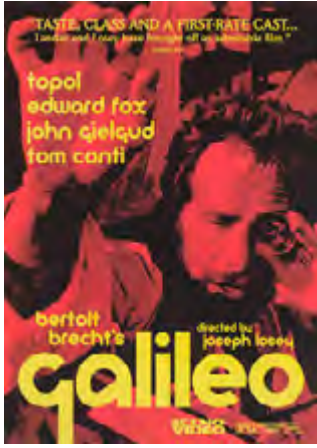
Görsel 9: Galileo (1975)