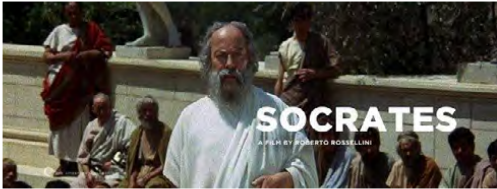
Görsel 1: Socrates