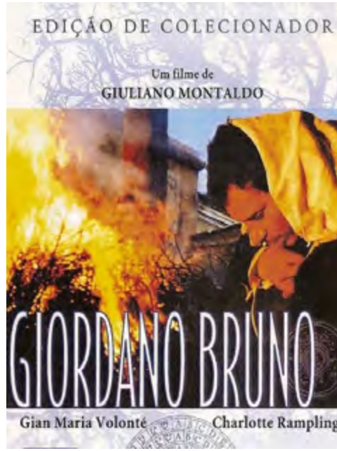
Görsel 6: Giordano Bruno

Sergio Leone'nin "İyi, Kötü ve Çirkin" filmi ile tanınan Gian Maria Volonte, filmde canlandırdığı Giordano Bruno ile çok iyi bir oyunculuk sergiler. Yönetmen Montaldo, Bruno karakterini, aşırı kompleksli, dindar, felsefe, bilim, gizemcilik, büyü ve edebiyattan beslenen bir kişi olarak çizer. Filme dair yorumlarda, didaktik anlatıya sahip olduğu yönünde eleştiriler vardır. Montaldo filminde, filozof Bruno'nun son yıllarından başlayarak, Venedik'te yakalanmasından, ev sahibi Giovanni Mocenigo'nun Engizisyon mahkemesine yaptığı ihbara, Roma'da sorgulanmasına, işkencelere, ilginç bir karakter olan Kardinal Bellarmino ile yapılan görüşmelere ve 1600 yılında Roma'da Campo dei Fiori'nin yakılarak "şehit" edilmesine olan kadar olan süreci çarpıcı ve etkileyici görsellikte anlatıyor.