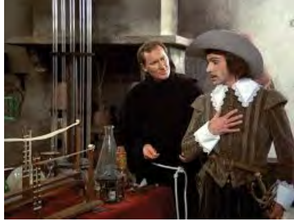
Görsel 4: Cartesio filminden bir sahne

Descartes, bu formülü, Tanrının varlığını, sonra da dış dünyanın gerçekliğini ortaya koymak için kullanmıştır. Başlıca Yapıtları; Regulae ad directionem ingenii (Aklın İdaresi için Kurallar) ,1631; Le Discours de la Mèthode (Metod Üzerine Konuşma) 1637; Mèditation de Prima Philosophie (İlk Felsefe Üzerine Metafizik Düşünceler) , 1641; Principa Philosophiae (Felsefenin İlkeleri) , 1644; Les Passion de l'Âme (Ruhun İhtirasları) ,1649 (Frolov,1997:107)