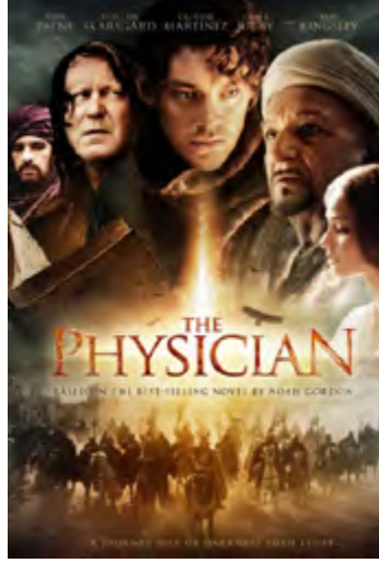
Görsel 12: The Physician filmi