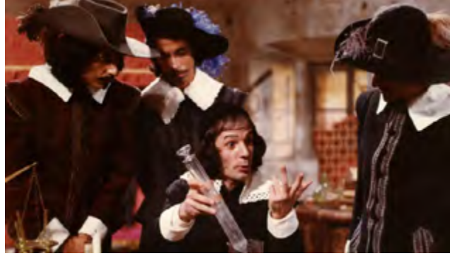
Görsel 3: Blaise Pascal filminden bir sahne

kurucularındandır. Pascal'ın Katolik gericiğin kalesi olan Cizvitlerin manevi zorbalığını eleştirerek yaptığı mücadele, Fransız toplumunun ilerici kesimince destek görmüştür (Frolov, 1997:352)