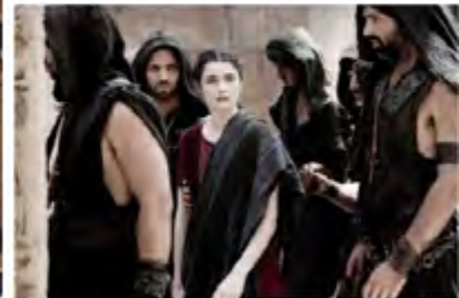
Görsel 11 : Agora filminden