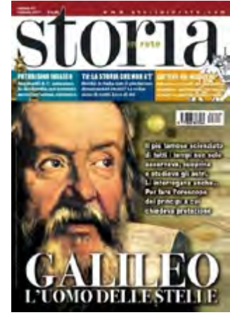
Görsel 10: Dergi kapağında