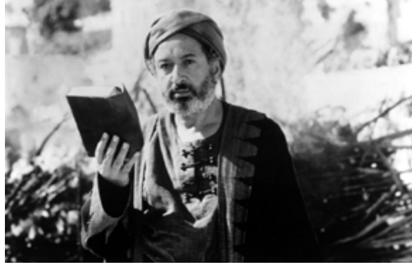
Görsel 13: filmde bir sahne

“Fikirlerin kanatları vardır. Kimse insanlara ulaşmasına engel olamaz”