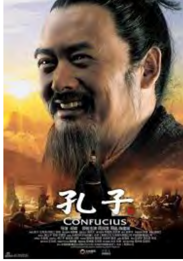
Görsel 15: Confucius filmi

Ancak, filmin en büyük kusuru, sadece parçaları bir araya getirilmiş bir senaryo olması. Bu nedenle son prodüksiyon, konunun gerektirdiği derinlikten yoksun. Konfüçyüs'ün başarılarına ilişkin bir bakış kazanıyoruz ve onun eğitim için nasıl bir öncü olduğuna dair bir fikir de ediniyoruz, ama hala her köşesinde bulmayı beklediğimiz aydınlatıcı anlar eksik. Bu nedenle "Konfüçyüs", kitleleri eğlendirebilmek için epik savaşlara ve siyasi mücadelelere odaklanan inişli çıkışlı bir film (Selzer, 04.11.2018).