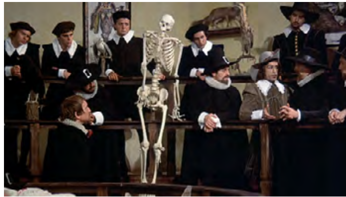
Görsel 5: Cartesio filminden bir sahne

Rossellini'nin Cartesius'u, takıntılı ve varoluşsal kriz yaşayan, “şüphenciligi” vurgulayan psikolojik bir karakter çizer. Film, İtalya'da Cartesio veya Cartesius olarak bilinir.