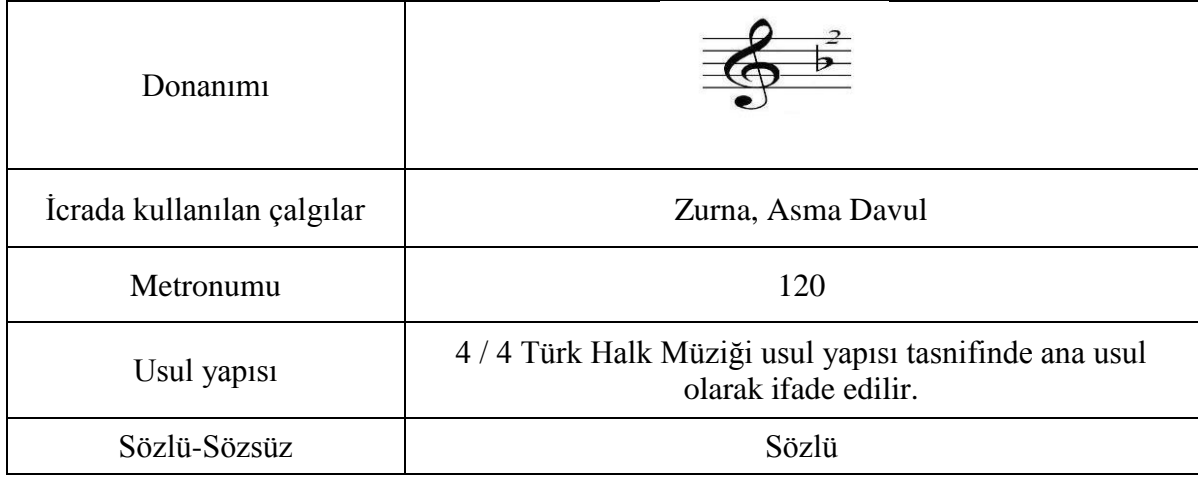
Resim 1. Adana Köprübaşı Oyunu Notası