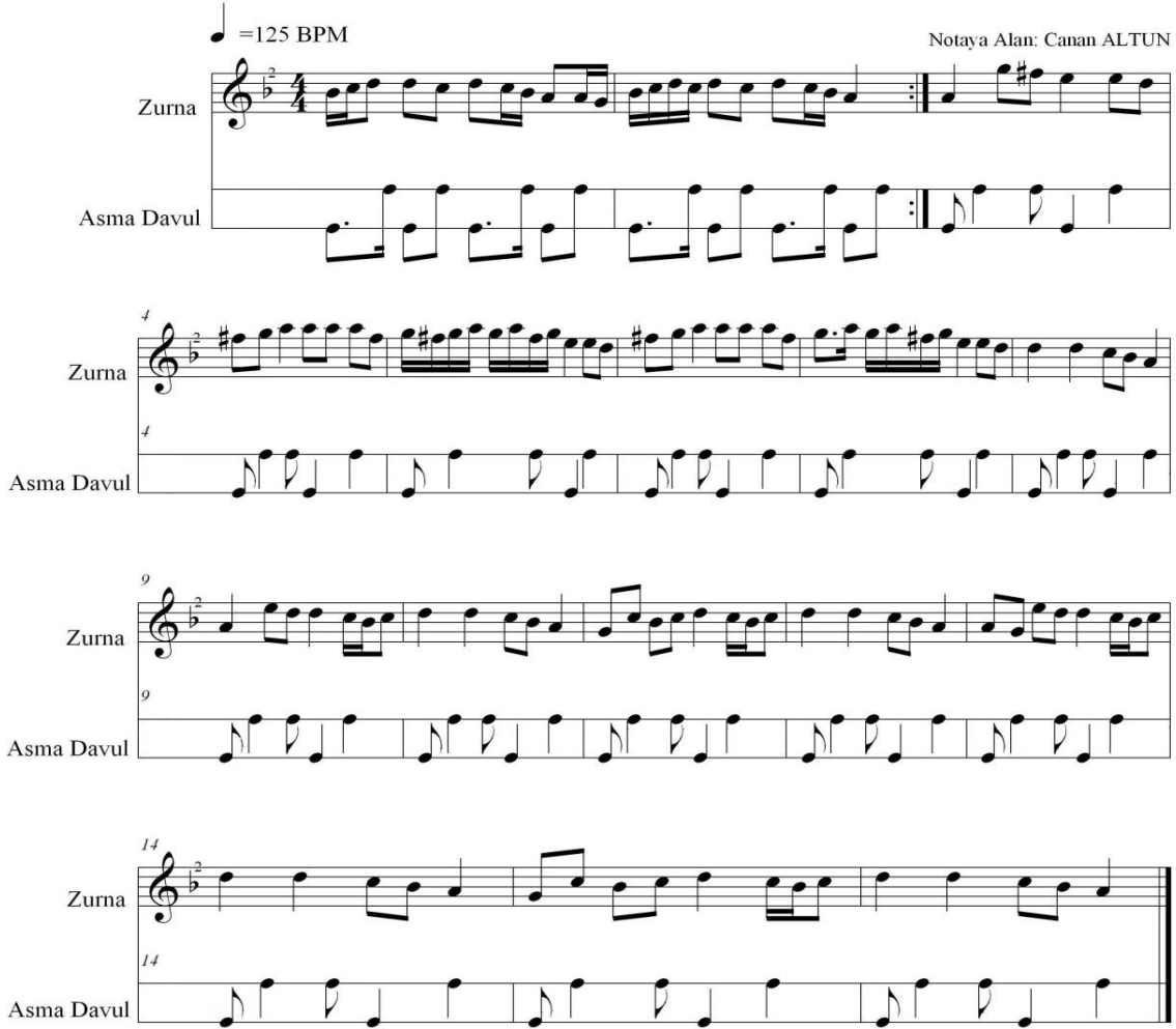
Tablo 5. Kırıkhan Oyunu Müzik ve Ritim İncelemeleri