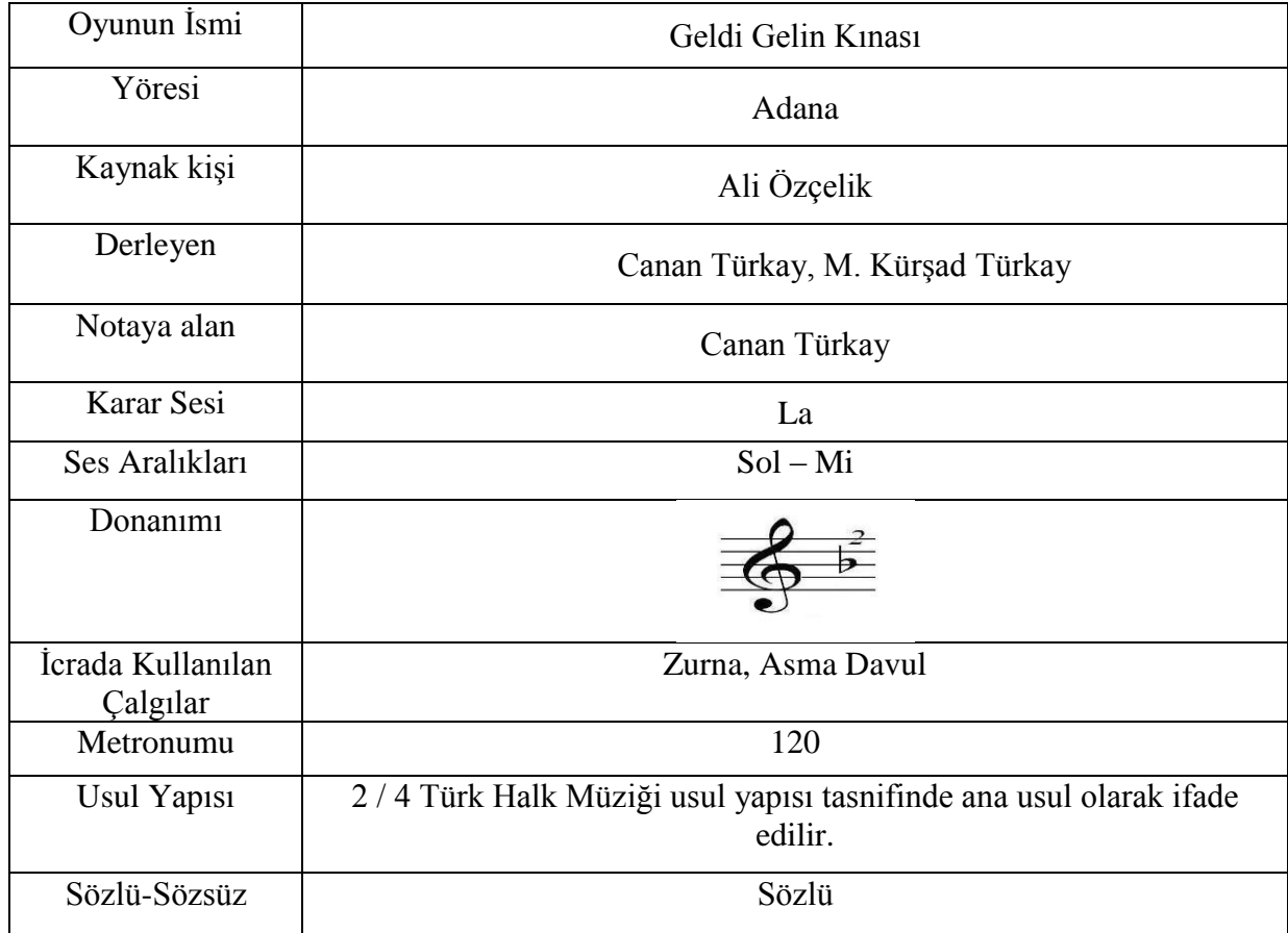
Resim 2. Geldi Gelin Kınası Oyunu Notası