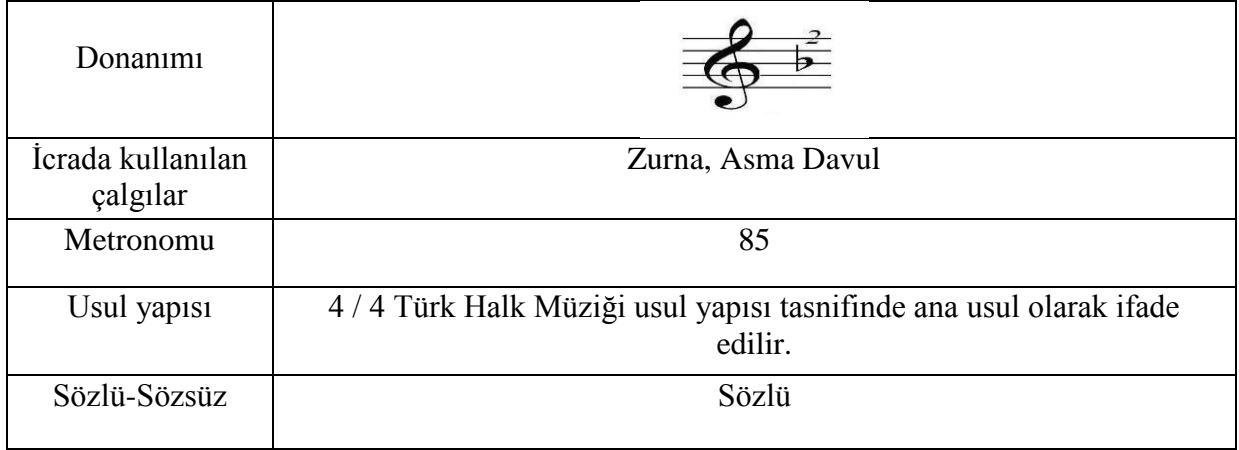
Resim 5. Kız Anası Oyunu Notası