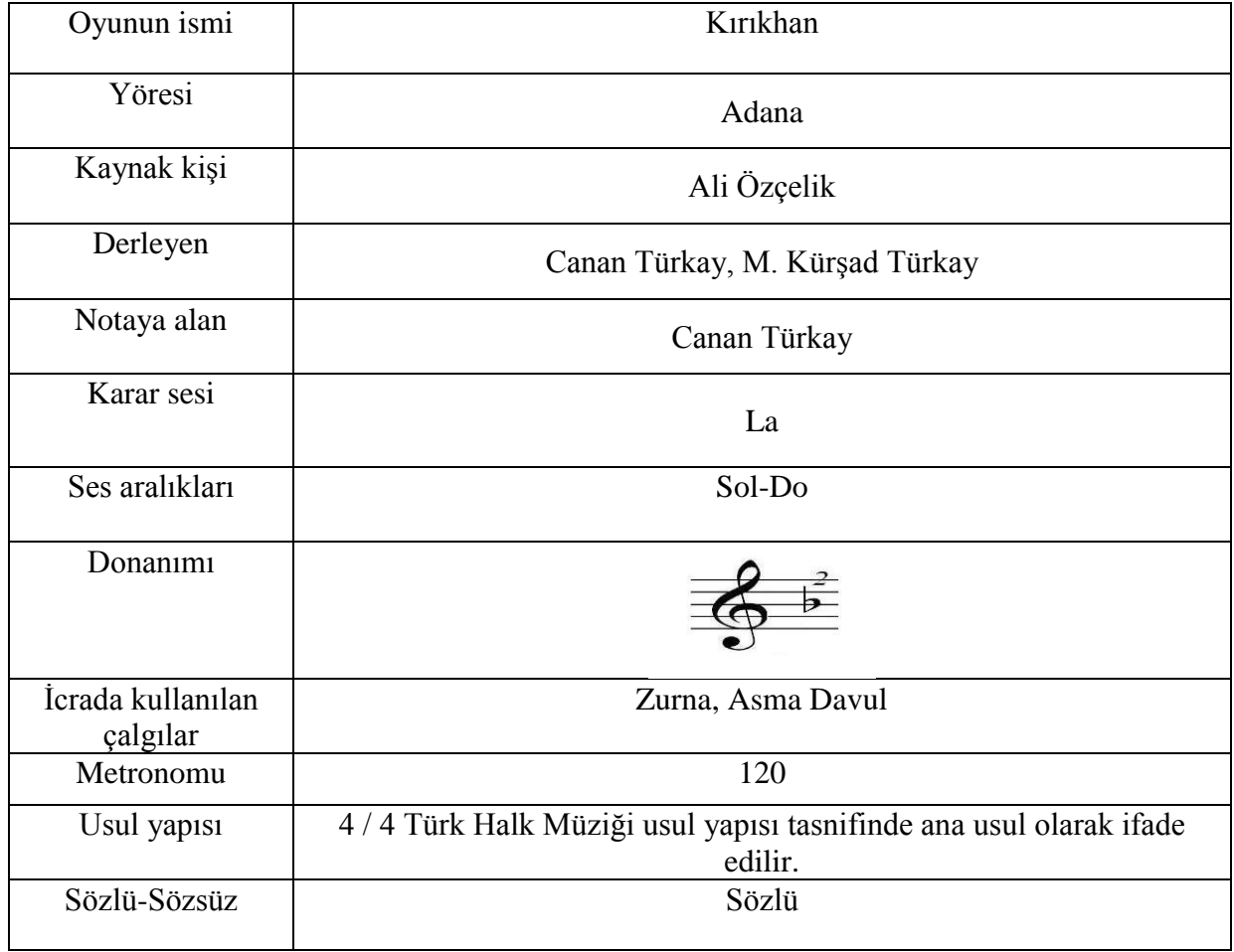
Resim 4. Kırıkhan Oyunu Notası