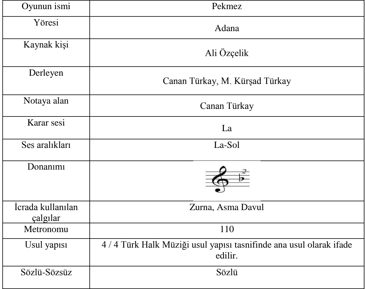
Resim 6. Pekmez Oyunu Notası